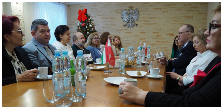
Oficjalne spotkanie z węgierską delegacją tradycyjnie odbyło się w sali konferencyjnej Urzędu Miejskiego w Urzędowie.