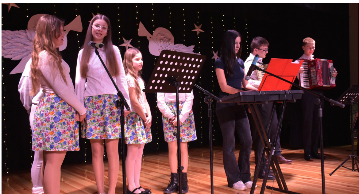
Wesole Nutki podczas występu.