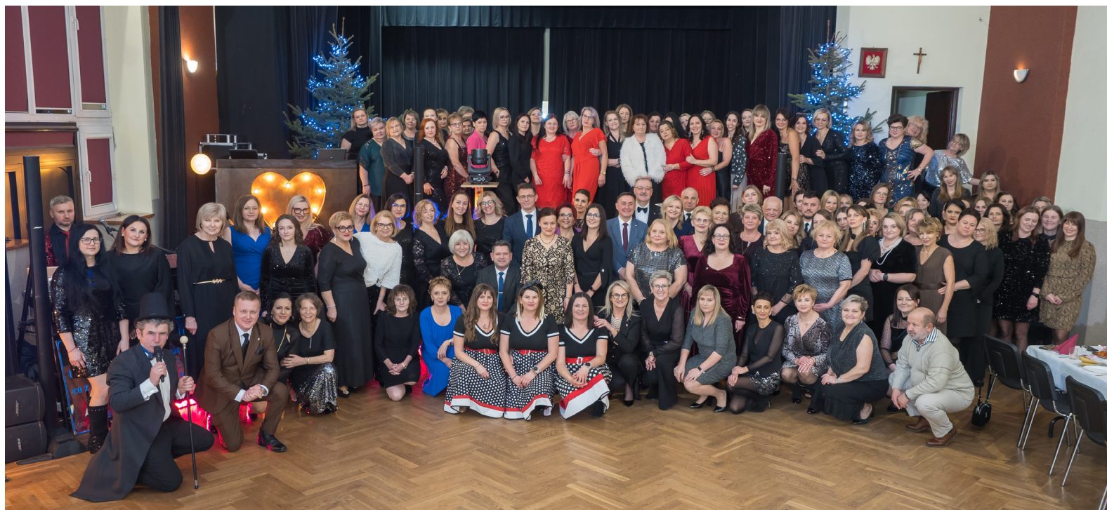
Wspólna fotografia uczestników 41. Balu Kobiet w Urzędowie.