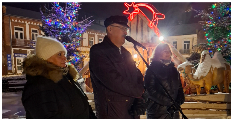
Życzenia noworoczne Burmistrza Urzędowa