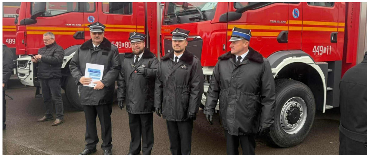
Oficjalne przekazanie auta miało miejsce na terenie Ośrodka Doskonalenia Techniki Jazdy WORD w Lublinie.