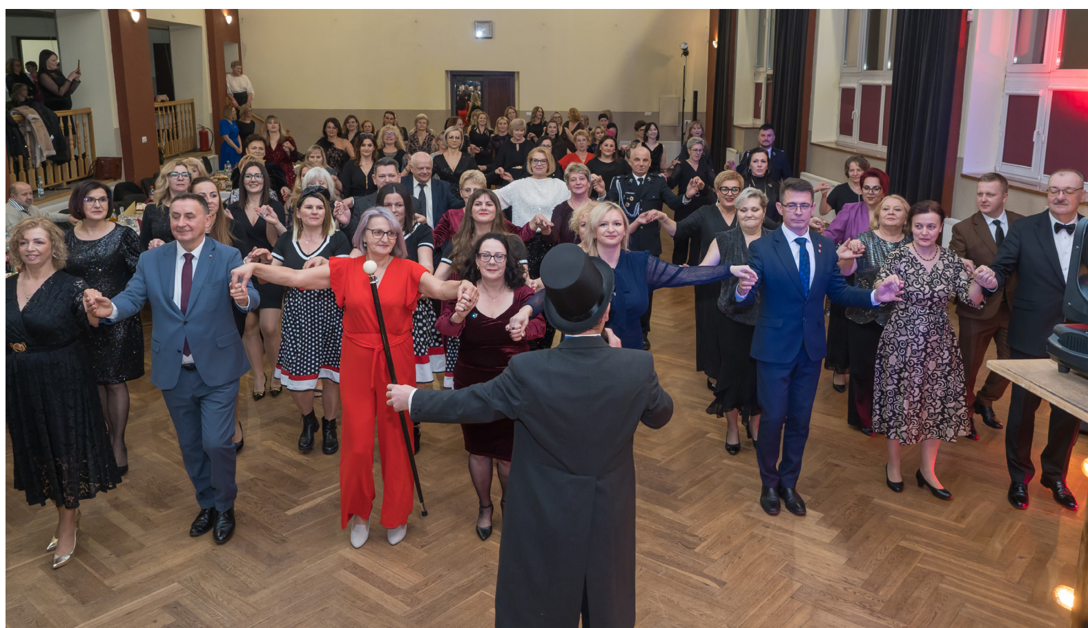
Spotkanie tradycyjnie rozpoczęto polonezem.