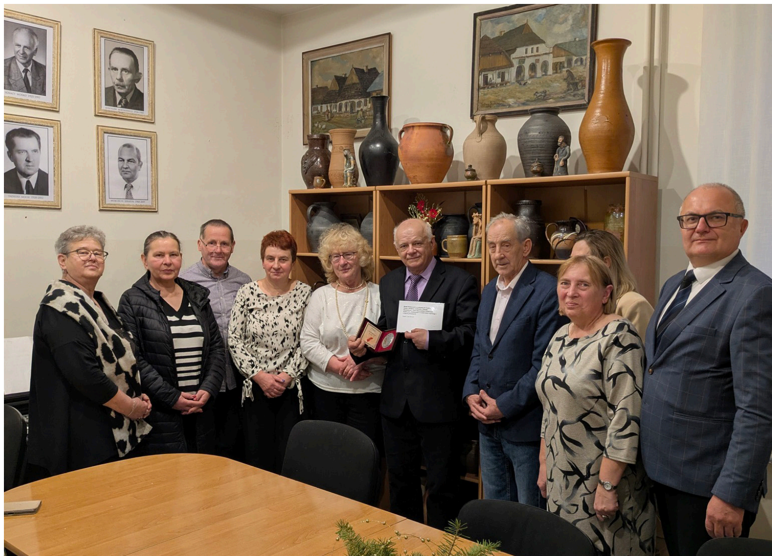
Spotkanie opłatkowe TZU.