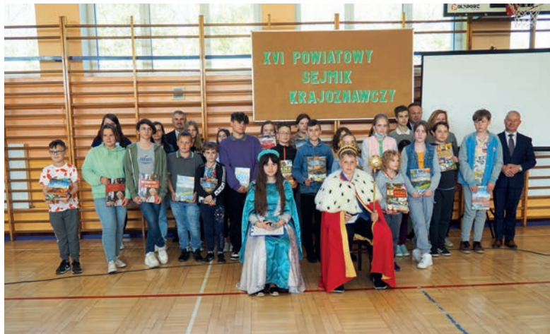
Zwycięzcy mieli okazję sfotografować się z królową i królem – patronem Jagiellonki