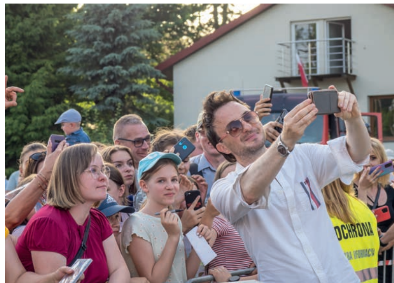
Przed urzędowską publicznością wystąpił także After Party