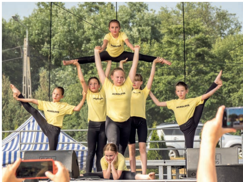
Jak zawsze nie zawiodły występy dzieci trenujących w naszym OK