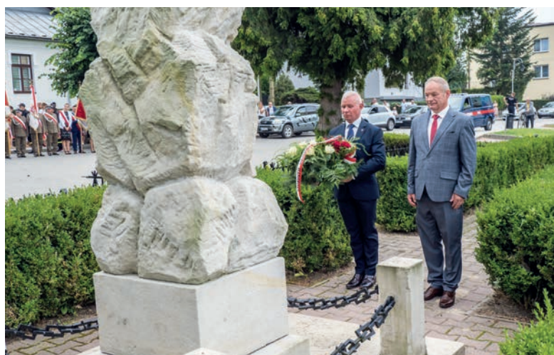
Uczczono także Marszałka Piłsudskiego