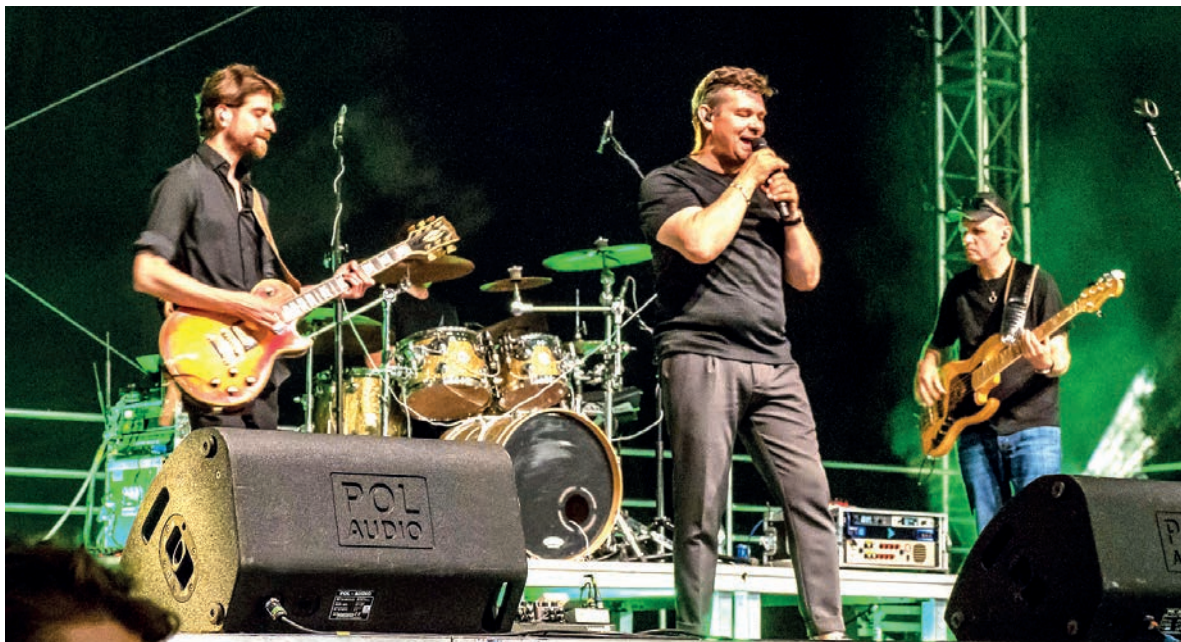
Gwiazdą wieczoru był Zenek Martyniuk

Radośnie, głośno i bardzo licznie wspólnie z Zenkiem Martyniukiem oraz zespołem After Party powitaliśmy tegoroczne lato. Wydarzenie odbyło się podczas Festynu Integracyjnego Powitanie Lata, 19 czerwca na boisku sportowym Orła Urzędów.