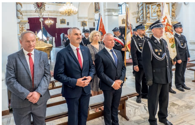
Przedstawiciele władz samorządowych podczas Mszy św.

kiej. W bieżącym roku mija 102. rocznica bitwy, która ocaliła nie tylko Polskę, lecz także Europę przed bolszewicką nawałą. Uroczystości rozpoczęła Msza Święta za