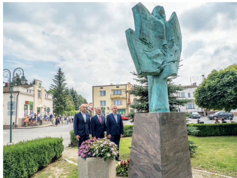
Wiązanki kwiatów złożono przy Aniele Wolności