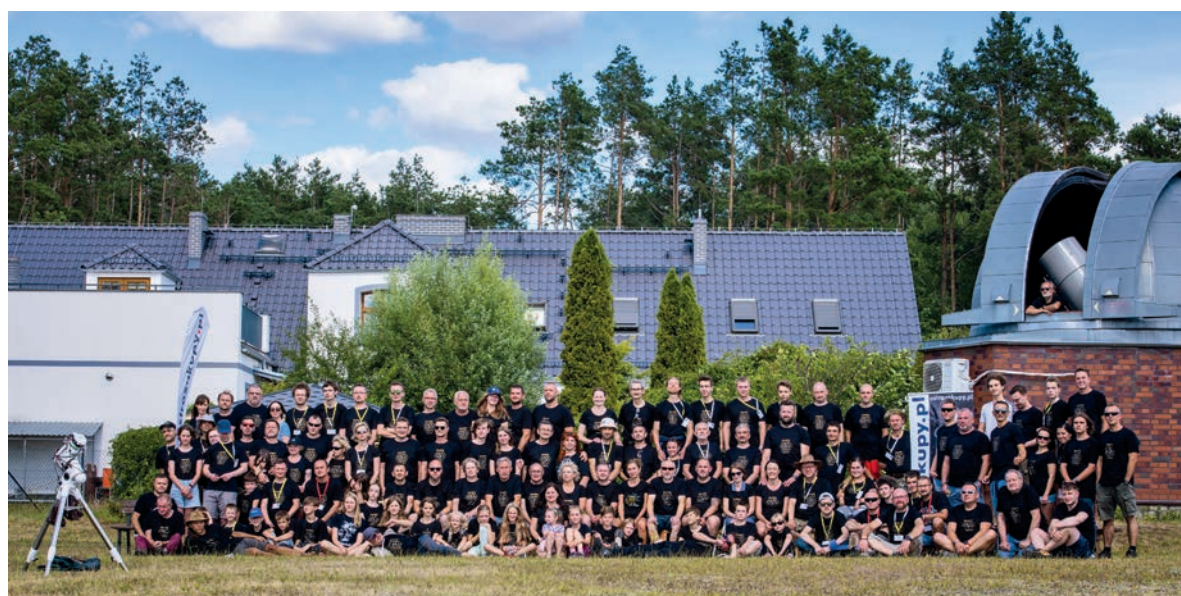
Wspólna fotografia uczestników OZMA 2022