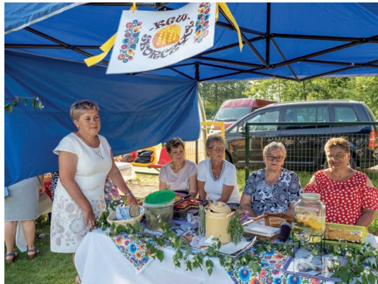
Wydarzeniu towarzyszyły stoiska KGW