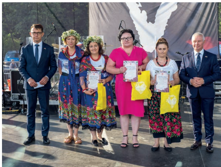
Wyróżnienia wręczano m.in. za najpiękniejsze stoiska