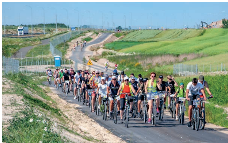
Rowerzyści tuż przy obwodnicy północnej Kraśnika