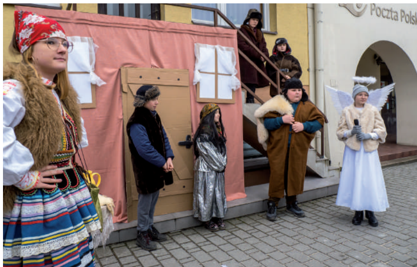
Jedna z tematycznych scenek przygotowana przez uczniów szkoły w Bobach-Kolonii.