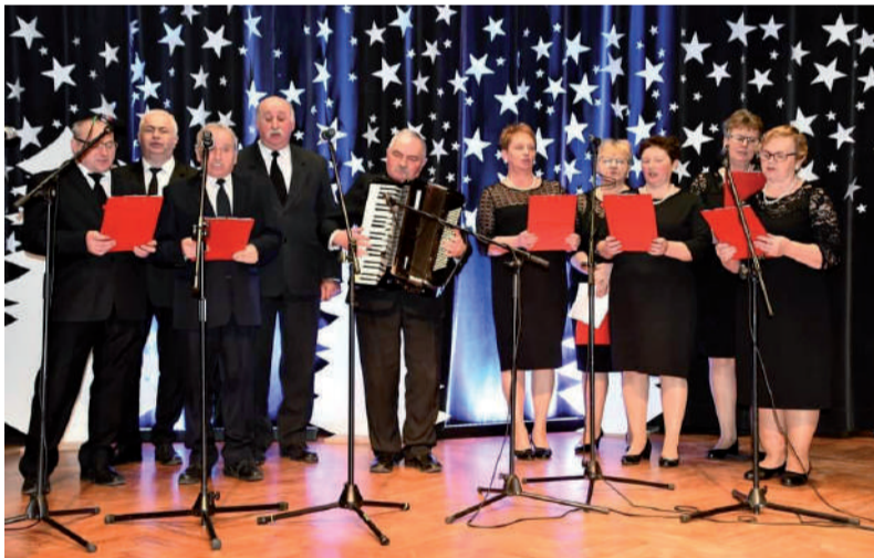
Vox Celestis otrzymał dwa wyróżnienia.