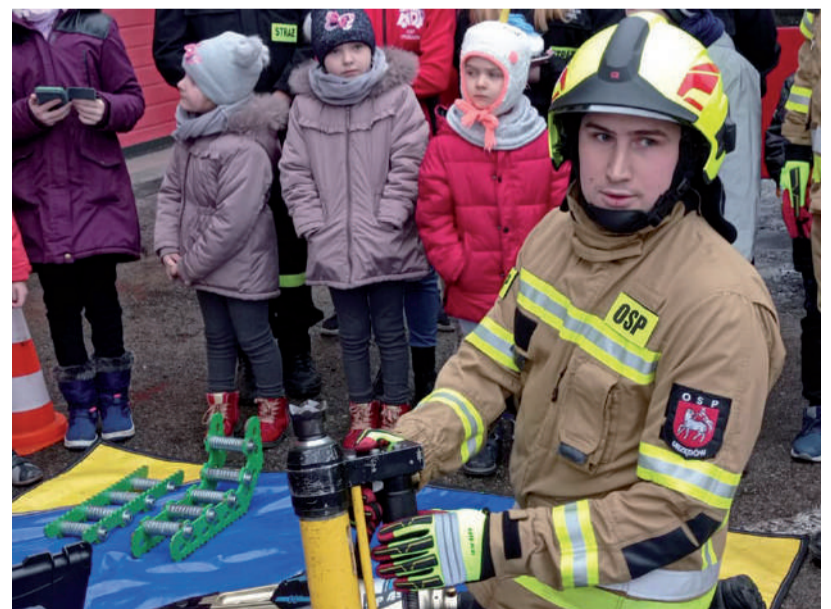
Uczestnicy ferii poznali zasady funkcjonowania Straży Pożarnej.