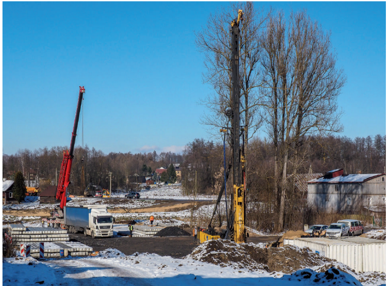
Trwają prace przy stabilizacji gruntu pod przyszłą drogę.

- Na tę inwestycję czekały pokolenia. To jest taka epoka, historyczna inwestycja dla Urzędowa. Roboty przy wycince drzew, jak i wyburzaniu niektórych budynków już trwają. Mam nadzieję, że będzie to szło sprawnie. Za trudności przeproszam, ale przy tak dużej inwestycji są niestety nieuniknione - mówi burmistrz Urzędowa,