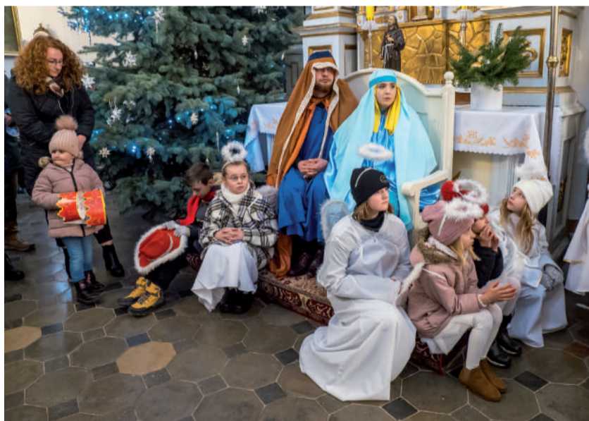
Podczas uroczystości w urzędowskim kościele.

Organizatorami byli Burmistrz Urzędowa, Ośrodek Kultury oraz parafia w Urzędowie, JC