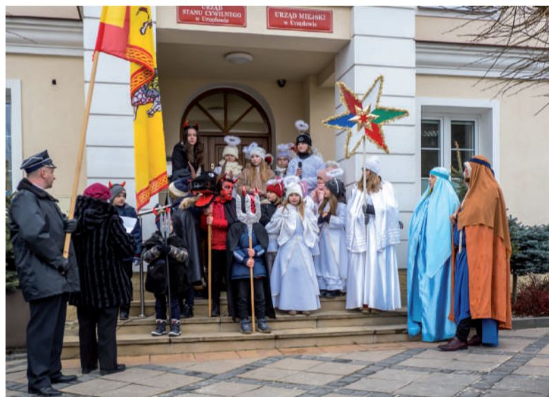
Scenka przygotowana przez uczniów szkoły w Skorczycach.