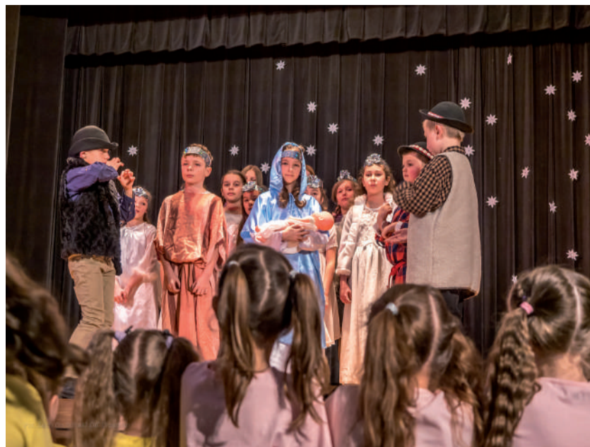
Jasełka zaprezentowane przez uczniów ZSO.