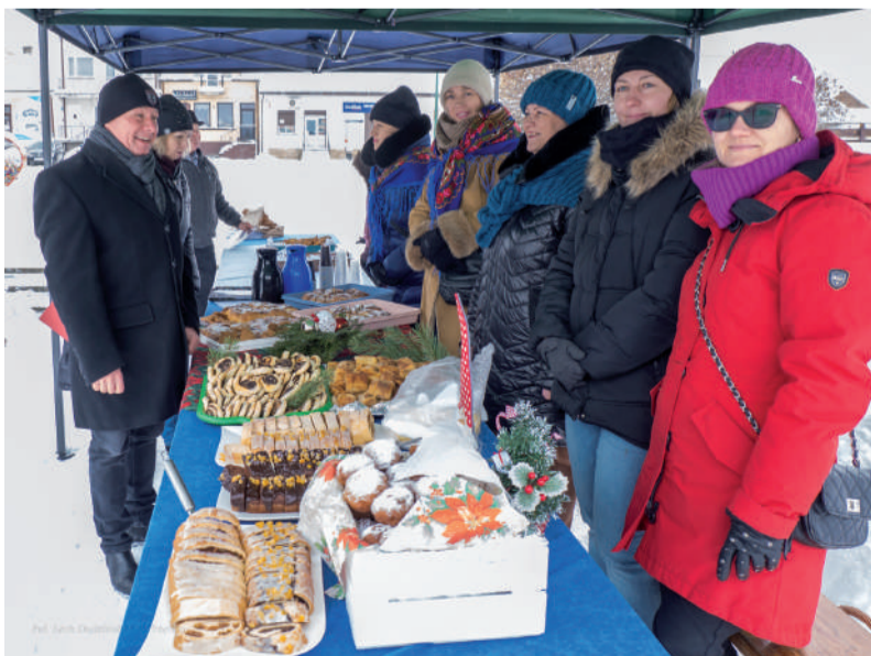
O poczęstunek zadbały Panie z Kół Gospodyń Wiejskich.