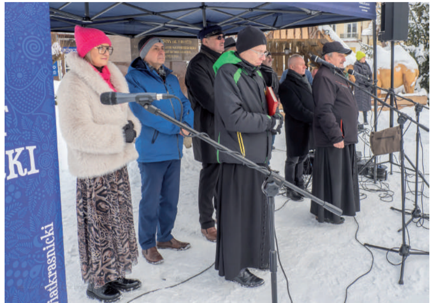
Wigilia rozpoczęła się wspólną modlitwą.