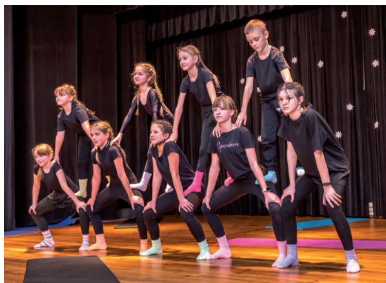
Grupa akrobatyczna - starszaki.