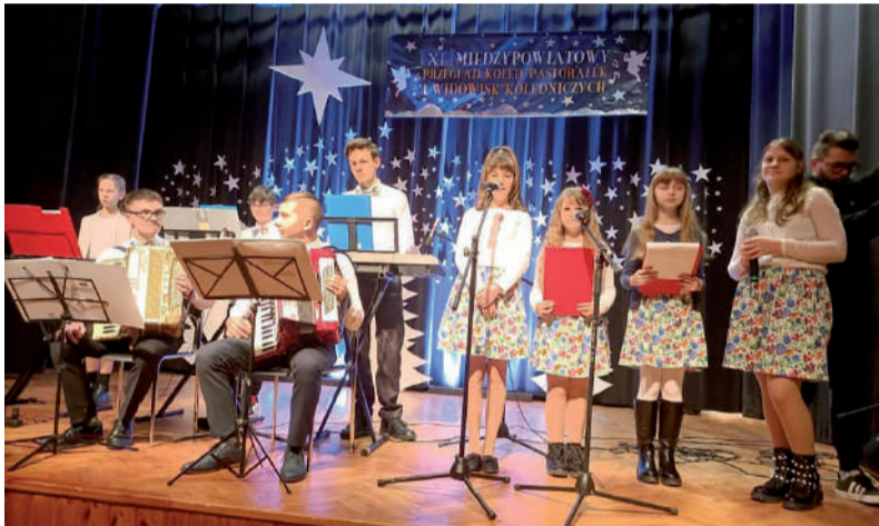
Wesołe Nutki podczas występu konkursowego.