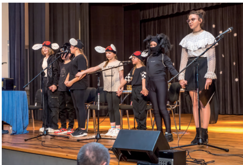
Grupa teatralna działająca w OK.

naszych zajęciach. Dziękujemy rodzicom za poświęcony czas. Te zdolne dzieciaki to nasza duma. TK