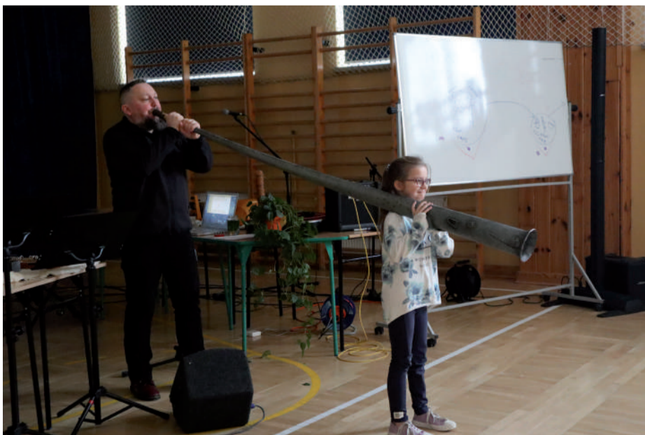
Granie na niektórych instrumentach wymagało pomocników.