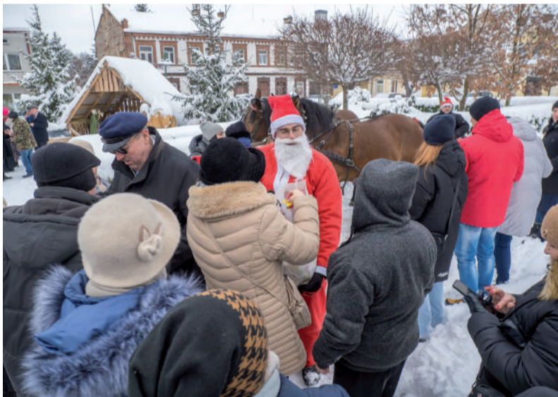
Ślodyczami częstowali Mikołajowie.