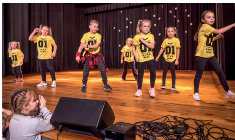
Grupa taneczna - dzieci młodsze.