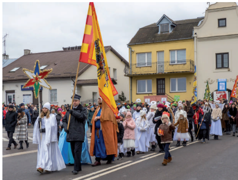
Kolejny Orszak przeszedł ulicami Urzędowa.

W organizację, jak i pomoc przy Orszaku tradycyjnie włą-