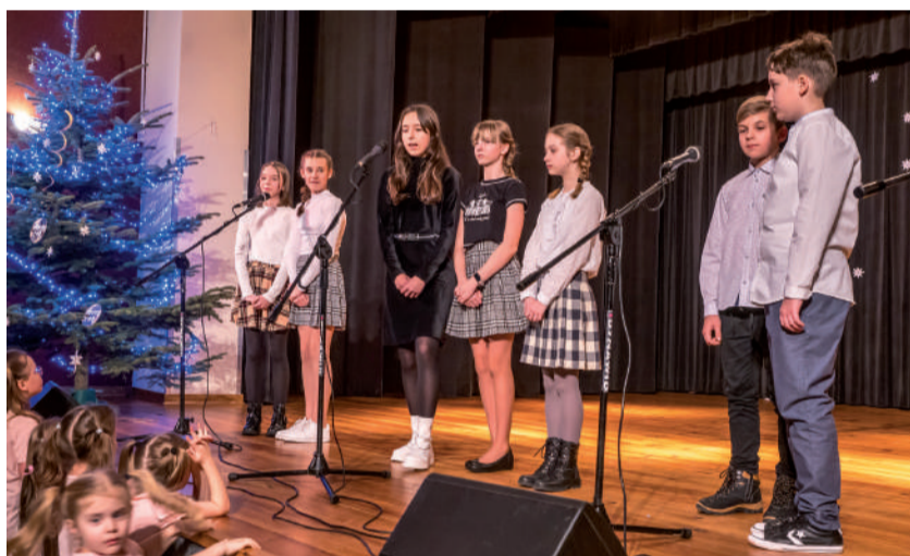
Grupa języka angielskiego - starszaki.