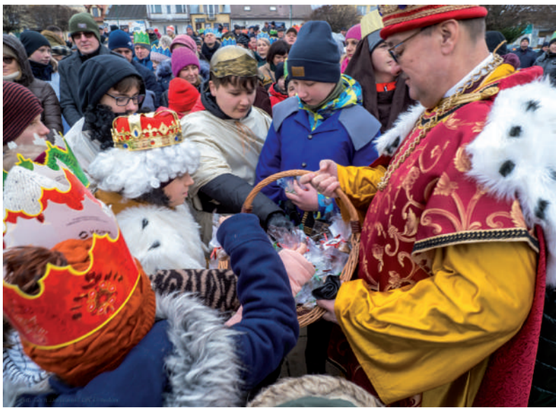
Na zakończenie Królowie częstowali pierniczkami.