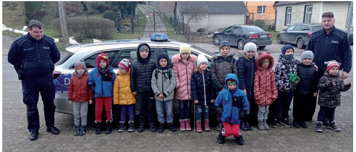
Podczas spotkania z funkcjonariuszami policji.

Spektakl teatralny „Dwie Dorotki” zrealizowany przez Studio Teatralne Krak-Art z Krakowa zgromadził ponad stu widzów z terenu gminy. Najliczniejszą grupę stanowiły dzieci z Przedszkola Publicznego w Urzędowie. Artyści podczas przedstawienia zachęcali najmłodszych do aktywnego uczestnictwa w działaniach scenicznych.