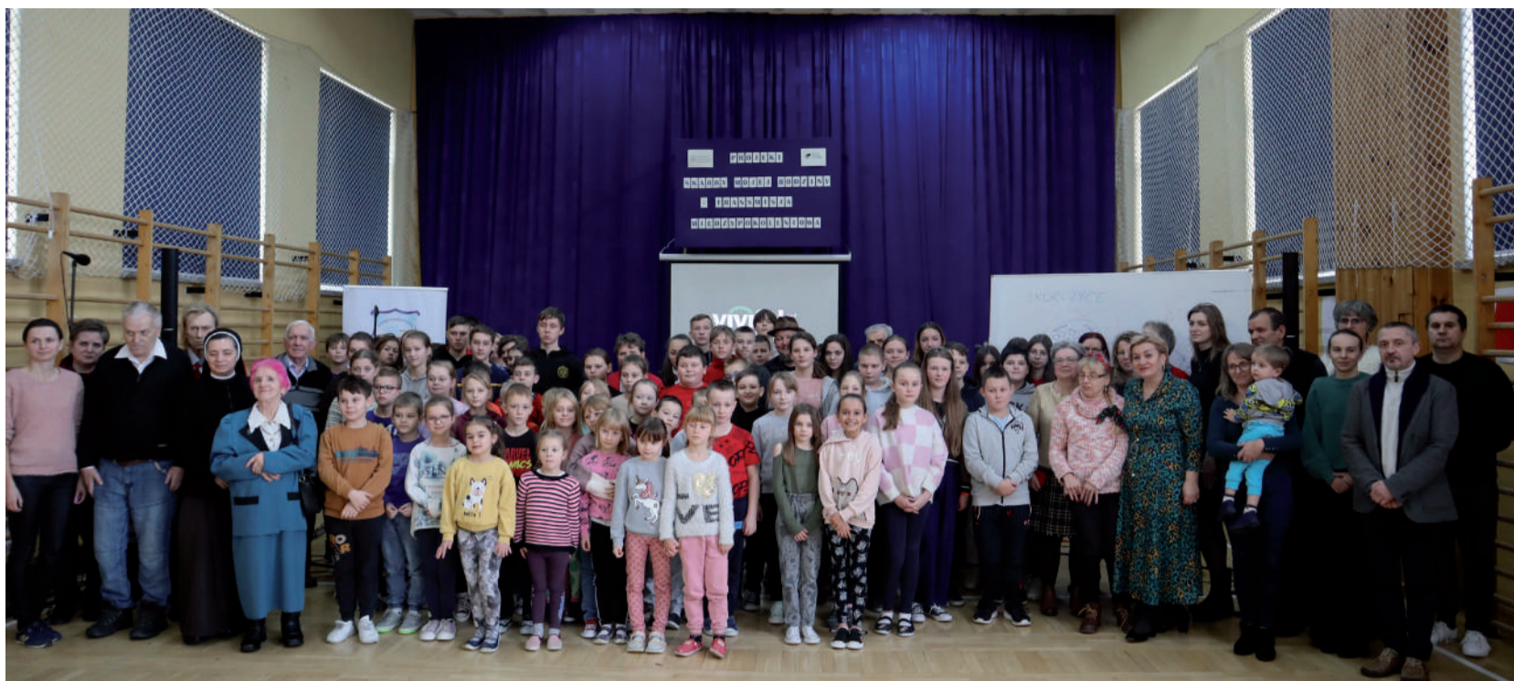
Uczestnicy instrumentalnego spotkania.