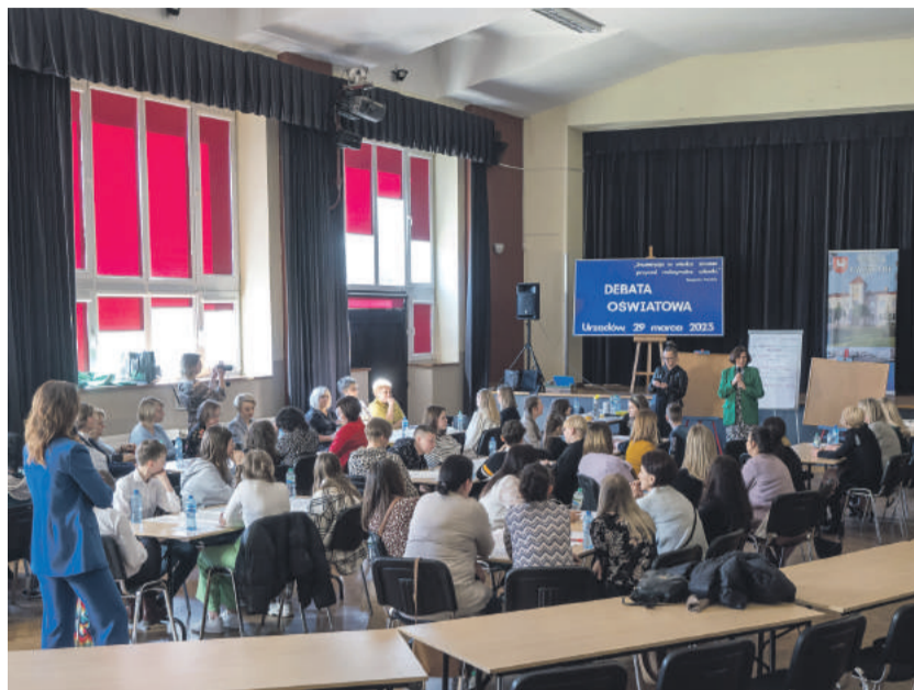
Podczas pierwszej części „Debaty oświatowej”.

W ramach usługi doradczej, gmina Urzędów bierze udział w pełnym cyklu doradztwa, na który składają się: wybór obszaru wsparcia, diagnoza potrzeb oraz wybór priory-