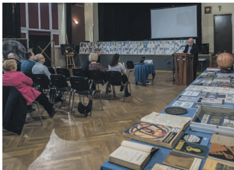
Podczas otwarcia wystawy.

Ciekawym uzupełnieniem ekspozycji był trójkąt paralaktyczny – triquetrum jaki stosował Mikołaj Kopernik do wyznaczania paralaksy Księżyca, czyli do pomiaru jego odle-