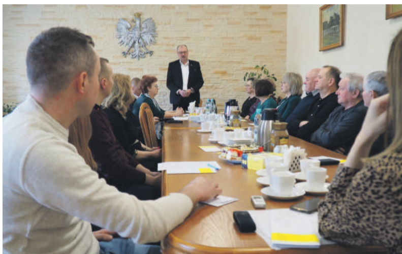
Spotkanie z sołtysami było okazją do poruszenia bieżących spraw.

Wspólne rozmowy dotyczyły spraw bieżących. Burmistrz przedstawił sołtysom i sołtyskom stan realizowanych przez gminę inwestycji. Wśród poruszanych tematów pojawiła się m.in. kwestia remontów dróg, czy czystości w sołectwach. Przedyskutowano również kwestie dotyczące prowadzonych właśnie zmian w statucach sołectw oraz kwestie wydłużenia kadencji sołtysów i rad sołectkich, a także diet pobieranych przez sołtysów. JC