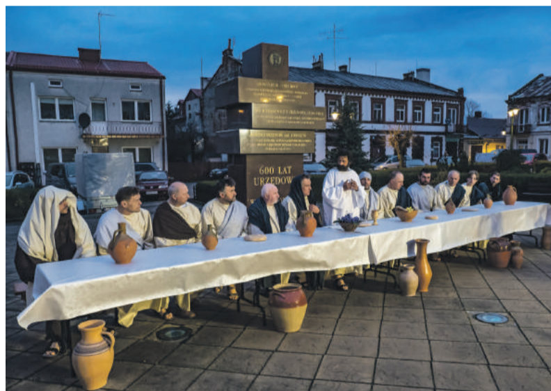
Scena ostatniej wieczerzy Jezusa wraz z apostołami.

Podkreślać też trzeba, że jest to niezmiernie budujące, że jeżeli chcemy to potrafimy znaleźć czas i chętnie współpracować dla dobra ogółu, dla naszych mieszkańców, dla młodszych pokoleń, dla nas samych. JC