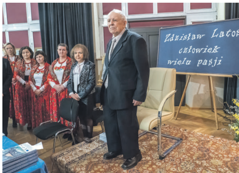
Jesteśmy dumni, że taki człowiek mieszka w naszym środowisku.

Z dniem 4 kwietnia 2023 r. objął stanowisko Sekretarza Gminy.