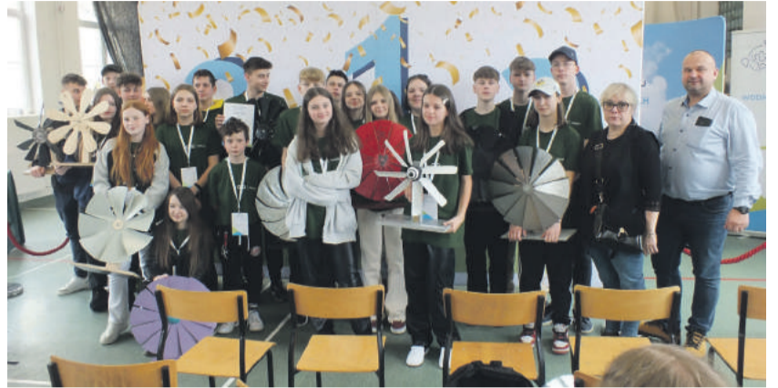
Uczniowie naszych dwóch gminnych szkół podczas konkursu w Jarosławiu.

W dniu 25 marca 2023 uczniowie z Zespołu Szkół Ogólnokształcących w Urzędowie i Szkoły Podstawowej w Moniakach wzięli udział w eliminacjach regionalnych PGE Turnieju Maszyn Wiatrowych 2023, który odbył się w Jarosławiu.