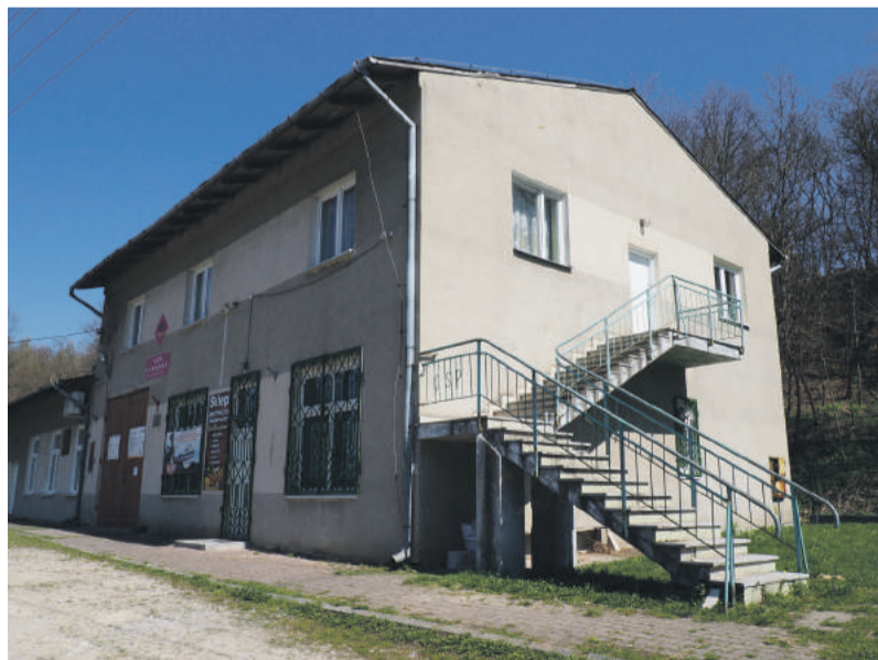
Strażnica w Leszczynie.