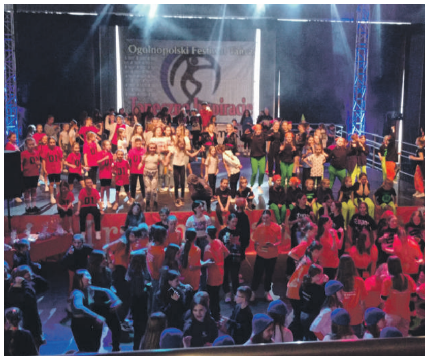
Scena w trakcie IX Ogólnopolskiego Festiwalu Tańca Taneczne Inspiracje w Biłgoraju.