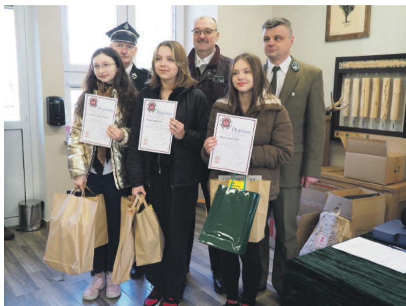
Zwycięzcy kat. wiekowej klasy V-VIII - eliminacje gminne.