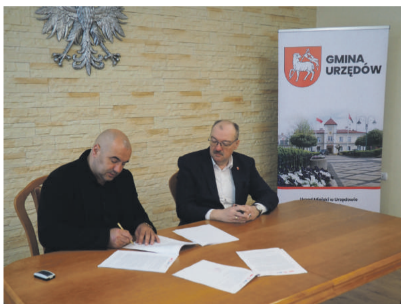
Umowa na remonty remiz podpisana, niebawem ruszą prace w terenie.