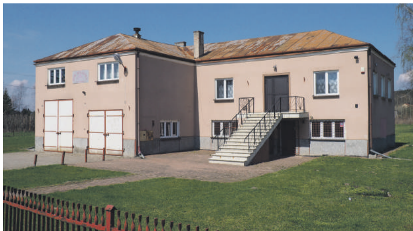
Budynek OSP w Wierzbicy.