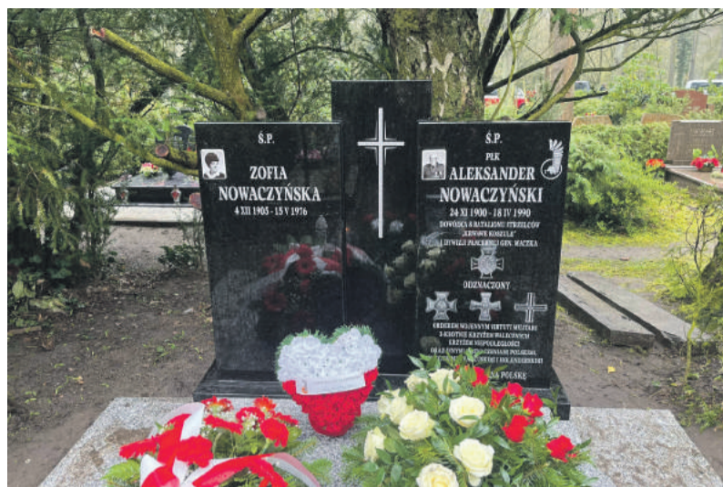
Uhonorowana odznaką rozpoznawczą 1. Dywizji Pancernej płyta nagrobna.