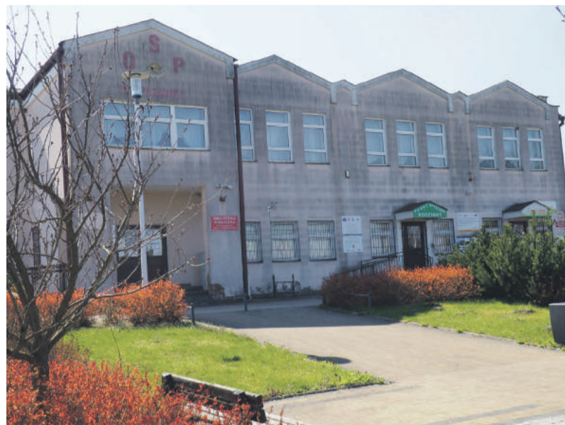
Wielofunkcyjny budynek w Popkowicach.

Nasze władze liczą na to, że odnowione obiekty będą cieszyły oko i staną się znów miejscem częstszych spotkań mieszkańców, stowarzyszeń, kół gospodyń, spotkań seniorów, organizowania tam imprez okolicznościowych, czyli centrum życia tychże miejscowości. JC