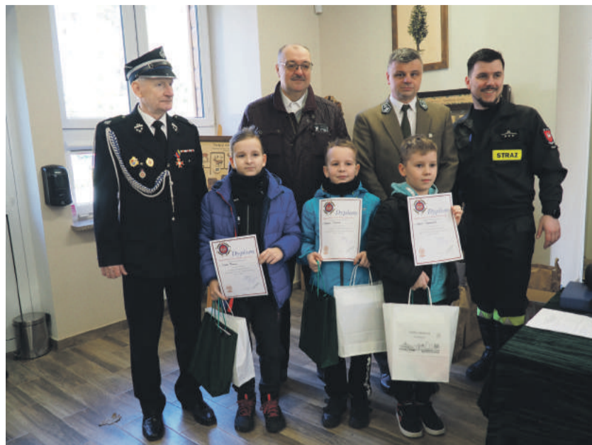
Zwycięzcy eliminacji gminnych w kat. wiekowej klas I-IV.

Zwycięzcy Turnieju otrzymali dyplomy oraz cenne nagrody rzeczowe ufundowane przez sponsorów: