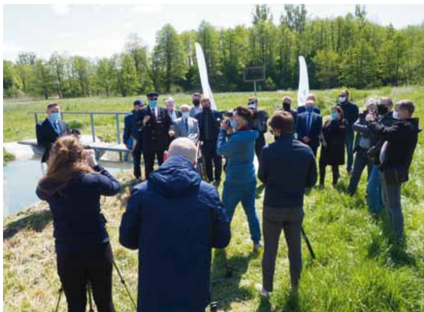
#Stopsuszy - to główne hasło programu Kształtowania Zasobów Wodnych.

cze w tym roku wydatkować 12 milionów zł na utrzymanie, odbudowę lub budowę nowych obiektów w ramach retencji korytovej. Inwestycje w tym zakresie nie ominą naszego terenu. W najbliższym czasie woda będzie retencjonowana od mostu Pomykalskiego w kierunku Rankowskiego, powstaną nowe stawidła. Odmulone zostanie także koryto rzeki, a jej brzegi będą wzmocnione. JC