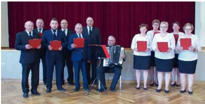
Śpiewając życzenia przekazał Vox Celestis.

26 maja – życzenia i dedykacja dla wszystkich Mam pięknej piosenki MATKO MOJA JA WIEM w wykonaniu zespołu Vox Celestis działającego przy OK pod kier. instr. Jana Kowala – spotkanie on-line