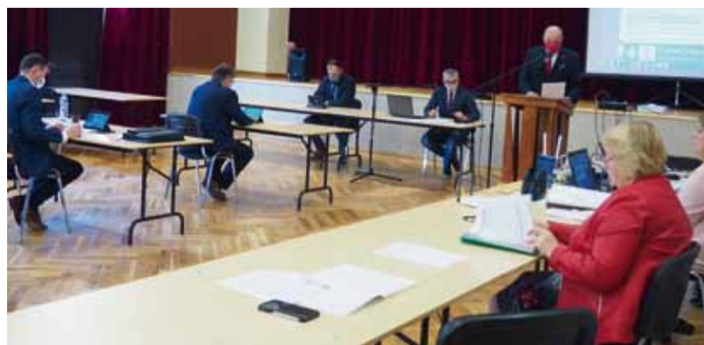
Majowa sesja Rady Miejskiej.

Przed głosowaniem nad absolutorium odbyła się dyskusja nad Raportem o stanie gminy za 2019 rok. Po niej miało miejsce głosowanie w sprawie udzielenia wotum zaufania burmistrzowi Urzędowa. Podobnie, jak przy absolutorium również podczas tego głosowania radni jednogłośnie opowiedzieli się za przyjęciem uchwały. JC