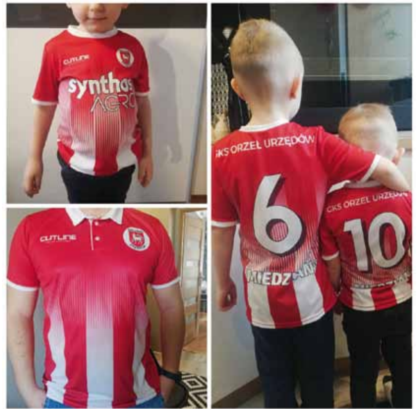
Nowe barwy strojów sportowców Orła.