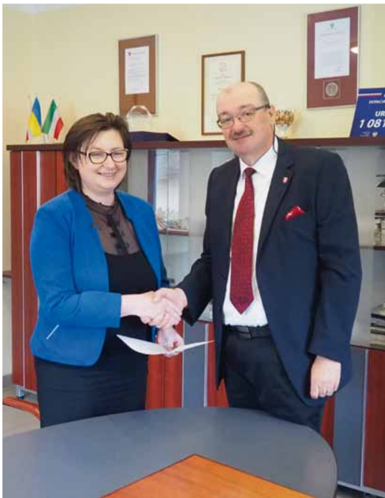
Oficjalne powierzenie obowiązków miało miejsce 10 czerwca.

Obowiązki dyrektora moniackiej szkoły będzie pełniła od 1 września 2020 roku do 31 sierpnia 2021 roku. JC