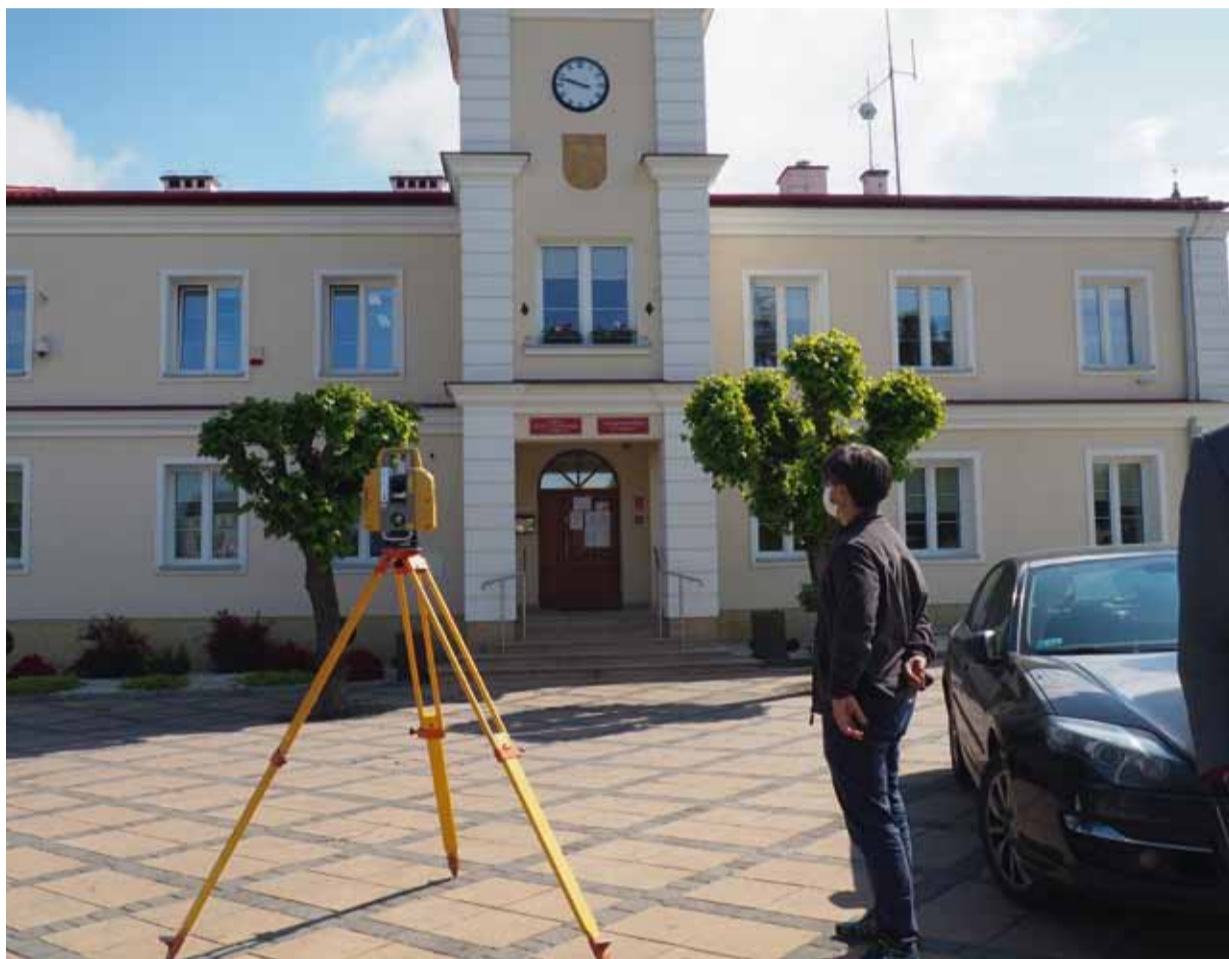
Niebawem będziemy mogli zobaczyć Ratusz w trójwymiarze.