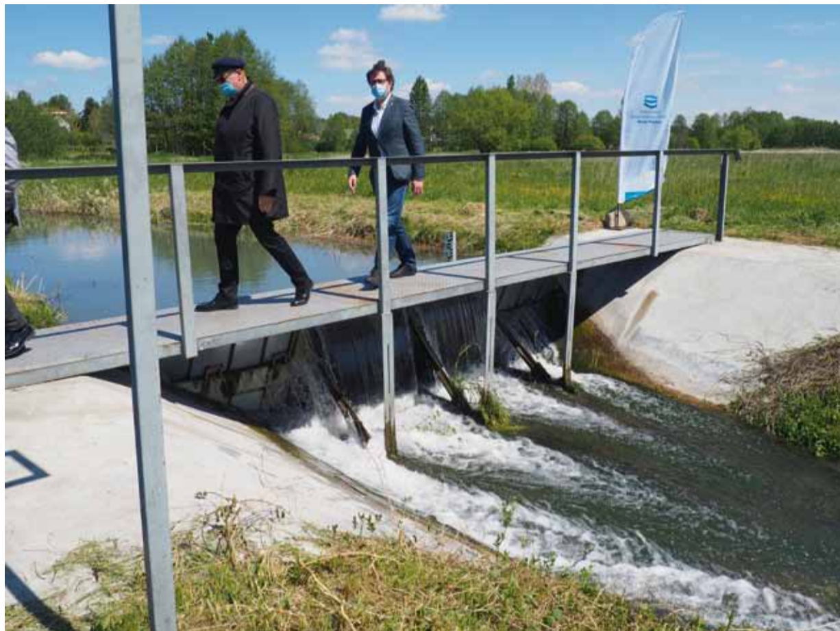
Jaz w Bęczynie może zmagazynować 16 tys. metrów sześciennych wody.