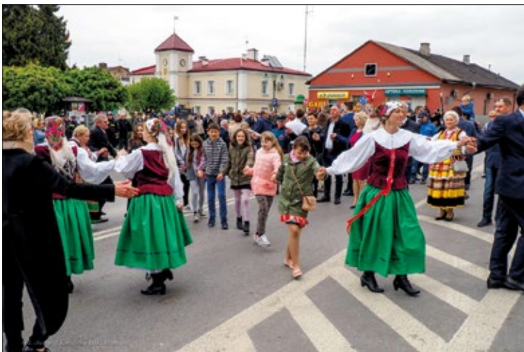
Polonez zakończył obchody 3 maja