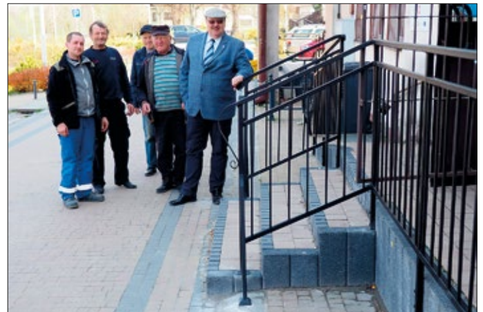
Balustrada przy budynku wielofunkcyjnym w Popkowicach już służy mieszkańcom

Balustradę wykonała kraśnicka firma zajmująca się kowalstwem artystycznym. Jej koszt to kwota nieco ponad 3 tys. zł. Od 12 kwietnia, bo tego dnia została zamontowana, służy już mieszkańcom Popkowic oraz wszystkim osobom korzystającym z usług oferowanych przez zlokalizowaną w tym budynku aptekę oraz sklep.