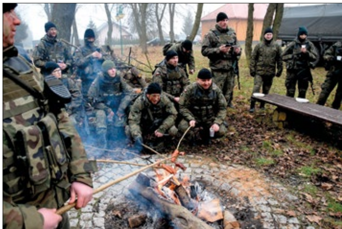
Po ćwiczeniach uczestnicy spotkali się przy ognisku

Żołnierze 2. Lubelskiej Brygady Wojsk Obrony Terytorialnej im. mjr. Hieronima Dekutowskiego ps. Zapora ćwiczyli w lutym tego roku na terenie gminy Urzędów.