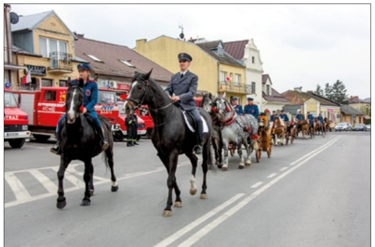
Uroczystości uświetniły parada konna oraz pokaz wozów strażackich

Wspaniałym zakończeniem świętowania 3 maja był wspomniany już na początku polonez odtąnczony