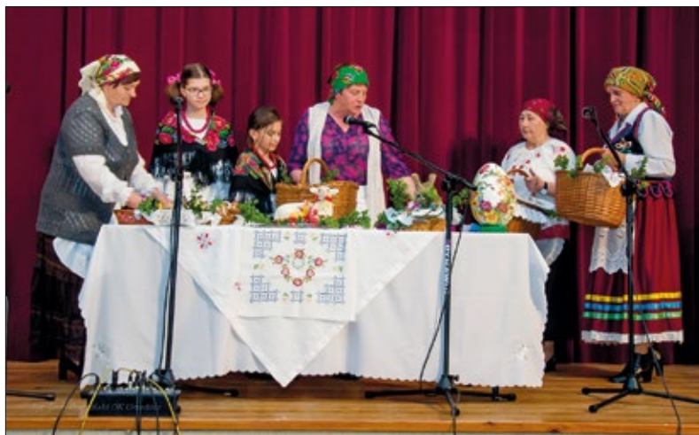
Klub Seniora z Urzędowa wystąpił z widowiskiem teatralnym

nie i podtrzymywanie tradycyjnego śpiewu i gwary, a także wspieranie rozwoju tradycji lokalnych. Dziękowali również za promowanie i przekazywanie kultury ludowej młodszym pokoleniom i środowiskom twórczym.