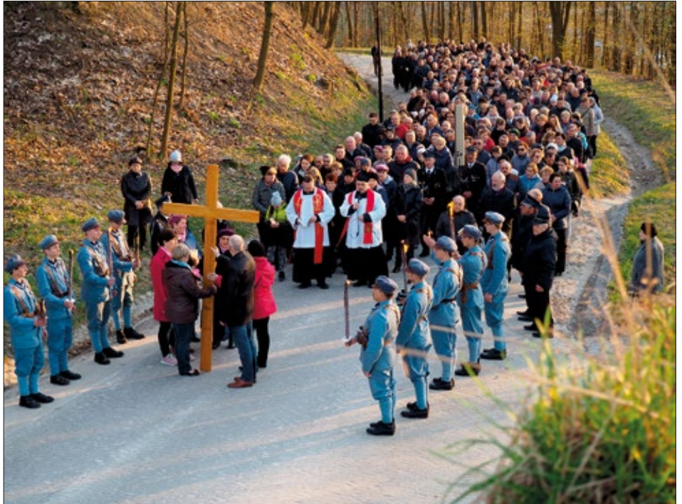
Krzyż pomiędzy stacjami Drogi Krzyżowej nieśli przedstawiciele poszczególnych miejscowości parafii w Popkowicach

Warto przypomnieć, że wczesnośredniowieczne Grodzisko w Leszczynie jest wpisane do rejestru zabytków województwa lubelskiego. W roku 2017 nasz samorząd