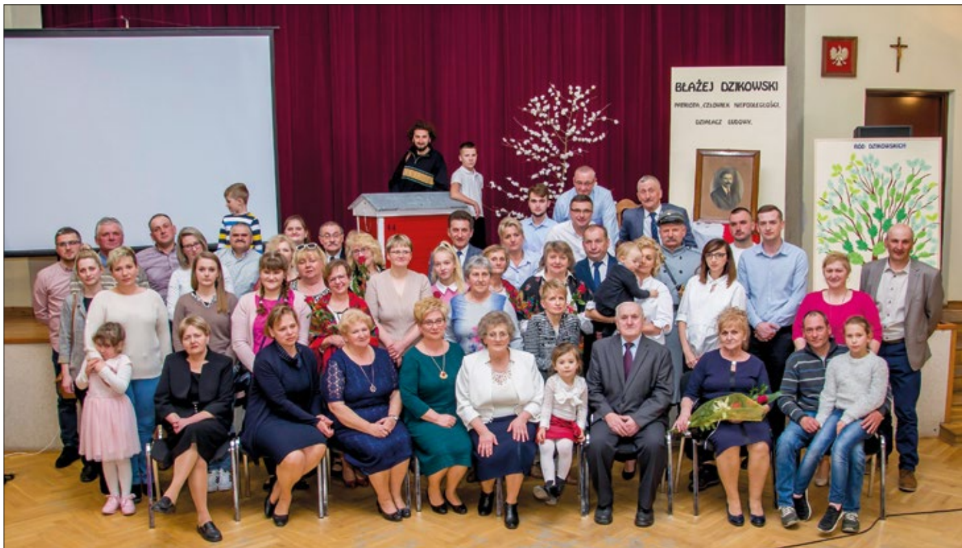
Obecni na spotkaniu członkowie rodu Dzikowskich

szego świata chciało się Państwu poświęcić swój czas na zorganizowanie i przygotowanie tej niezwykle uroczystości. W imieniu dumnych potomków Błażeja Dzikowskiego bardzo dziękuję za spotkanie”.