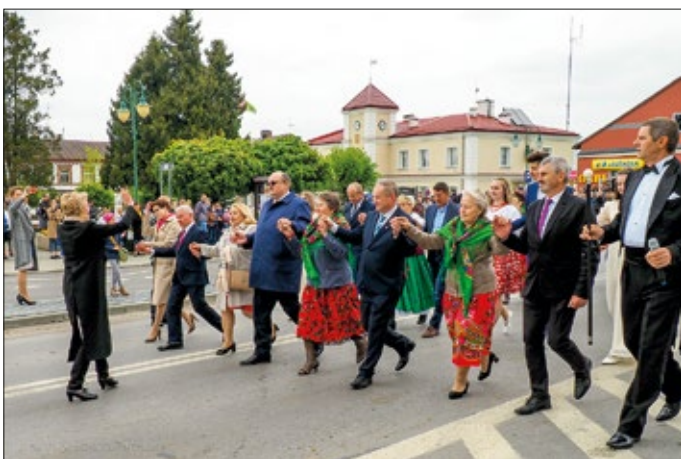
3 maja odtąńczono poloneza na urzędowskim Rynku