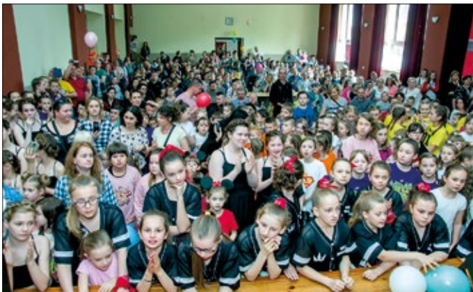
Turniej zgromadził liczną publiczność

Organizatorami turnieju byli: burmistrz Urzędowa i Ośrodek Kultury w Urzędowie. Serdeczne podziękowania za przeprowadzenie konkursu, jak również zaangażowa-