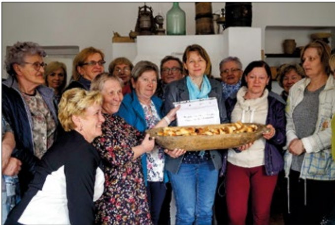
Podczas wyjazdu panie uczestniczyły w kilku rodzajach warsztatów

W tej małej wiosce na Lubelszczyźnie mieści się Ośrodek Edukacji Regionalnej. Znajdują się tu drewniane, małe domki, stodoła kryta prawdziwą strzechą, jest wiejskie SPA w starym spichrzu i gabinet masażu. Można też po prostu posiedzieć przed chatą i przenieść się myślami w dawne czasy. Te wiejskie, malownicze klimaty, ludowe rzeźby i serwety na drewnianych elewacjach tworzą wyjątkowy nastrój.