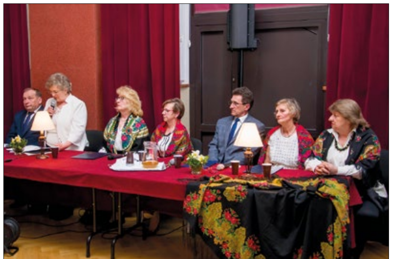
Grupa Literacka „Preludium”

Występy gromadziły w sali widowiskowej OK wielu uczestników. W dniu Święta Niepodległości w 2018 r. fre-