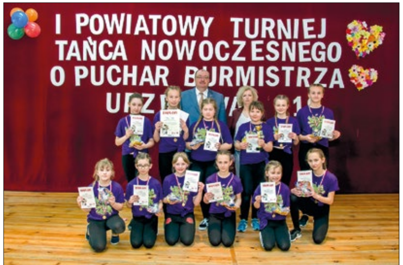
Urzędowski „Dance Trip” z pucharem za zajęte drugie miejsce