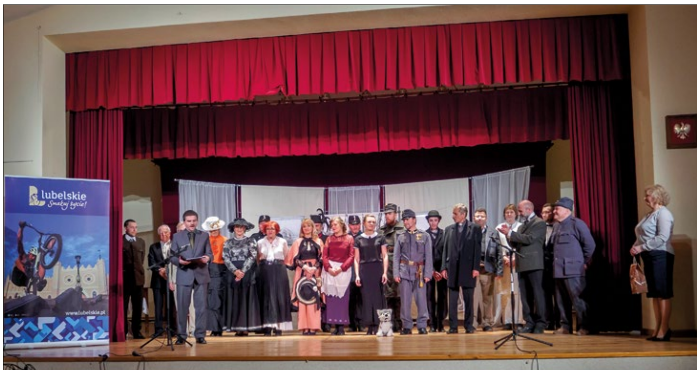
Amatorski Teatr Towarzyski wystąpił na scenie OK nie po raz pierwszy