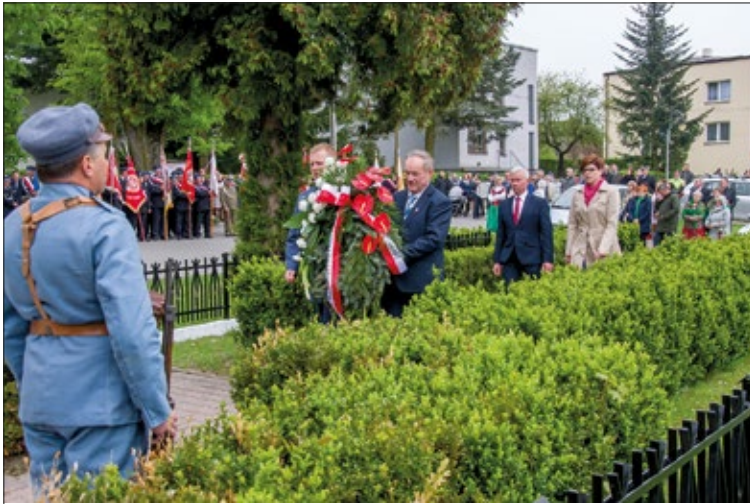
Miejsca pamięci uczczono złożeniem kwiatów

Po raz drugi na naszym Rynku mieszkańcy wraz z władzami samorządowymi gminy i powiatu zatańczyli poloneza, by uczcić święto uchwalenia Konstytucji 3 maja. Majowe uroczystości tradycyjnie miały u nas patriotyczno-religijny charakter.