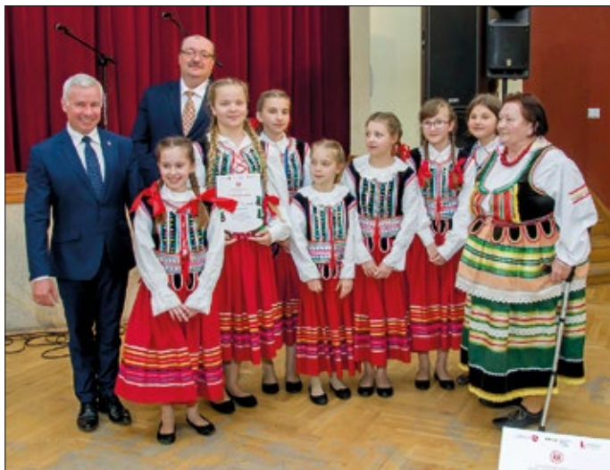
Zespół dziecięcy z Polichny „Blinowianeczki”