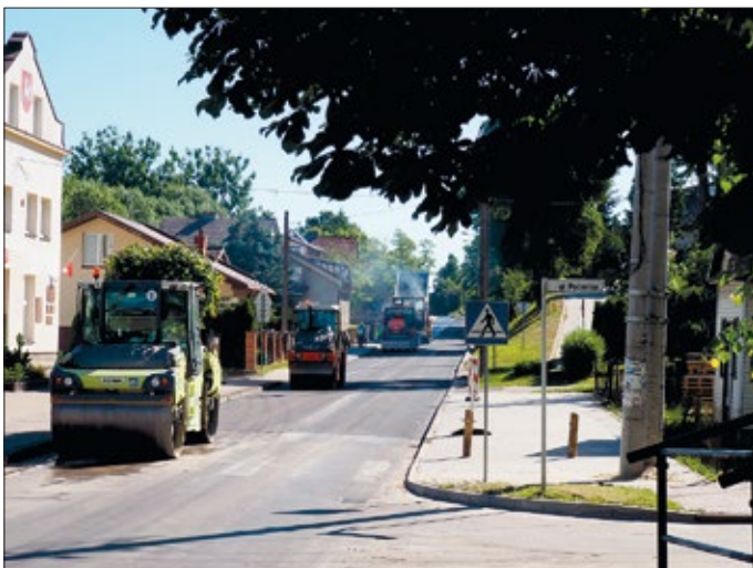
Prace remontowe na drodze powiatowej Urzędów–Popkowice–Dąbrowa Bór