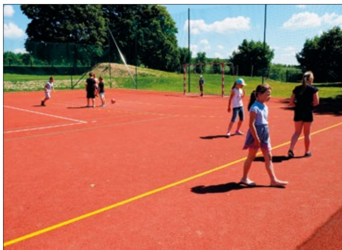
Nowe boisko wielofunkcyjne przy SP w Moniakach

W ramach funduszu sołeckiego, wyodrębnionego w gminie, zrealizowano wydatki na łączną kwotę 424 880,15 zł. Większość z tych zadań to zadania drogowe polegające na poprawie przejezdności dróg do pól uprawnych.