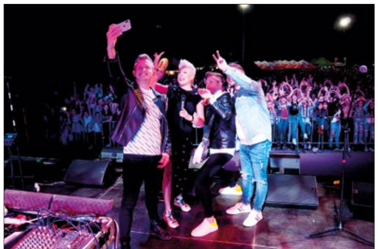
„Piękni i młodzi” przyciągnęli tłumy

Zakończeniem świętowania były koncerty gwiazd disco polo. Na scenie zaprezentowały się zespoły „Dejw”, „Piękni i Młodzi” oraz „TeX”. Na te występy przybyły tłumy mieszkańców naszej gminy, a także goście z okolicznych miejscowości.