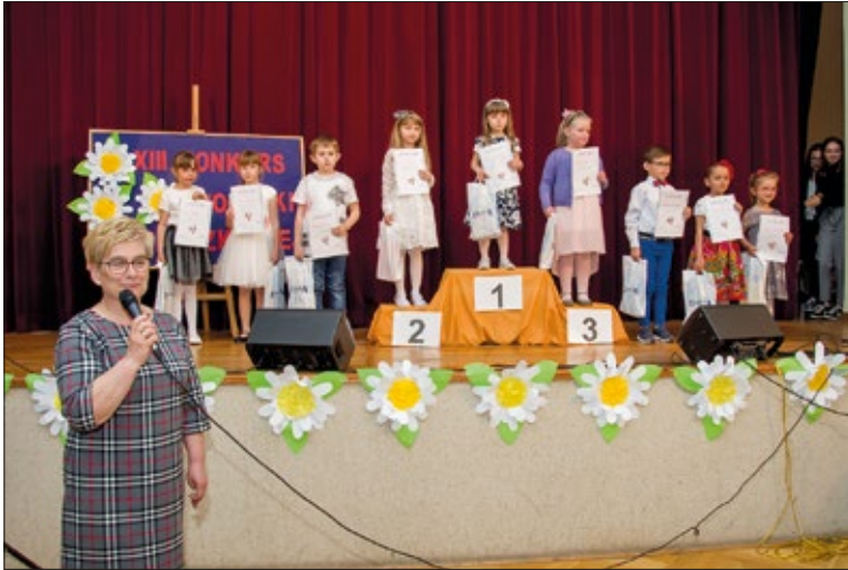
Przedszkolaki rozpoczęły świętowanie DU

W sobotę 25 maja na urzędowskim Rynku spotkali się rzemieślnicy. W tym roku bowiem w trakcie Dni Urzędowa równoległe odbywały się „Warsztaty aktywizujące – Rękodzieło w dzisiejszych czasach”. Wydarzenie to relacjonujemy w oddzielnym artykule. Pozwolimy sobie jedynie zaznaczyć, że impreza spotkała się z dużym zainteresowaniem. Były atrakcje dla najmłodszych, w tym m.in. dmuchańce czy żywe maskotki, ale i dla nieco starszych. Uwagę tych drugich przyciągała wystawa sportowych oraz zabytkowych aut wojskowych. Kolejka ustawiała się do symulatora dachowania z lubelskiego Wojewódzkiego Ośrodka Ruchu Drogowego. Podczas takiej