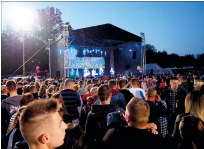
Niedzielnny koncert podczas Dni Urzędowa 2019