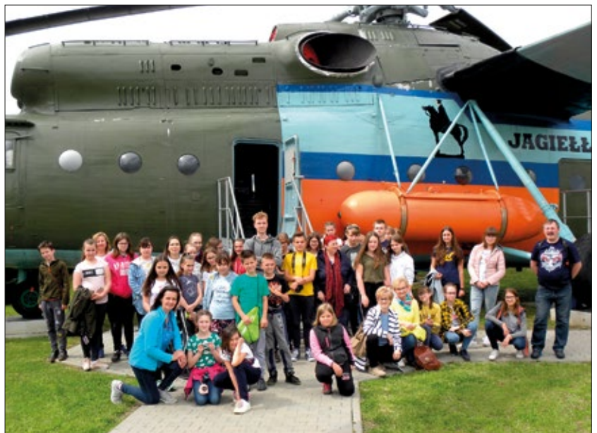
Na wycieczce w muzeum

Nasi uczniowie zdają sobie sprawę, że „Uncja środków zapobiegawczych jest lepsza od tony środków leczniczych” (A. J. Cronin). Z tego też powodu chętnie i aktywnie uczestniczyli w podejmowanych przez szkołę działaniach profilaktycznych. Z zaangażowaniem przygotowali i przeprowadzili mikołajkowy turniej ekologiczno-profilaktyczny, uczestniczyli w warsztatach psychologicznych poświęconych przemocy i agresji rówieśniczej, spektaklu teatralnym