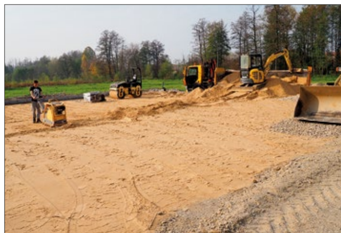
Roboty przy budowie boiska w Mikuszewskim

6. Wspomnieć należy również m.in. o środkach przekazanych na zakup karetki pogotowia dla SPZOZ w Kraśniku w kwocie 40 tys. zł oraz dotacji przekazanej Zakładowi Gospodarki Komunalnej na zadania inwestycyjne: budowa garażu oraz rozbudowa sieci wodociągowej przy ul. Słonecznej i zakup kosiarki ciągnikowej do koszenia przydrożnych poboczy i rowów. Kwota dotacji 77 667, 75 zł.