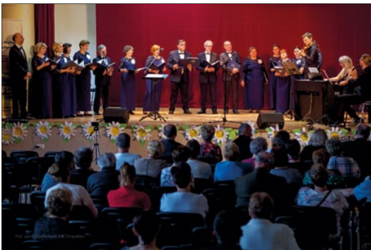
Na scenie OK wystąpił chór „Continuum”

Ostatni dzień świętowania, czyli niedziela 26 maja, przyciągnęła tłumy. Po uroczystej mszy św. w intencji mieszkańców gminy Urzędów odprawionej w urzędowskim kościele, władze samorządowe, zaproszeni goście, mieszkańcy i wszyscy chętni do uczestnictwa spotkali się na stadionie „Orla” Urzędów. Festynowa zabawa rozpoczęła się o 14.30.