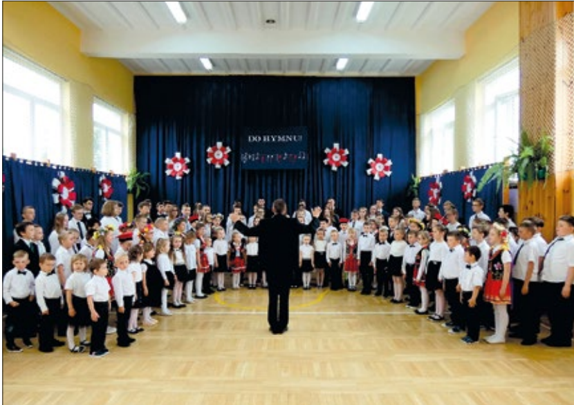
Uczniowie szkoły podczas realizacji projektu w ramach II edycji ogólnopolskiego konkursu „Do hymnu”

Aby osiągnąć sukces, niezbędna jest praca i współpraca. Wspólna praca nauczycieli, uczniów i rodziców podczas przygotowywania imprez i uroczystości szkolnych przyczyniła się do wzajemnego poznania i mobilizacji