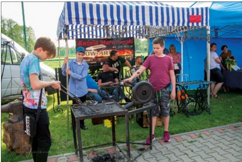
Każdy mógł spróbować swoich sił w wybranym rzemiośle