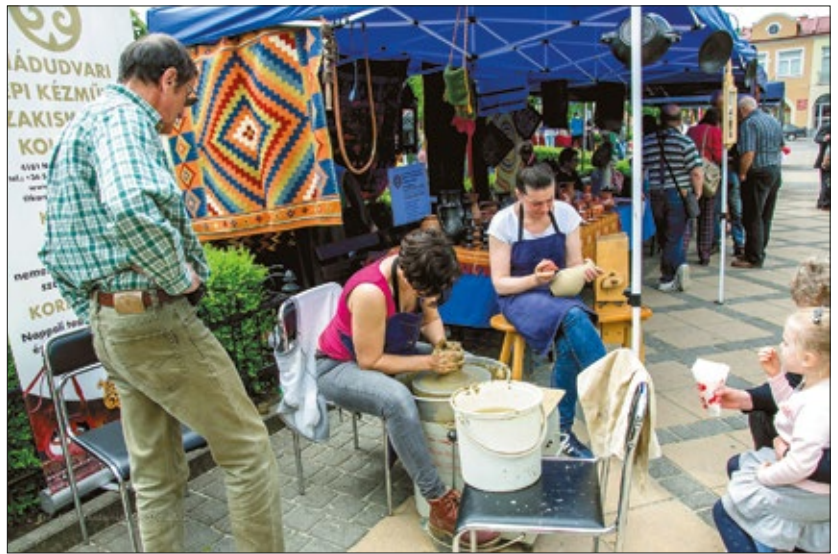
Najliczniejszą grupę na warsztatach stanowili garncarze

Już w piątek 24 maja przyjechali rękodzielnicy z różnych stron Polski i zza granicy. Najwięcej przybyło garncarzy: z Warszawy,