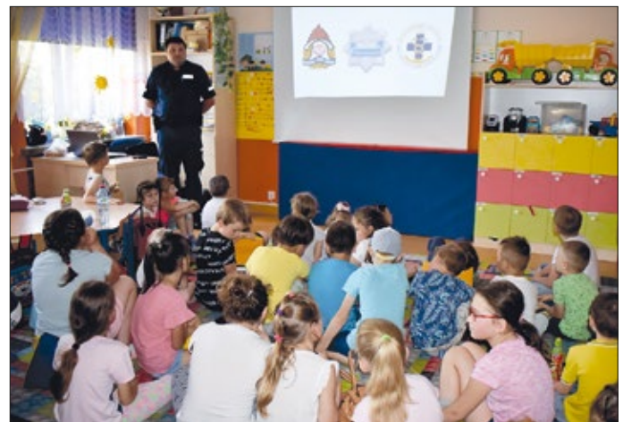
Uczniowie uczestniczyli w prelekcji na temat szkodliwości spożywania alkoholu i narkotyków

zabawy na dmuchanych zamkach i zjeżdżalniach, a wszyscy chętni mogli skorzystać z możliwości znakowania rowerów prowadzonych przez Policję. W krótkiej przerwie na odpo-