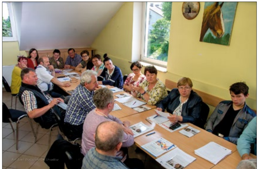
Uczestnicy warsztatów podczas szkolenia