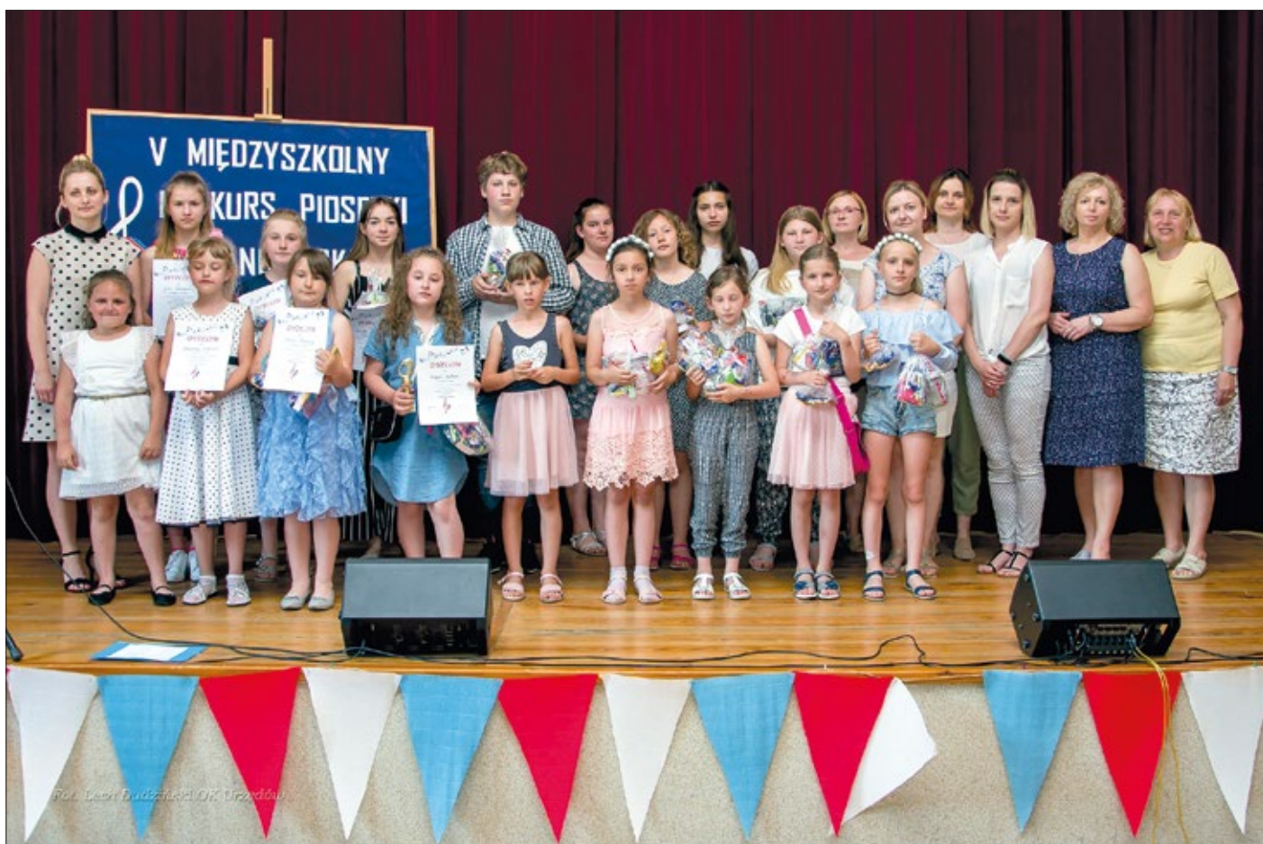
Uczestnicy konkursu piosenki angielskiej

11 czerwca 2019 r. w Ośrodku Kultury w Urzędowie odbył się V Międzszkolny Konkurs Piosenki Angielskiej 'You Can Sing', na który z niecierpliwością czekało wielu uczniów. Głównym celem konkursu jest rozwijanie umiejętności językowych, wokalnych oraz integracja środowisk szkolnych wśród uczniów i nauczycieli.