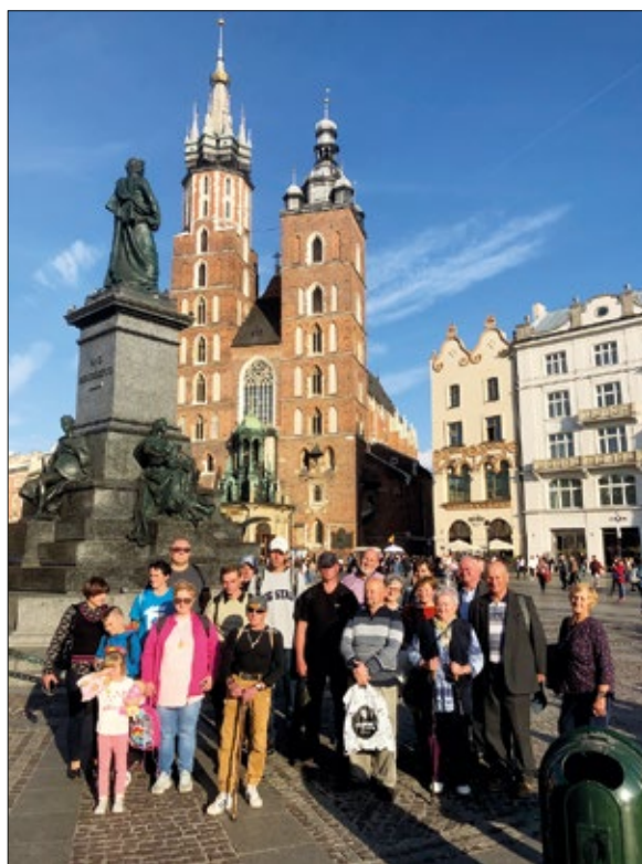
Uczestnicy wyjazdu na rynku w Krakowie