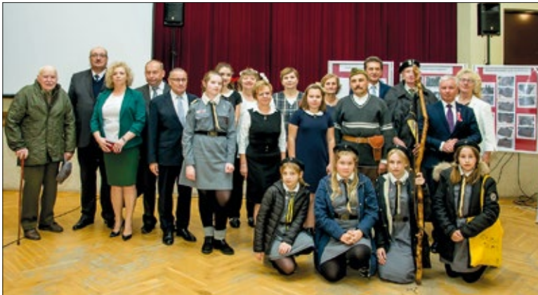
W wieczornicy 10 listopada uczestniczyli także urzędowscy harcerze

10 listopada w naszym OK odbyła się wieczornica poświęcona 80. rocznicy wybuchu II wojny światowej „Wojna i okupacja w Urzędowie”.