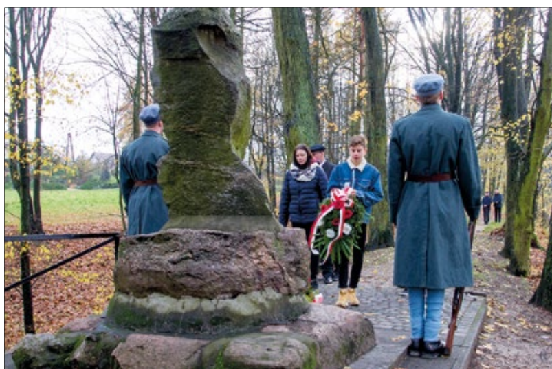
Pamięć bohaterów uczciła także młodzież szkolna

Dzień wcześniej, tj. 10 listopada, w Ośrodku Kultury odbyła się wieczornica poświęcona 80. rocznicy wybuchu II wojny światowej, która również wpisała się w niepodległościowe świętowanie.