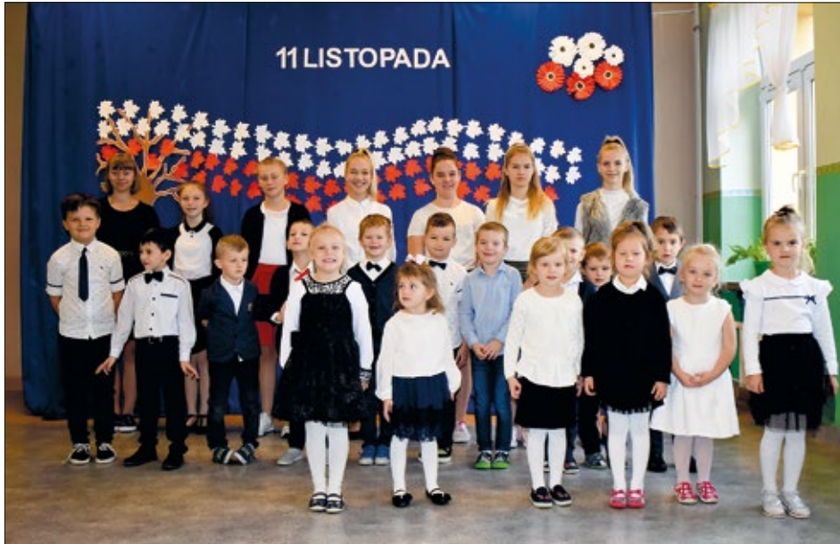
Uczniowie szkoły podczas patriotycznego występu

8 listopada z tej właśnie okazji odbyła się uroczysta akademicka przygotowana przez najmłodszych uczniów – dzieci z przedszkola i oddziału przedszkolnego. Tego dnia budynek naszej szkoły udekorowany został biało-czerwonymi flagami, a korytarz, na którym zgromadziła się cała społeczność szkolna, przybrał biało-czerwone barwy. Podczas występu przedszkolaki z dumą zaprezentowały inscenizację z okazji Święta Niepodległości. Pięknymi wierszami przypomniły burzliwą historię naszego kraju i oddały hołd tym wszystkim, którzy polegli za wolność naszej ojczyzny. Podczas uroczystości uczniowie, nauczyciele i rodzice wspólnie śpiewali pieśni patriotyczne, takie jak Legiony czy Rota . Jednak najważniejszym punktem było wspólne odśpiewanie hymnu państwowego.