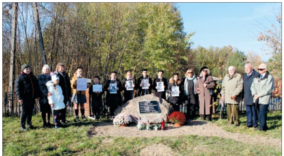
Kamień Katyński znalazł miejsce obok Dębów Pamięci