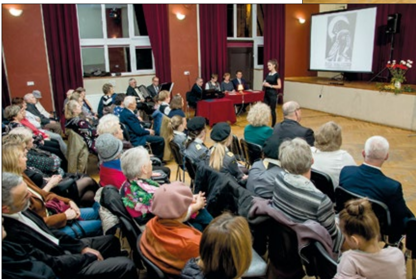
Wieczornica zgromadziła liczną publiczność