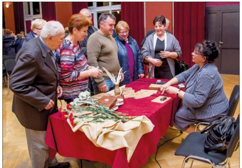
Publikacje cieszyły się dużym zainteresowaniem czytelników