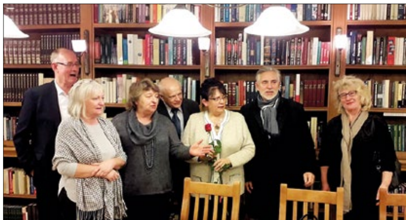
Współautorka publikacji z uczestnikami spotkania