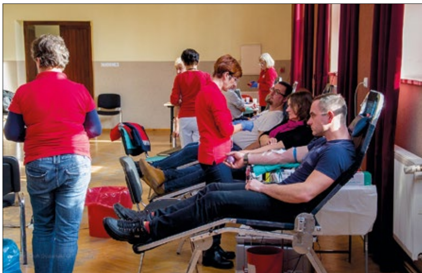
Tym razem udało się zebrać ponad 6 litrów krwi

w sali urzędowskiego Ośrodka Kultury zorganizowało tymczasowy punkt poboru krwi. Akcja spotkała się z zainteresowaniem wśród chętnych do podzielenia się tym bezcennym darem życia mieszkańców Urzędowa. W sumie zebrano ponad 6 litrów krwi.