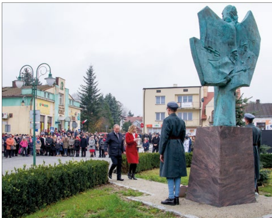
11 listopada delegacja samorządu powiatowego oddała hold walczącym o niepodległość