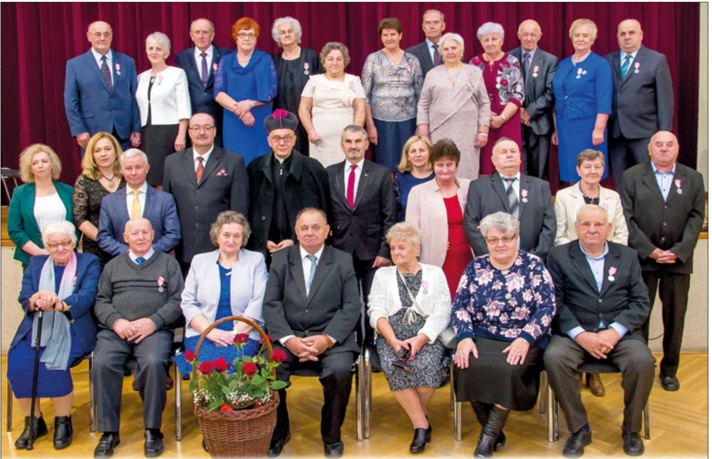
Wspólne zdjęcie dostojnych Jubilatów z przedstawicielami władz powiatowych i gminnych

Pięćdziesiąt lat temu przysięgali sobie miłość oraz dłożenie wszelkich starań, aby ich małżeństwo było zgodne, szczęśliwe i trwałe, a w czwartek 28 listopada uroczysto świętowali przeżyte wspólnie lata. Złote Gody to niezwykle jubileusz, tak samo jak niezwykli są ludzie, którzy przeżyli ze sobą pół wieku. Tegoroczna uroczystość uhonorowania 19 par małżeńskich miała miejsce w Ośrodku Kultury w Urzędowie. Były gratulacje i podziękowania oraz życzenia wszelakiego dobra na kolejne wspólne lata.