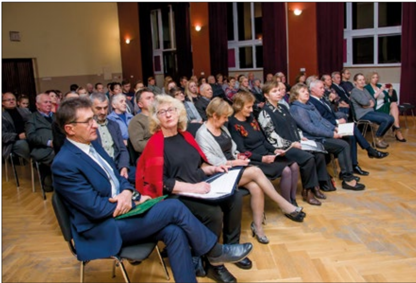
Promocja książki połączona była z wieczorem poezji szekspirowskiej