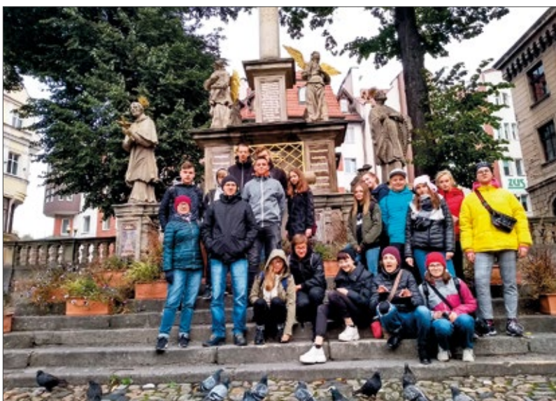
Edukacyjny EuroWeek w Międzygórze

Oprócz intensywnych warsztatów w języku angielskim uczniowie zwiedzili monumentalną Twierdzę Kłodzką oraz najbardziej kolorową sztolnię w Polsce, gdzie w podczas wędrowki podziemną trasą turystyczną poznali tajemniczą