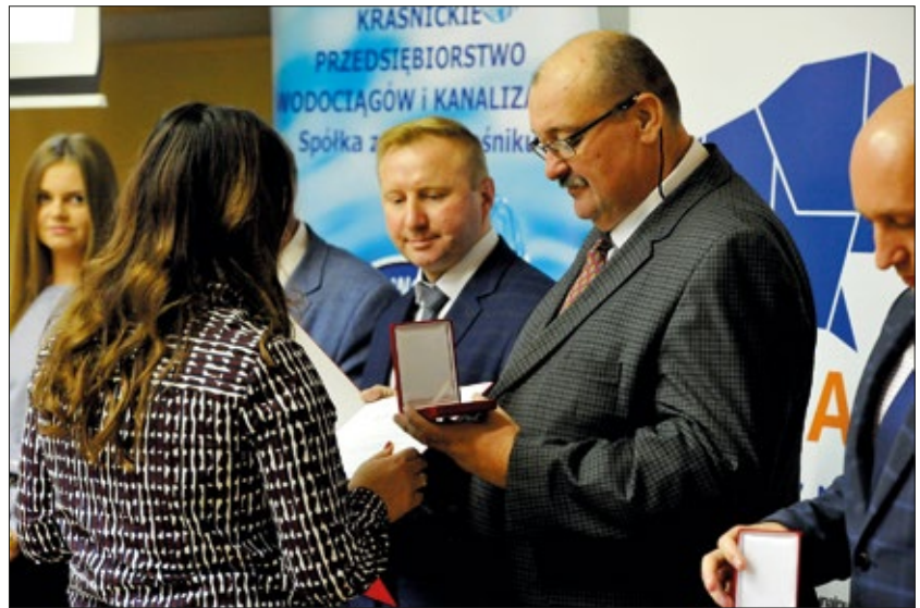
Burmistrz Urzędowa odebrał okolicznościowy medal PCK

Warto zaznaczyć, że Polski Czerwony Krzyż obchodzi w tym roku 100-lecie swojego istnienia. Jest on najstarszą