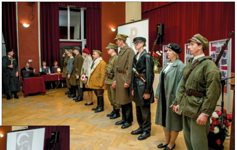
W występ zaangażowali się chętni mieszkańcy

w której zginęli urzędowscy patrioci. Przypomnieli urzędowiaków zabitych przez sowietów w Katyniu, Charkowie i Miednoje. Opowiadali też o werbunku mieszkańców gminy na przymusowe roboty i o przybyciu Pancernej Górskiej Kompanii, która zamieniła Dom Ludowy na warsztaty remontowe. Przekazali informacje o powstaniu placówki AK i składzie komendy. Przedstawili scenę przysięgi AK. Przywołali pamięć o losie urzędowskich Żydów, kryjących się po polach i lasach oraz wywiezionych do getta w Kraśniku. Pamiętali o egzekucjach w Skorzcycach i Zakrzówku. Odczytali listę nauczycieli prowadzących