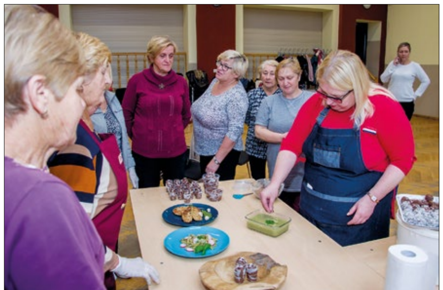
Panie przygotowywały potrawy zgodnie z zasadą „zero waste”