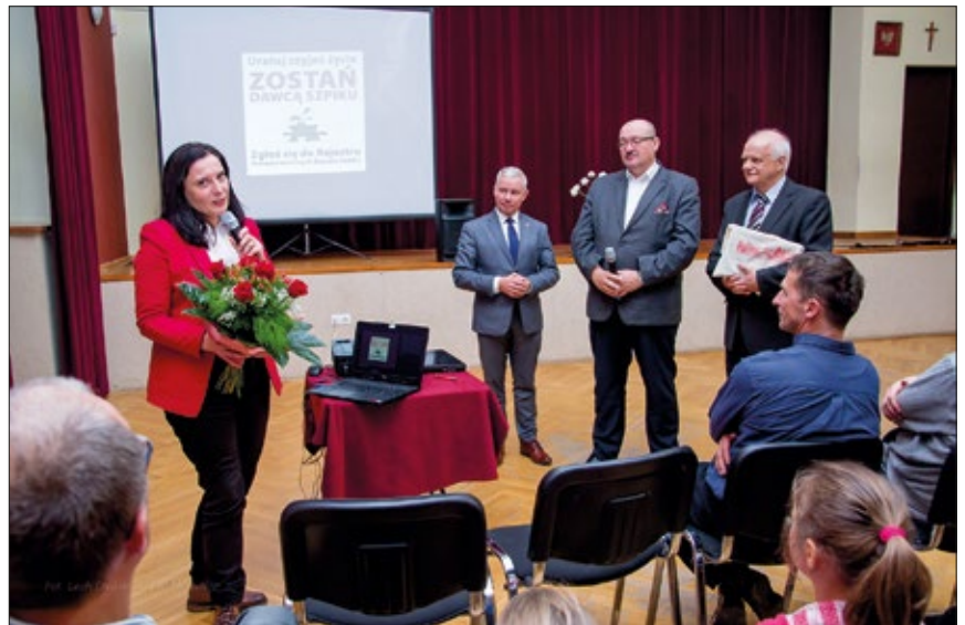
Znaczenie honorowego krwiodawstwa omówiła dyrektor RCKiK

Jednym z ważniejszych wydarzeń tegorocznych zdrowotnych dni była niewątpliwie kolejna akcja zbiórki krwi. Tradycyjnie już poprowadziło ją Regionalne Centrum Krwiodawstwa i Krwiolecznictwa w Lublinie, które