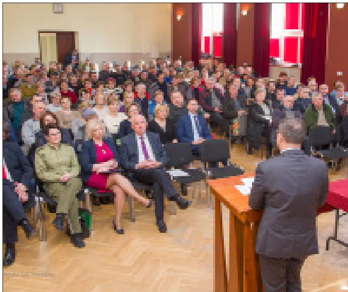
Podczas DKR omawiane były m. in. nowe zasady zatrudniania cudzoziemców w rolnictwie

Pierwszy dzień, dotyczył aktualnego i bardzo ważnego tematu w kwestii wprowadzonych w ostatnim czasie