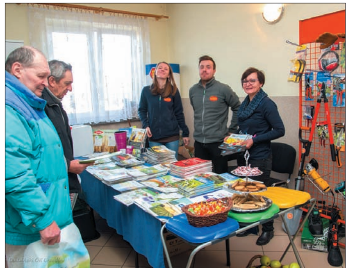
Podczas DKR oferty handlowe prezentowało kilka firm związanych z rolnictwem

Obowiązek składania „e-wniosku” o dopłaty bezpośrednio - był to główny temat trzeciego z rolniczych dni. Przedstawiciele Agencji Restrukturyzacji i Modernizacji