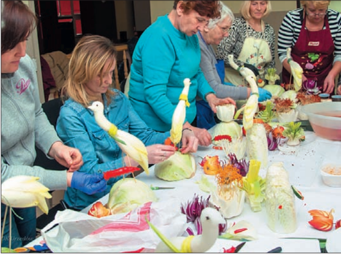
Grupa pań z KGW uczyła się sztuki carwingu