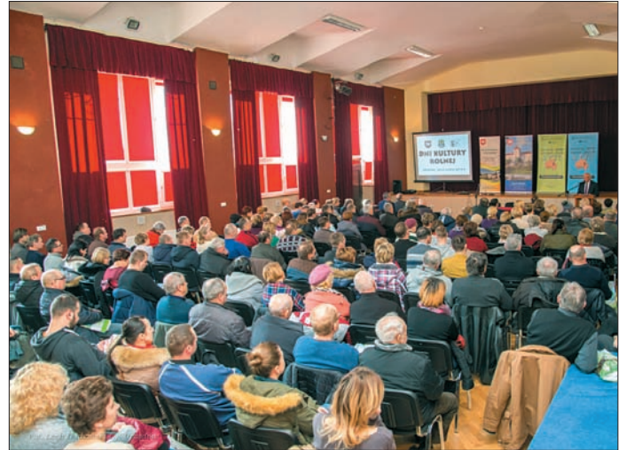
Tegoroczne DKR cieszyły się dużym zainteresowaniem wśród naszych mieszkańców

Kolejny rolniczy dzień tematycznie odnosił się do upraw owoców miękkich. Eksperti z Lubelskiego Ośrodka Doradztwa Rolniczego w Końskowoli omawiali zagadnienia dotyczące najnowszych trendów w produkcji owoców szczególnie jagodowych. Poruszony został również temat ochrony owadów zapylających, które wpływają na zwykłą