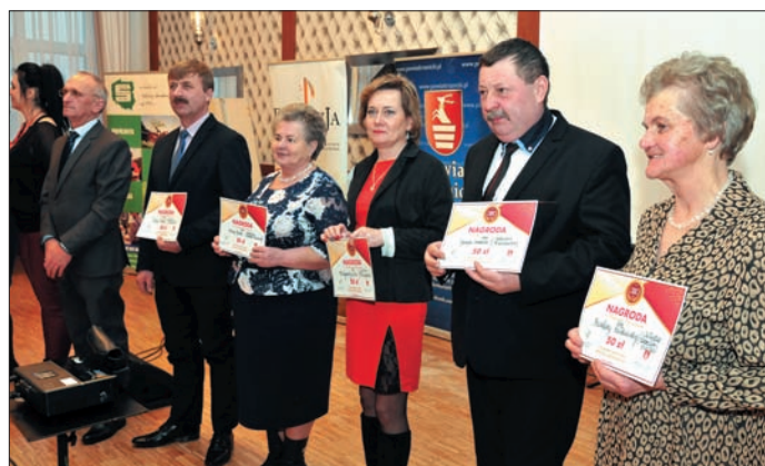
Nasze panie sołtyski zostały wyróżnione podczas konkursu kulinarnego

Wydarzenie było m.in. okazją do uhonorowania sołtysów, którzy najdłużej sprawują swoje funkcje. Kongres miał również część edukacyjną. W programie znalazły się prelekcje na temat roli kapitału społecznego we współczesnych środowiskach wiejskich oraz działalności Krajowego