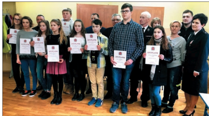
Zwycięzcy otrzymali nagrody i pamiątkowe dyplomy