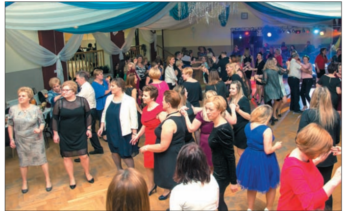
Panie bawiły się wyśmienicie do samego rana

Zabawa była udana pod każdym względem. Wszyscy bawili się świetnie jak to wypada bawić się w karnawale. Muzycznie uświetniał imprezę nasz lokalny zespół z Urzędowa Casperband. Tak jak obiecali, że dadzą z siebie