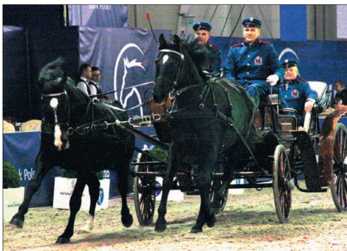
Stowarzyszenie Miłośników Koni „Podkowa” zaprezentowało się na Cavaliadzie

Na obiektach Targów Lublin w dniach 15-19 lutego 2018 roku odbyła się Cavaliada . Cavaliada to międzynarodowe zawody jeździeckie, na które składa się cykl halowych zmagani sportowych Cavaliada Tour. Celem Cavaliady jest popularyzacja jeździectwa jako dyscypliny sportowej i formy rekreacji oraz pobudzanie zainteresowania hodowlą koni.