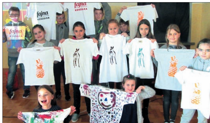
Uczniowie z Moniak uczestniczyli w warsztatach sitodruku

Kontakt: 721802389; izakoniarz@gmail.com