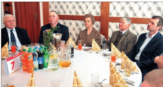
Podczas II Kongresu Sołtysów Powiatu Kraśnickiego nasz samorząd reprezentowała 13-osobowa grupa sołtysów

3 marca odbył się II Kongres Sołtysów Powiatu Kraśnickiego zorganizowany przez Starostwo Powiatowe w Kraśniku i Lokalną Grupę Działania Ziemi Kraśnickiej pod patronatem Krajowego Stowarzyszenia Sołtysów. Na spotkaniu tym oczywiście nie mogło zabraknąć naszych sołtysów. Gminę Urzędów reprezentowała grupa 13-stu sołtysów.