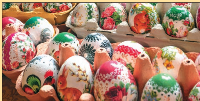
Na kiermaszu można było zakupić m. in. takie kolorowe pisanki