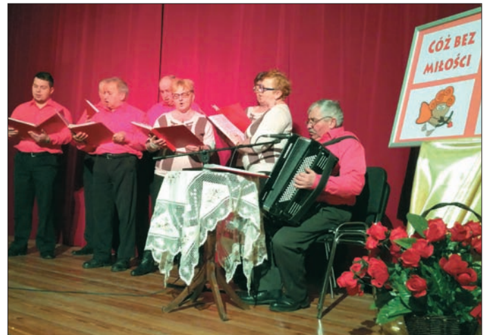
O miłości śpiewał m. in. Vox Celestis

Spotkanie zakończyło się występem Vox Celestis. JC