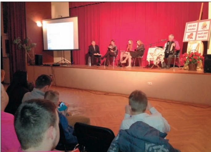
Wieczór walentynkowy wzbogaciły występy artystyczne

„Cóż bez miłości wart jest świat?” - pod takim hasłem 18 lutego na sali urzędowskiego Ośrodka Kultury odbył się Wieczór Walentynkowy. W spotkaniu udział wzięła spora grupa mieszkańców, przed którymi różne aspekty miłości zaprezentowali artyści, na co dzień związani z Ośrodkiem Kultury.