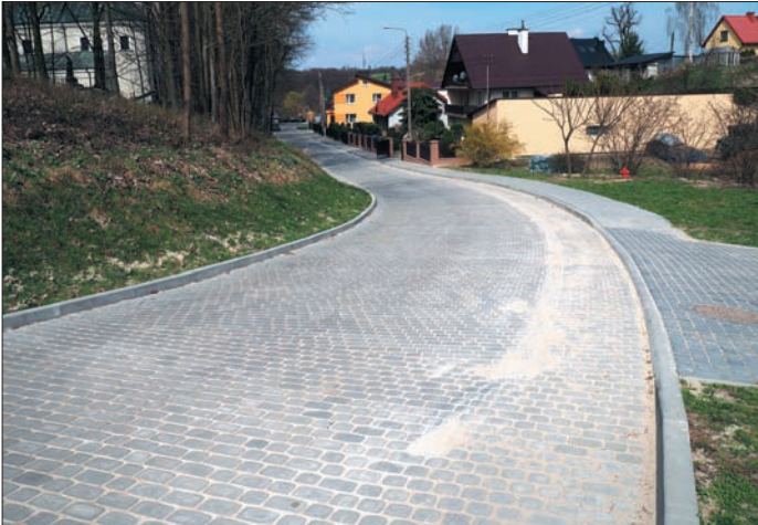
Z funduszu PROW- przebudowano ul. Podwalną

Najwięcej środków publicznych tak jak wcześniej zapowiadaliśmy wydatkowane było na drogi i jest to łączna kwota 3 mln 146 tys. zł.