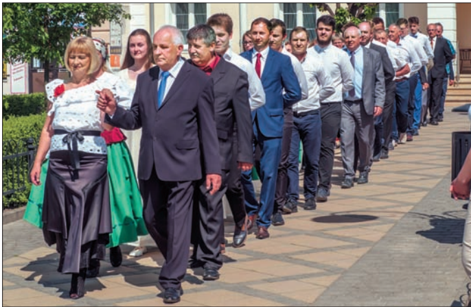
Podczas obchodów święta Konstytucji 3 Maja odtańczono poloneza na urzędowskim rynku