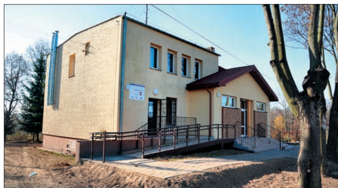
Budynek Ośrodka Zdrowia w Moniakach po rozbudowie