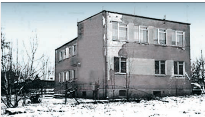
Budynek Ośrodka Zdrowia w Popkowicach w momencie przejęcia służby zdrowia przez samorząd

W okresie kilku miesięcy wszystko, co wydawało się początkowo trudne udało się pozytywnie załatwić. Wyjaśnione zostały sprawy finansowe i pracownicze, ustalono zasady i sposób udzielania pomocy medycznej po godzinach pracy urzędowskiego SPZOZ-u. Początkowy okres funkcjonowania służby zdrowia w gminie Urzędów to bagaż wielu prób i doświadczeń. Gminy w tym okresie przejmowały ośrodki zdrowia na rzecz prywatnej praktyki lekarskiej. Jednym z zadań dotyczących usług medycz-