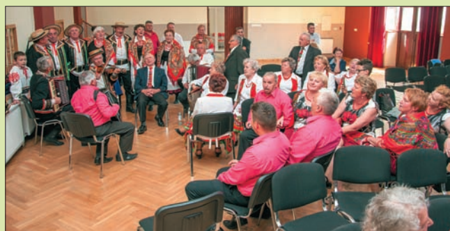
W tegorocznym przeglądzie udział wzięło 10 wykonawców