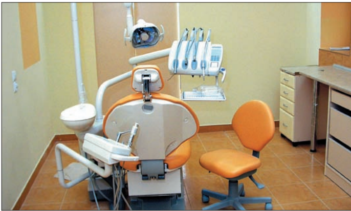
Unit stomatologiczny w Zespole Szkół Ogólnokształcących w Urzędowie

W celu poprawy sytuacji w tym zakresie, samorząd gminy Urzędów przeznacza kwotę 20 tysięcy zł. na wsparcie stomatologii, a konkretnie na program profilaktyczny zapobiegania próchnicy zębów w ramach, którego wykonano usługi dla 397 pacjentów. Pod koniec 2002 roku odbywa się pierwsze posiedzenie nowego składu Rady Społecznej SPZOZ Urzędów podczas, którego omówiono podział środków finansowych z kontraktu stomatologicznego.