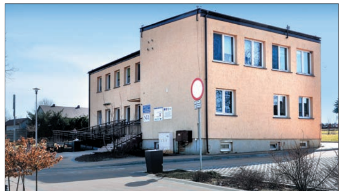
Wyremontowany budynek Ośrodka Zdrowia w Popkowicach