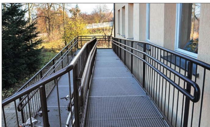
Podjazd dla osób niepełnosprawnych przy OZ w Popkowicach