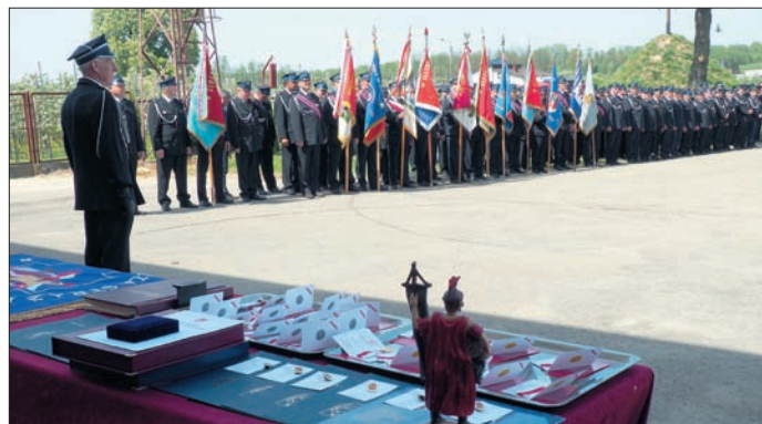
OSP Boby od ponad 20-stu lat należą do systemu KSRG

W tej chwili OSP Boby liczy 64 druhów, w tym 42 czynnych. W swoich szeregach skupia strażaków ratowników, ratowników drogowych oraz ratowników medycznych. Na wyposażeniu posiadają także sprzęt hydrauliczny do ratownictwa drogowego i zestaw do udzielania pierwszej