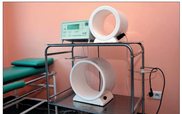
Magnetron w gabinecie rehabilitacji w OZ w Urzędowie