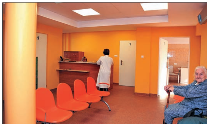
Odnowiona rejestracja dla chorych w OZ w Moniakach

wą SPZOZ Urzędów. Kierownictwo Zakładu podejmuje kolejną decyzję odnośnie prywatyzacji laboratorium analitycznego bez uchwały organu założycielskiego, jakim jest Rada Gminy. Nasze wystąpienie do Narodowego Funduszu Zdrowia w Lublinie o zbadanie tego problemu skwitowane zostaje, że przecież nic złego się nie dzieje, bo w ewidencji u Wojewody w strukturze SPZOZ Urzędów jest laboratorium analityczne. Odnosimy wrażenie, że jest akceptacja prywatyzacji i sposobu takiego działania, a Radzie Gminy pozostaje podjąć uchwałę w sprawie wydzielenia ze struktury SPZOZ Urzędów laboratorium i jego prywatyzację. Po uzyskaniu unijnego dofinansowania, co nie było sprawą łatwą, przystępujemy do modernizacji i dostosowania trzech Ośrodków Zdrowia do unijnych i polskich standardów. W Ośrodku Zdrowia w Urzędowie należy przebudować klatkę schodową i zainstalować windę, zmodernizować pomieszczenia zgodnie z opracowanym programem dostosowania. W Ośrodku Zdrowia w Popkowicach konieczna jest zmiana funkcji pomieszczeń na parterze z mieszkalnych na potrzeby służby zdrowia oraz wybudować trzeba podjazd dla osób niepełnosprawnych. Do istniejącego Ośrodka Zdrowia w Monikach należy dobudować pomieszczenia na