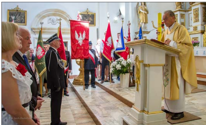
Uroczystości rozpoczęły się mszą świętą

Msza święta w urzędowskim kościele w intencji Ojczyzny, składanie kwiatów przy miejscach pamięci, okolicznościowe przemówienia oraz parada wozów strażackich i zaprzęgów konnych Stowarzyszenia Miłośników Koni