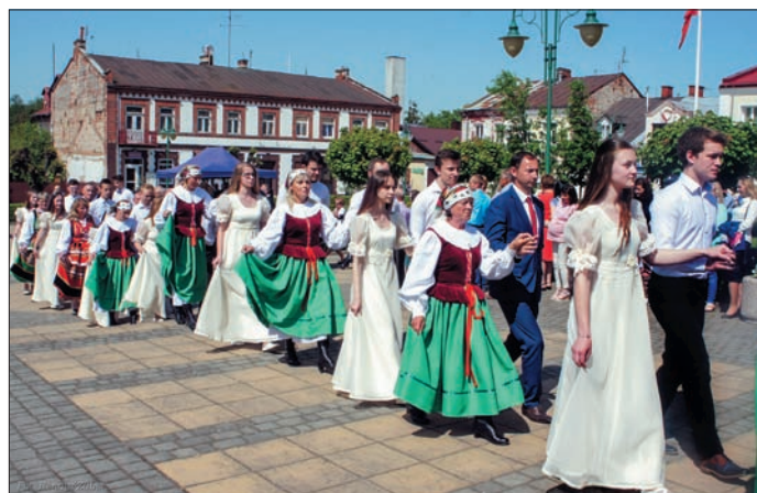
Podczas uroczystości poloneza tańczyli także uczniowie ZSO w Urzędowie

Wspaniałym zakończeniem tych uroczystości był polonez odtąńczony na urzędowskim rynku z udziałem władz samorządowych, pań z KGW Mikołajówka i Popkowiec Majdanek oraz ten w wykonaniu uczniów Zespołu Szkół Ogólnokształcących w Urzędowie. Reprezentacyjny taniec