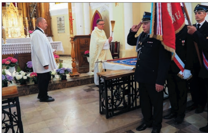
Podczas mszy św. miało miejsce poświęcenie nowego sztandaru