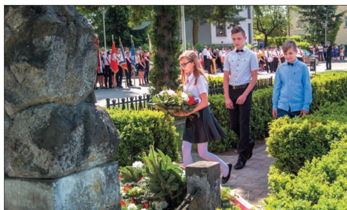
Kwiaty pod pomnikiem J. Piłsudskiego składali m. in. uczniowie gminnych szkół

Tegoroczne uroczystości uświetniły przejazdy zaprzęgów konnych Stowarzyszenia Miłośników Koni „Podkowa” oraz parada samochodów strażackich. Strażacy z wszystkich jednostek OSP z terenu gminy po prezentacji swojego