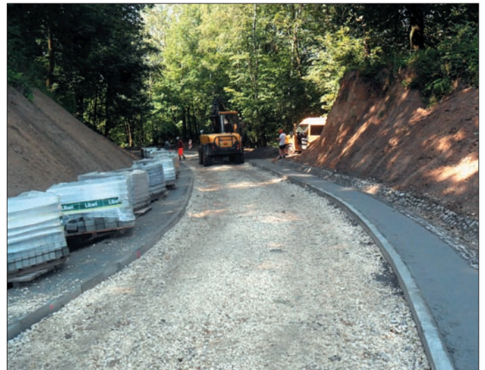
Z funduszy PROW-u wykonano dojazd do historycznego Grodziska w Leszczynie

Wyplaciliśmy rolnikom dopłatę do akcyzy paliwowej w kwocie 577 tys. zł. Powołana została do życia Spółdzielnia Socjalna „Urzędowianka”, w której udział założycielski ma również gmina Urzędów. Spółdzielnia Socjalna, jako podmiot „Ekonomii Społecznej” uzyskała dofinansowanie