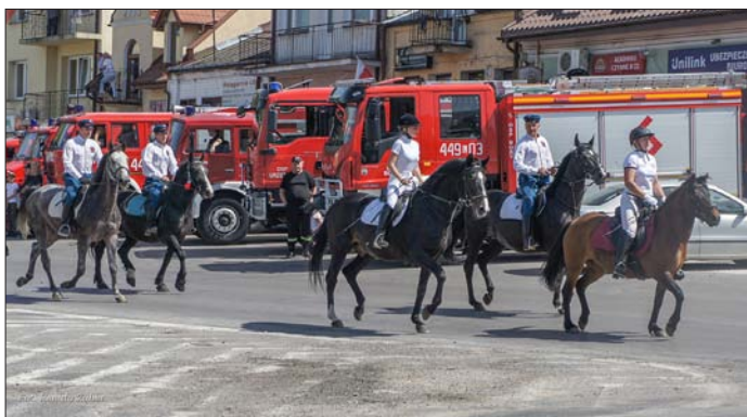
Przemarszowi towarzyszyła parada wozów strażackich i zaprzęgów konnych Stowarzyszenia Miłośników Koni „Podkowa”

Początek miejsko-gminnych obchodów święta Konstytucji 3 Maja to tradycyjnie przemarsz pocztów sztandarowych wraz z władzami samorządowymi, mieszkańcami i gośćmi spod budynku Ośrodka Kultury do naszego urzędowskiego kościoła. Tutaj odprawiona została msza święta za ojczyznę.