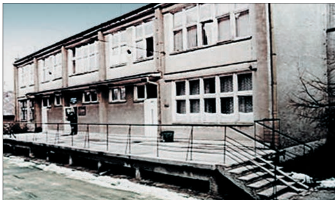
Budynek Ośrodka Zdrowia w Urzędowie przed remontem

nych SPZOZ-u było świadczenie usług transportowych na dializy nerek. Rachunek ekonomiczny sugeruje, że należy kupić własny środek transportu, przy czym nie wiadomo jak na taki wniosek zareaguje Rada Gminy. Pojawia się pomysł, aby w sprawie zakupu ambulansu wyjść do Rad Sołeckich, gdzie po wielu dyskusjach za i przeciw udaje się zgromadzić kwotę 20 tys. zł. W dniu 22 kwietnia 1999 roku dokonujemy zakupu samochodu za kwotę 33,500 zł. Klimat współpracy gminnej służby zdrowia, urzędowskiego samorządu z Kraśnicką służbą zdrowia jest nadal nienajlepszy. Dochodzi nawet do pobrania nienależnej opłaty w kwocie 19 zł od pacjentki z terenu Urzędowa, ale po naszej interwencji opłata zwrócona zostaje z dostarczeniem