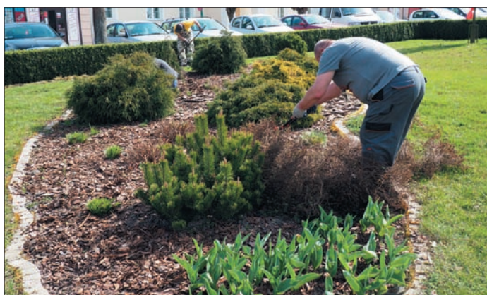
Prace przy zieleni na terenie naszego samorządu wykonują teraz pracownicy Spółdzielni Socjalnej

• 1 mln 938 tys. zł - na dwa projekty oświatowe w tym 730 tys. zł na doposażenie pracowni przedmiotowych. Pro-