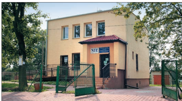
Budynek Ośrodka Zdrowia w Moniakach przed remontem