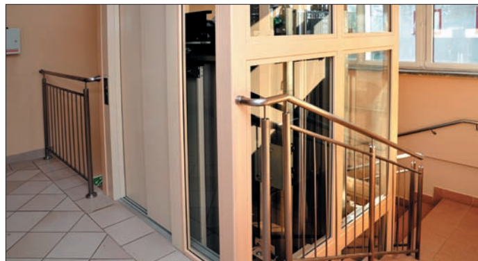
Winda w Ośrodku Zdrowia w Urzędowie

usługi medyczne tak, aby nie instalować kosztownej windy. W ramach dostosowania służby zdrowia należy dokonać zakupu USG, cztery defibrylatory podtrzymujące funkcje życiowe w zagrożeniu życia pacjentów.