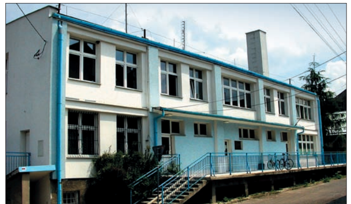
Budynek Ośrodka Zdrowia w Urzędowie po remoncie

Postępowanie wyjaśniające w tej sprawie wykazuje, że wynagrodzenie kierownika zakładu nie może być utajnione przed Radą Gminy. Jawność wynagrodzenia kierowni-