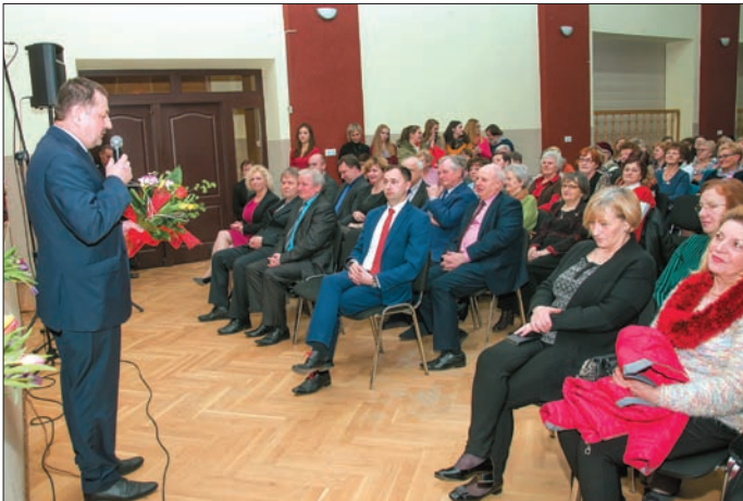
Uroczyste spotkanie z okazji Dnia Kobiet odbyło się 9 marca 2017 r. w sali widowiskowej OK