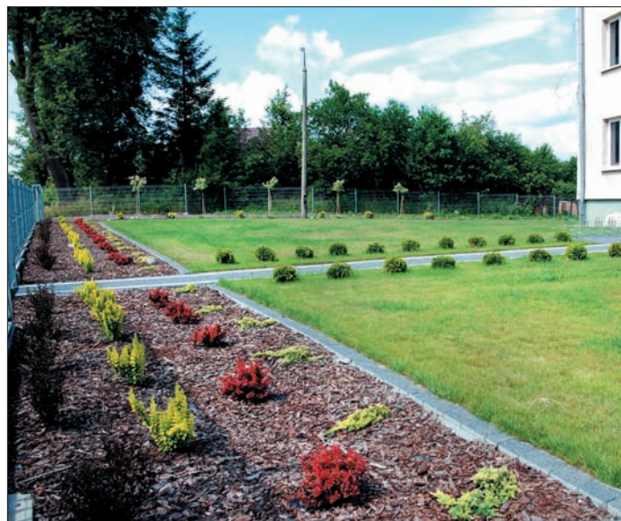
Zakład Gospodarki Komunalnej w Urzędowie