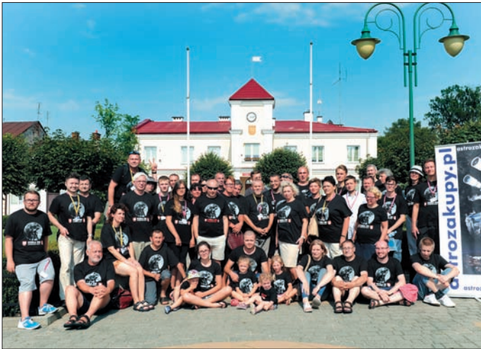
Uczestnicy XXI Ogólnopolskiego Zlotu Miłośników Astronomii OZMA 2017 w Urzędowie