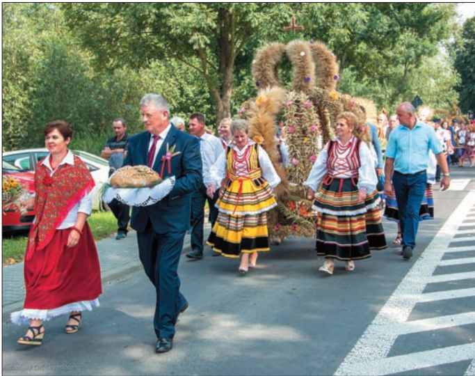
Dożynki Gminno-Parafialne odbyły się w Popkowicach