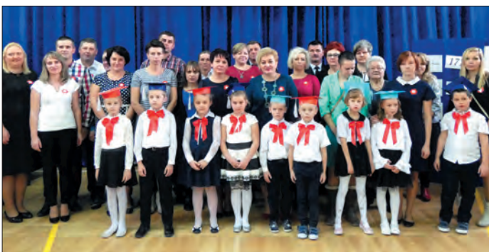
Pierwszaki w towarzystwie zaproszonych gości i rodziców

Uczniowie klas I – III wysłuchali uroczystego koncertu pieśni patriotycznych „A to Polska właśnie”, który odbył się w Filharmonii Lubelskiej; starsi uczniowie obejrzeli