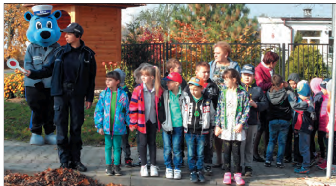
Bezpieczeństwo na drodze to podstawa - poznajemy zasady ruchu drogowego

Wiele wysiłku uczniowie wkładają również w zdobywanie nowej wiedzy i umiejętności. Poszerzenie oferty edukacyjnej naszej szkoły było możliwe dzięki przystąpieniu do projektu „Dobra jakość edukacji w Urzędowie” współfinansowanego z Funduszu Europejskiego w ramach Regio-