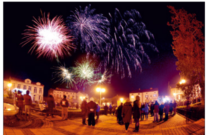
Urzędów znów jest miastem – 1 stycznia 2016 r.