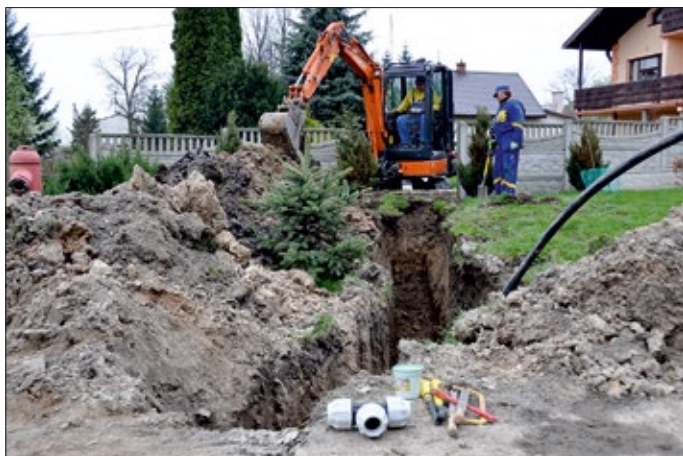
Budowa kanalizacji ciśnieniowej

W późniejszym okresie zdobywaliśmy doświadczenie w bardzo trudnym, krajowym projekcie finansowym w ramach funduszy „Norweski Mechanizm Finansowy – Europejski Obszar Gospodarczy”, gdzie uzyskaliśmy dofinansowanie w wysokości 2 mln 500 tys. zł na wybudowanie ponad 200 przyłączy kanalizacji ciśnieniowej.