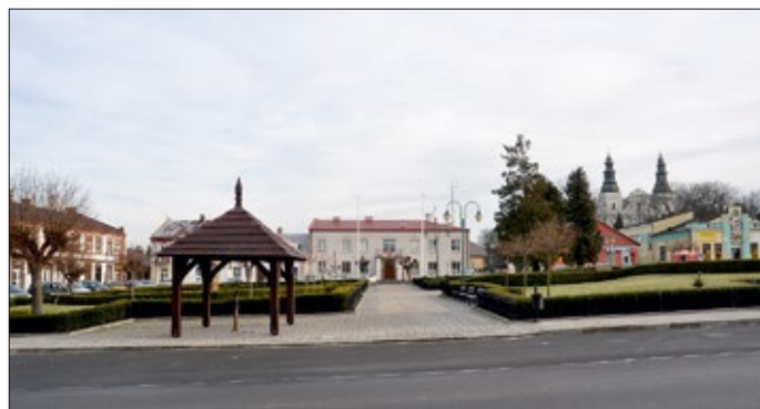
Odnowa urzędowskiego Rynku

W celu efektywnego wykorzystania funduszy unijnych w ramach tego programu powołaliśmy stowarzyszenie Gminna Rada Kobiet, do którego mogą należeć inne organizacje desygnujące swoich przedstawicieli. Rozwiązanie takie ma szczególne znaczenie dla organizacji takich, jak Koła Gospodyń Wiejskich czy innych organizacji, które nie są stowarzyszeniami, a mogą przekazywać swoje pomysły do realizacji projektów unijnych w programie „Leader +”. Bardzo często organizacje takie zainteresowane były projektami o wartości finansowej poniżej wymaganego progu, a więc nie mogłyby samodzielnie ubiegać się o unijne dofinansowanie.