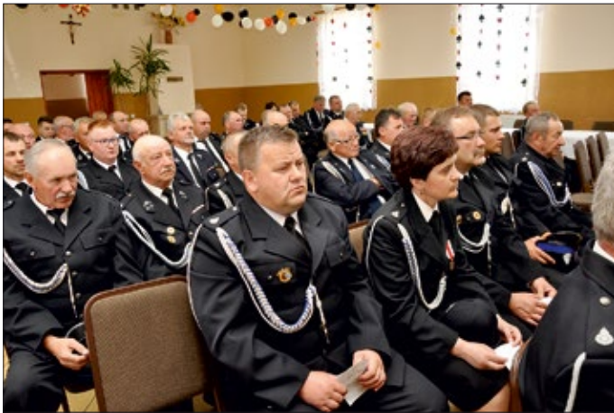
W Świątlicy Wiejskiej w Moniakach odbył się XI Zjazd Miejsko-Gminny Związku Ochotniczych Straży Pożarnych RP w Urzędowie