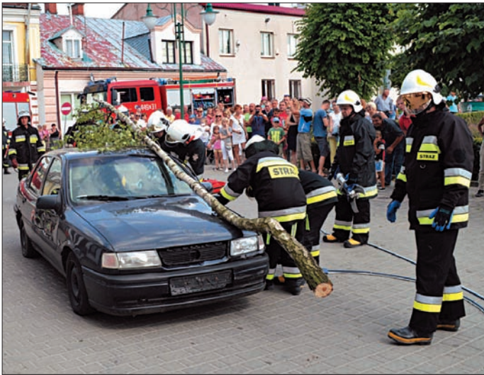
Impreza rodzinna na rynku w Urzędowie pod hasłem „Bezpieczne wakacje”