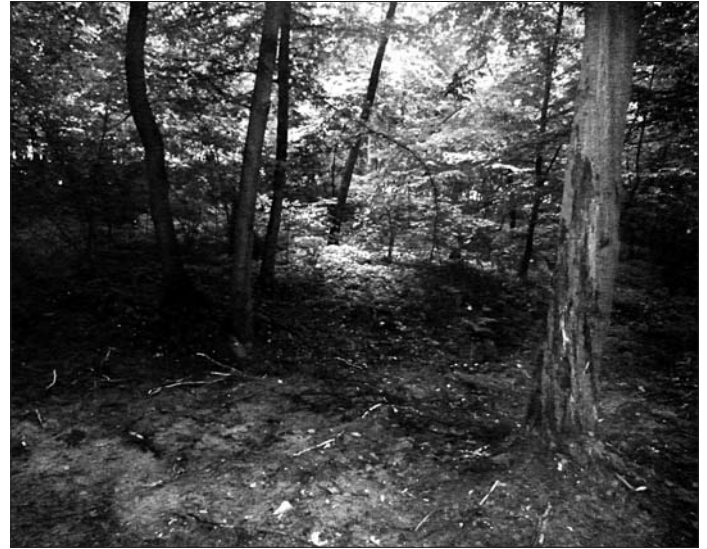
Nielegalne składowisko odpadów w miejscowości Popkowice – efekt po podjętych działaniach przez Związek Międzygminny „Strefa Usług Komunalnych” w Kraśniku

Za nami kolejny rok funkcjonowania wdrożonej w 2013 roku Ustawy o utrzymaniu czystości i porządku w gminach. Pod koniec roku 2014 został rozstrzygnięty przetarg na odbiór i zagospodarowanie odpadów komunalnych z terenu Gminy Urzędów. Przez okres 2 lat tj. od 1 stycznia 2015 do 31 grudnia 2016 roku, odpady z terenu gminy odbierane będą przez firmę EKOLAND Sp. z o.o. z Kraśnika. Stała odpłatność za wywóz 1 tony odpadów wynosić będzie dla gminy urzędów 540 zł. Jest to kwota wyższa o około 41% w porównaniu do poprzednio obowiązującej umowy.