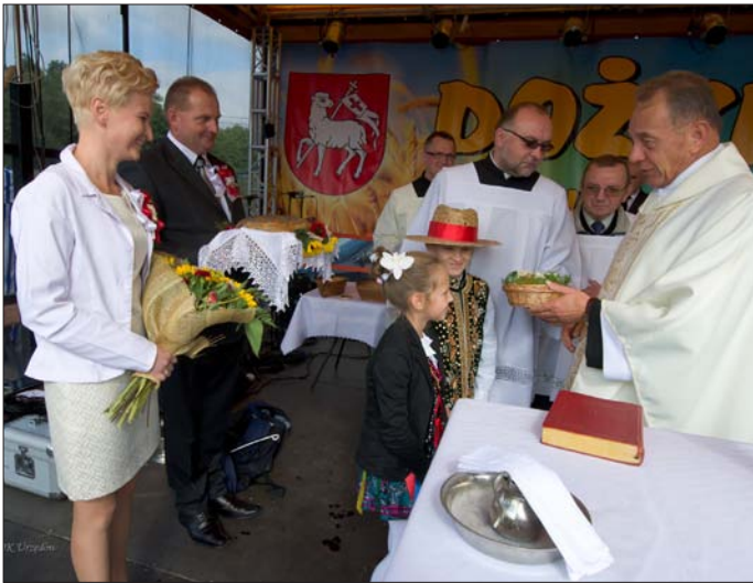
Uroczystości dożynkowe w gminie Urzędów