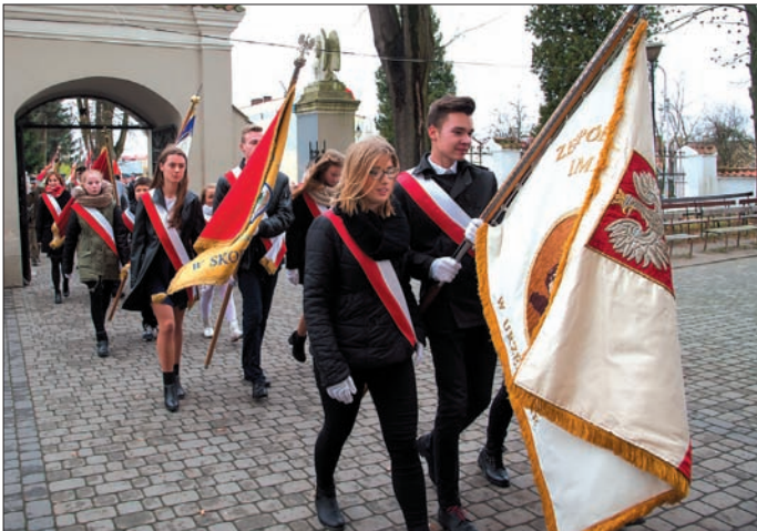
Obchody 97 Rocznicy Odzyskania Niepodległości, relacja z uroczystości na str. 6-7