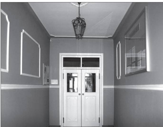
Nowo wyremontowany przedsionek Szkoły w Moniakach

Tak po remoncie wygląda przedsionek szkoły w Moniakach. Inspiracją dla takiej koncepcji wystroju, jest chęć nawiązania do tradycji dworu Zembruskich (ostatnich właścicieli dóbr Moniaki).