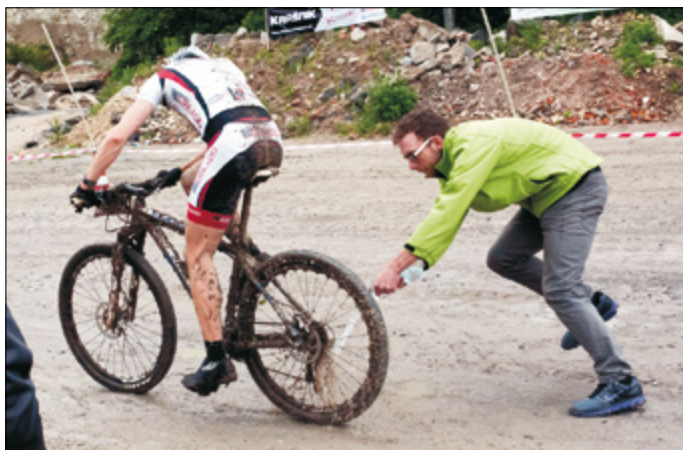
Czyszczenie przerzutek z błotnej mazi