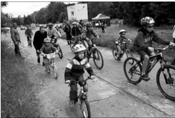
Wyścig Familijny dla najmłodszych

zawodnicy Erkado Racing Team Kraśnik, BSK Miód Kozacki Biłgoraj, Mayday Team Lublin, Baran Cycling Team, Uniqua LKKG BGŻ Lublin. Organizatorzy rozważali odwołanie wyścigu, ale determinacja zawodników i chęć walki bez względu na pogodę przewyciężyła. I tak, jako pierwsi wystartowali młodzicy, juniorzy młodsi, juniorzy i mastersi. Razem z nimi ścigała się jedyna odważna tego dnia kobieta. Drugi wyścig zgromadził na starcie zawodników orlika i elity. Ostatnim wyścigiem był Wyścig Familijny, w którym wystartowali najmłodsi pasjonaci kolarstwa. Dzieci pod opieką rodziców miały do przejechania jeden odcinek trasy z trudnym podjazdem drogą polną. Deszcz przestał padać dopiero na ostatnich okrążeniach, stąd jazda wymagała od zawodników niezwykłych umiejętności technicznych i wytrzymałości fizycznej. Nie dało się przejechać wszystkich odcinków trasy bez poślizgów i upadków; większość podjazdów trzeba było podbiegać, co znacznie utrudniało ściganie. Po każdym okrążeniu trasa stawała się coraz trudniejsza, głębokie koleiny błota nawet na krótkich prostych odcinkach skutecznie hamowały rowery. Po następnych okrążeniach kolarze mieli już trudności z napędem: przerzutki, kasety i łańcuchy zalepiło błoto, które skutecznie blokowało zmianę przełożenia. Do tego bryzgające po oczach błoto spod kół rowerów ograniczało widoczność. Miejscami głębokie kałuże zatapiały rowery kolarzy, tworząc „małe jeziora”, które trzeba było pokonać w pełnym biegu.