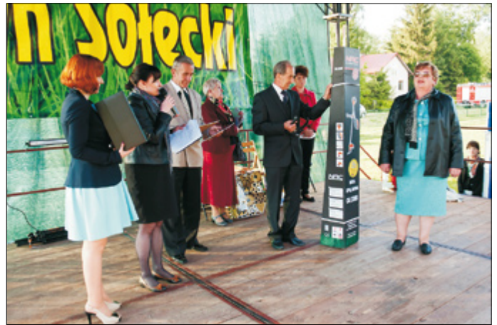
Wybory Sołtysa Roku