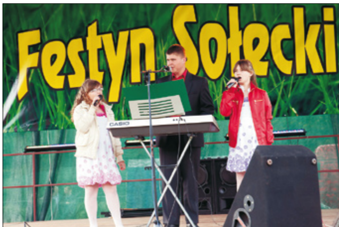
Zespół „Dwie plus jeden” podczas Festynu Solecckiego