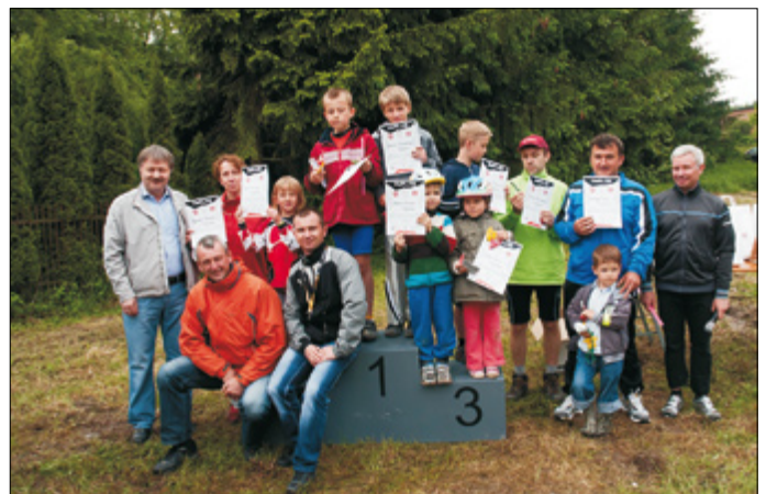
Urzędowscy uczestnicy wyścigu