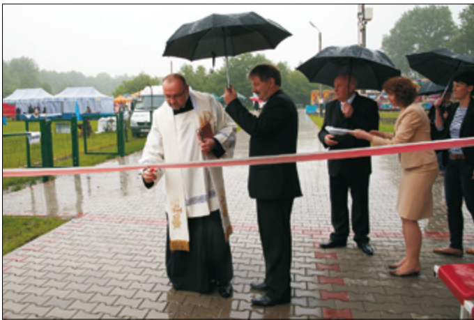
Poświęcenie i oficjalne otwarcie wyremontowanego obiektu sportowego podczas Dni Urzędowa