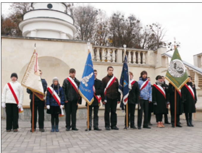
Delegacja szkoły ze sztandarem na uroczystości Święta Niepodległości we Lwowie (na cmentarzu Orłąt Lwowskich)

10 listopada 2011 r. w Zespole Szkół im. Orłąt Lwowskich odbyła się uroczysta akademie z okazji Święta Niepodległości. Młodzież w zaprezentowanej części ar-