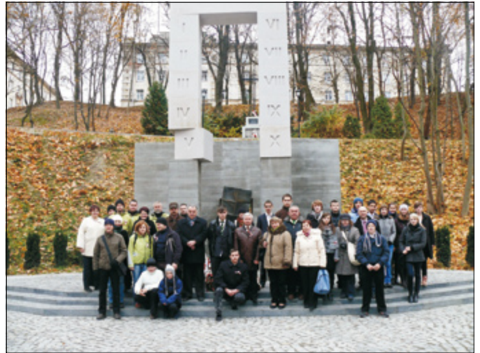
Delegacja szkoły na uroczystości Święta Niepodległości we Lwowie (pomnik pamięci profesorów lwowskich uniwersytetów pomordowanych na Wzgórzach Wuleckich przez hitlerowców w 1941 r.)

„Nie uda się pozbawić nas niepodległości. Wiele tysięcy naszych rodaków padło w tej drodze w czasie walki, wiele tysięcy znalazło się w więzieniach, na Wschodzie i w innych miejscach, wiele tysięcy zostało zmuszonych do emigracji. Polska otrzymała niepodległość nie tylko w wyniku tego, że pierwsza wojna światowa zakończyła się klęską wszystkich trzech zaborców. Polska odzyskała niepodległość dlatego, że podjęła o nią walkę, że zbudowała wszystko co jest potrzebne do tego, żeby państwo stworzyć, obronić je i wywalczyć jego granice”.