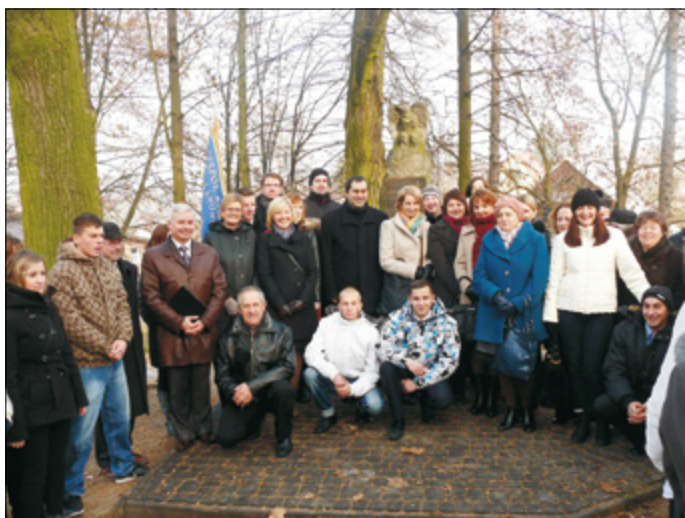
Uroczystość Dnia Patrona (zdjęcie przy pomniku na wałach)