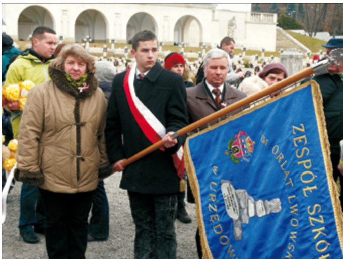
Delegacja Zespołu Szkół im. Orłąt Lwowskich z Urzędowa ze sztandarem na uroczystości Święta Niepodległości we Lwowie (na cmentarzu Orłąt Lwowskich)