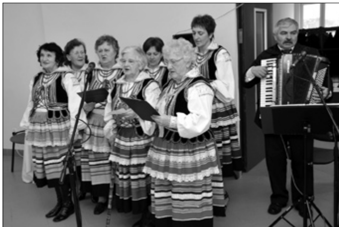
Zespół śpiewaczy „Malinki” podczas uroczystości 50-lecia Koła Gospodyń Wiejskich w Bobach Księżych

Zespół śpiewaczy „Malinki” powstał przy Kole Gospodyń Wiejskich w Bobach Księżych w roku 1976. Inicjatorkami powołania zespołu były członkinie Koła utalentowane wokalnie i chcące ocalić od zapomnienia kulturę ludową wsi. W skład zespołu wchodziło 10 osób.