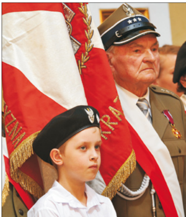
Gminne obchody Święta Konstytucji 3 Maja