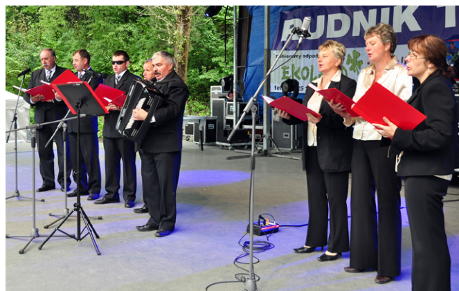
Zespół Vox Celestis podczas Dożynek Powiatowych w Kraśniku