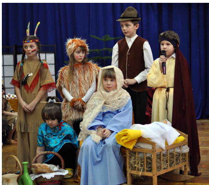
Inscenizacja pt. „Gwiazda” w wykonaniu uczniów Zespołu Szkół w Skorzycach z okazji Dnia Babci i Dziadka