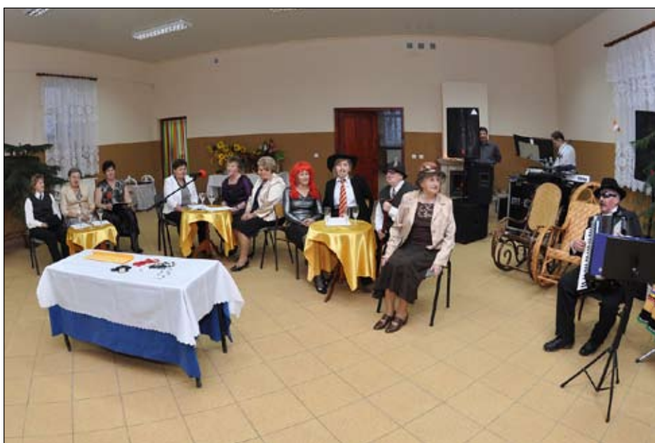
Występ zespołu artystycznego KGW Moniaki