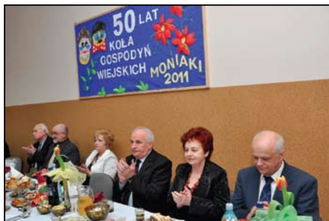
Goście podczas jubileuszu

Po części oficjalnej odbyło się krótkie przedstawienie teatralne przygotowane przez panie z Koła mówiące o życiu w wiejskiej społeczności, o ludzkich wadach i zaletach, wszystko w humorystycznej konwencji, na wesoło. Na takiej uroczystości nie mogło zabraknąć pysznych potraw przygotowanych przez kobiety z KGW w Moniakach. Przystąpiono więc do biesiady połączonej z zabawą taneczną.