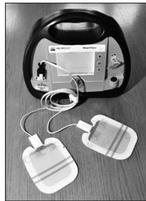
Jeden z czterech zakupionych defibrylatorów

Wykonano stan surowy rozbudowy Ośrodka Zdrowia w Moniakach tak, aby spełnić wymagania prawne i nie instalować kosztownej windy.