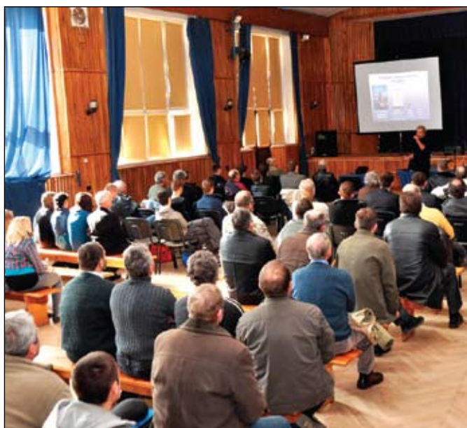
Wykłady podczas Dni Kultury Rolnej w gminie Urzędów