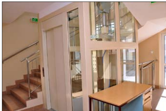
Winda w Ośrodku Zdrowia w Urzędowie

Drugie co do wielkości zaangażowanych środków z funduszy unijnych i środków własnych zadanie to „Dostosowanie do nowych uwarunkowań prawnych Ośrodków Zdrowia w gminie Urzędów” i zakupy sprzętu medycznego. Prognozowany koszt to kwota około 2,3 mln zł, przy czym wydatki poniesione w roku 2010 wyniosły 1 mln 264 tys. zł, a uzyskana refundacja funduszy unijnych to kwota 619 tys. zł. Zadanie to realizowane jest z funduszy unijnych pozyskiwanych w ramach Regionalnego Programu Operacyjnego dla województwa lubelskiego.