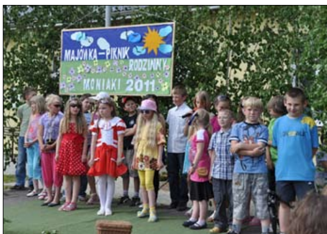
Występy artystyczne uczniów Szkoły Podstawowej w Moniakach podczas Pikniku Rodzinnego