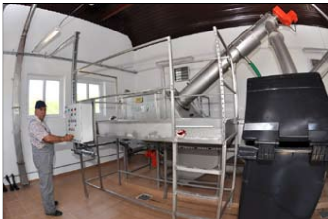
Sitopiaskownik wraz z budynkiem

przetargu to kwota 3 mln 895 tys. zł, przy czym wydatki w roku 2010 na to zadanie wyniosły 2 mln 134 tys. zł przy kwocie 1 mln 343 tys. zł zewnętrznego