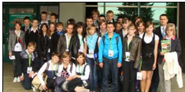
Pamiątkowe zdjęcie przed budynkiem Centrum Kongresowego Uniwersytetu Przyrodniczego