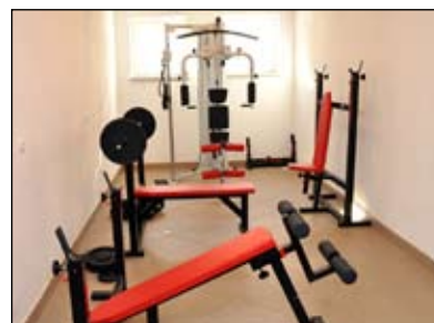
Fragment siłowni w świetlicy środowiskowej w Moniakach

Porozumienie zainteresowanych organizacji tj. OSP, KGW, Rady Sołeckiej, Rady Rodziców, Związku Sadowników RP, sołectwa Moniaki, gminy i GOK-u umożliwiło utworzenie świetlicy środowiskowej w Moniakach, gdzie mieści się siłownia i wyposażenie potrzebne do wykorzystania budynku na różne cele. Beneficjentem tego zadania był Gminny Ośrodek Kultury, a wydatki wyniosły 513 tys. zł. Uzyskane fundusze unijne to 284,4 tys. zł, a dotacja udzielona GOK-owi na ten cel – 228,6 tys. zł.