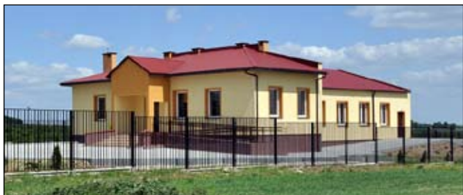
Dom Wiejski w Józefinie

Budowany był w ramach dofinansowania z funduszy unijnych (PROW-u) Wiejski Dom Kultury w Bobach Wsi. W roku 2010 zrealizowano wydatki w kwocie 400 tys. zł, które w części tj. kwota 245,9 tys. zł pokryte zostały w ra-