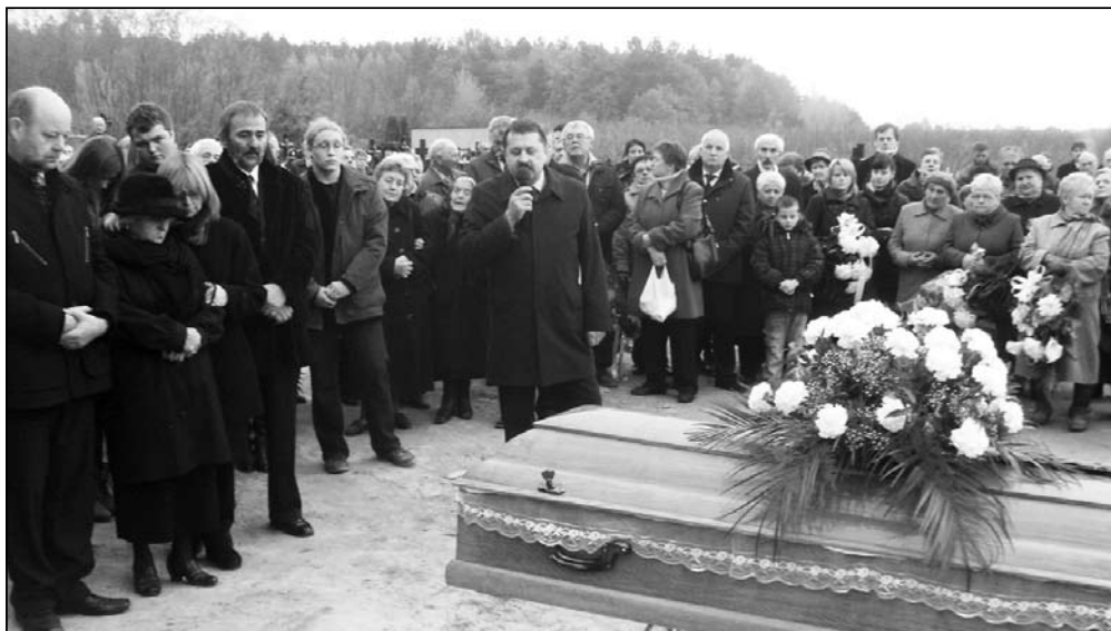
Uroczystość pogrzebowa