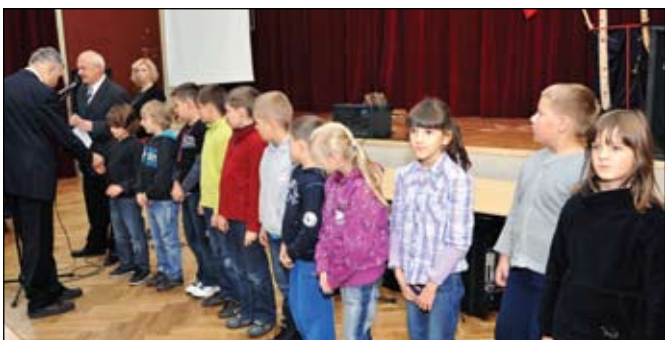
Wręczenie odznak turystyki kwalifikowanej

Ostatni dzień XXV edycji Dni Kultury Zdrowotnej połączony był z obchodami 93. rocznicy Odzyskania Niepodległości przez Polskę. O godz. 10.00 została odprawiona Msza Święta za Ojczyznę w kościele para-