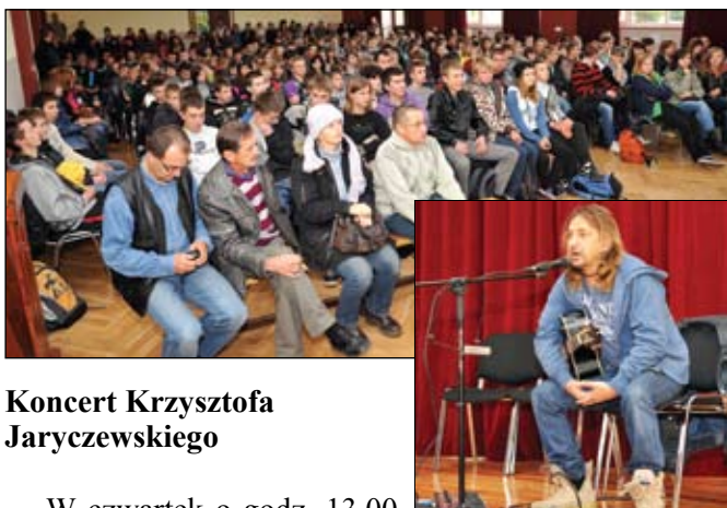
Koncert Krzysztofa Jaryczewskiego

Dni Kultury Zdrowotnej rozpoczęły się w środę o godz. 12.45 w sali Gminnego Ośrodka Kultury w Urzędowie koncertem z zakresu profilaktyki antynarkotykowej pt. „Twoje życie, Twój wybór” w wykonaniu Krzysztofa Jaryczewskiego – pierwszego lidera zespołu Oddział Zamknięty.