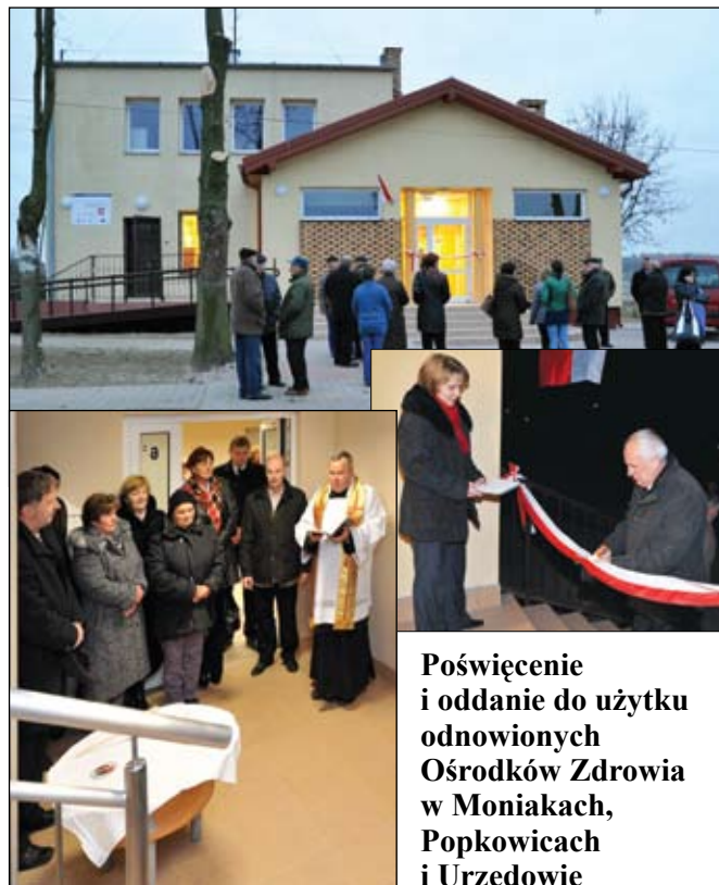
Poświęcenie i oddanie do użytku odnowionych Ośrodków Zdrowia w Moniakach, Popkovicach i Urzędowie

fialnym w Urzędowie. O godz. 11.00 nastąpiło złożenie kwiatów pod pomnikami Józefa Piłsudskiego i Orłąt Lwowskich. Po tych uroczystościach odbyła się akademicka poświęcona Świętu Odzyskania Niepodległości.