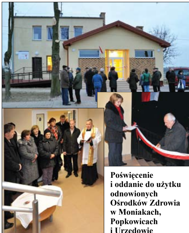
Poświęcenie i oddanie do użytku odnowionych Ośrodków Zdrowia w Moniakach, Popkovicach i Urzędowie

fialnym w Urzędowie. O godz. 11.00 nastąpiło złożenie kwiatów pod pomnikami Józefa Piłsudskiego i Orłąt Lwowskich. Po tych uroczystościach odbyła się akademicka poświęcona Świętu Odzyskania Niepodległości.