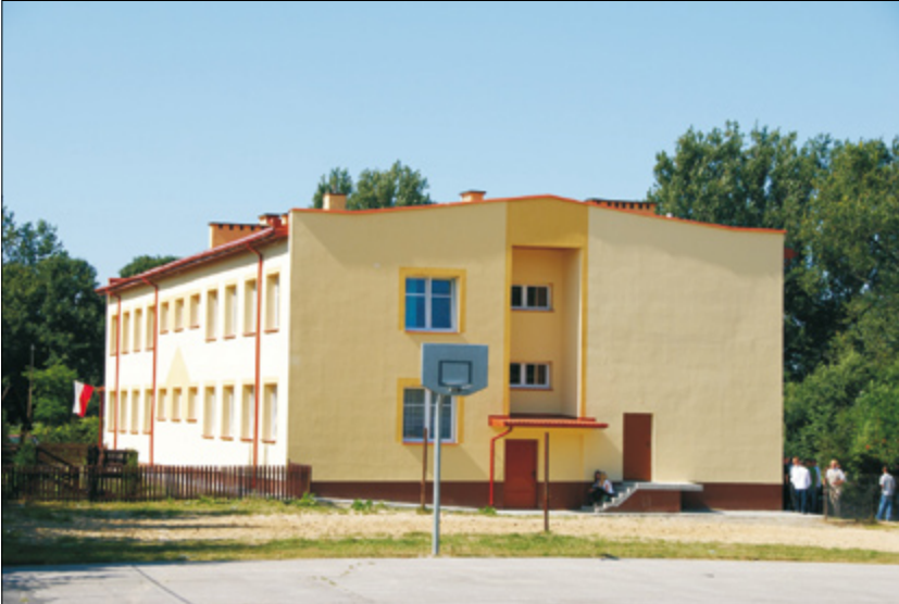
Przedszkole w Urzędowie

Realizowaliśmy dwa zadania dotyczące ochrony środowiska – modernizację oczyszczalni w Urzędowie i budowę kanalizacji ciśnieniowej w Bęczynie. Koszt ogólny zadania