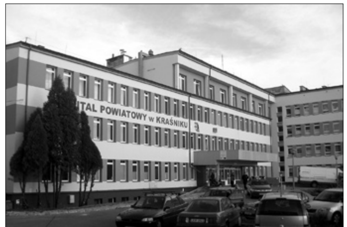
Szpital Powiatowy w Kraśniku przed (z lewej) i po remoncie

Zakaźny, sprywatyzowano Podstawową Opiekę Zdrowotną i Stację Dializ Pozaustrojowych. Oddział Chirurgii Ogólnej i Oddział Chirurgii Urazowej został połączony w jeden chory twór o nazwie Oddział Chirurgii Ogólnej i Urazowej. Stan budynków był tragiczny, fatalna także sytuacja finansowa i wewnętrzna atmosfera w zakładzie.