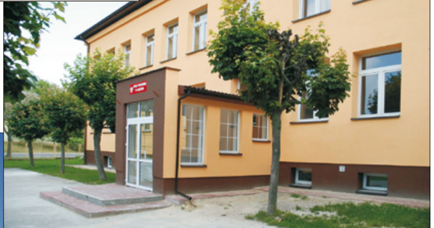
Szkoła Podstawowa w Leszczynie

Przygotowaliśmy kilkanaście projektów unijnych na kwotę prawie 10 mln. zł, przy czym dwa