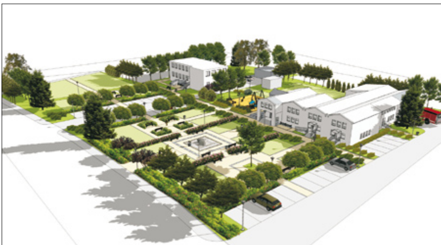
Przestrzeń publiczna w Popkowicach – koncepcja

W ramach rządowego programu zabezpieczenia dna wąwozu pozyskaliśmy kwotę 1 mln 123 tys. zł.