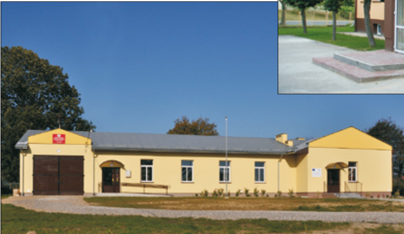
Świetlica w Moniakach

to kwota ponad 4 mln. zł w tym 615 tys. euro dofinansowania w ramach bardzo trudnego programu Norweski Mechanizm Finansowy – Europejski Obszar Gospodarczy. Opracowana