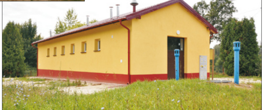
Ujęcie wody w Urzędowie – stacja wodociągowa

Realizując zadania w obszarze poprawy bazy lokalowej dla potrzeb oświaty, wykonana została termomodernizacja obiektu Szkoły Pod-