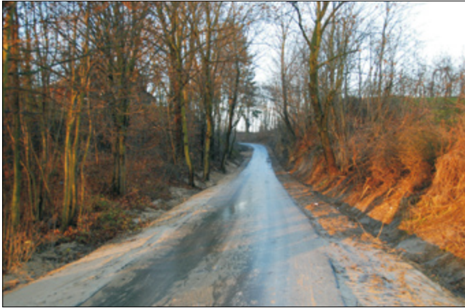
Droga gminna – Kozarów