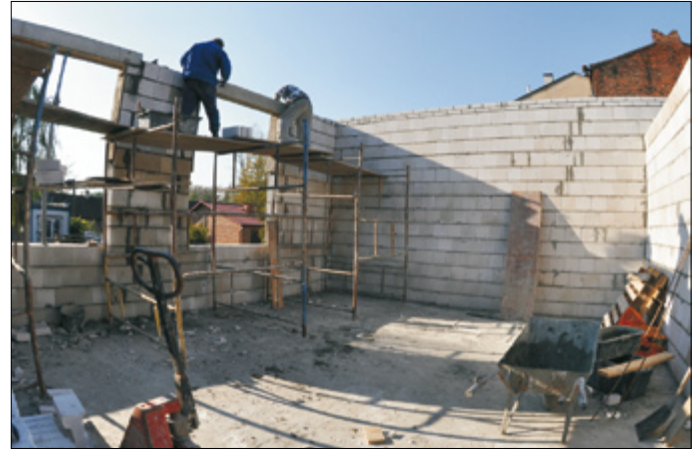
Budynek wielofunkcyjny w Urzędowie – rozpoczęcie budowy