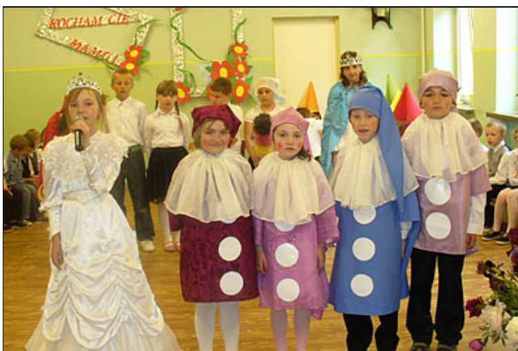
Występ z okazji Dnia Matki