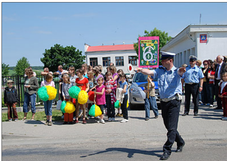
Akcja „Kierowca na szóstkę” podczas festynu rekreacyjno-sportowego w Skorczycach zorganizowana przez uczniów i Wydział Ruchu Drogowego Komendy Powiatowej Policji w Kraśniku