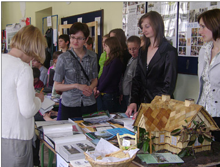
Rozmowy o projekcie