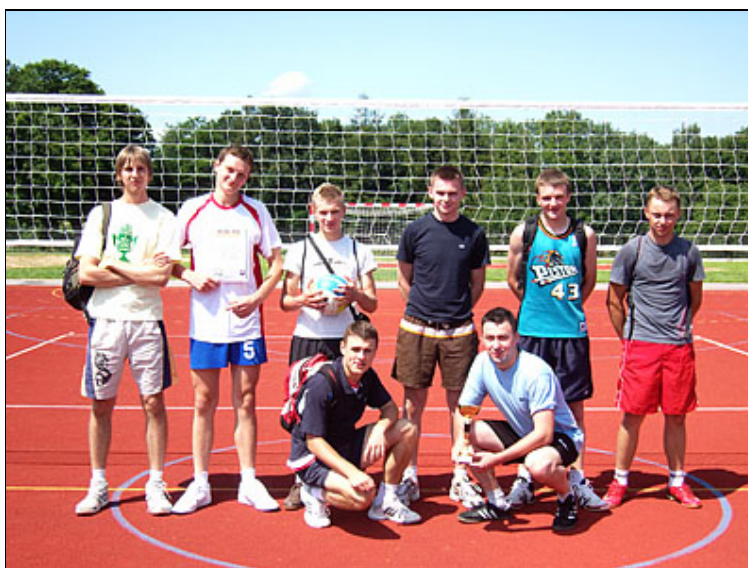
„Brazylia na wczasach”