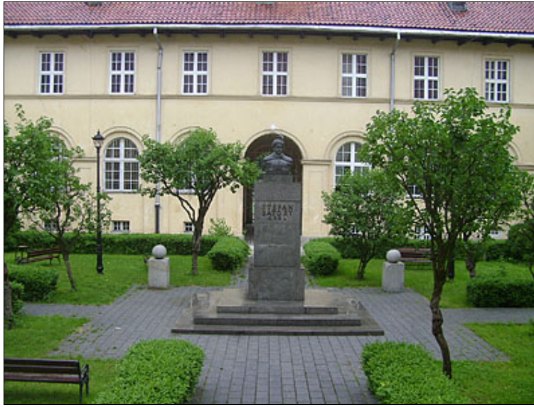
Dziedziniec Liceum Batorego