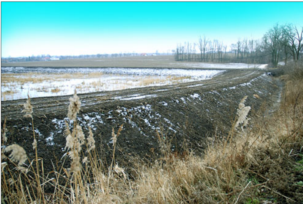
Budowa zbiornika retencyjno-rekreacyjnego w Skorzcycach