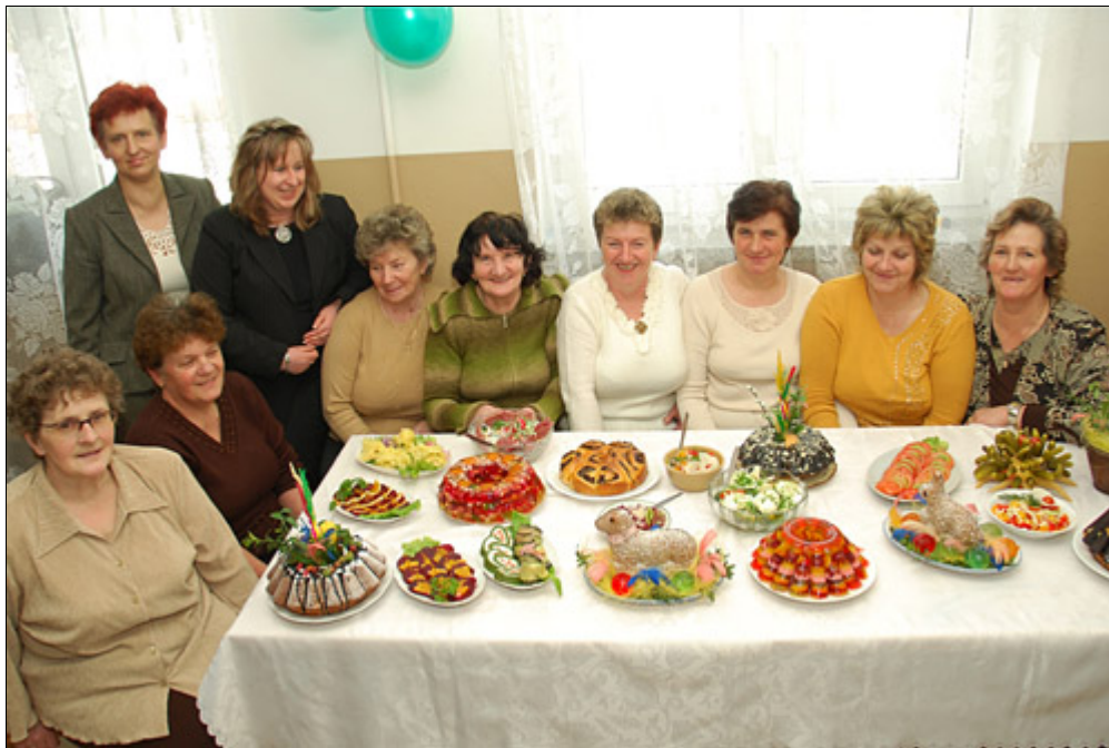
Prezentacja potraw świątecznych