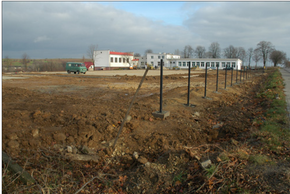
Boisko sportowo-rekreacyjne w Skorzcycach