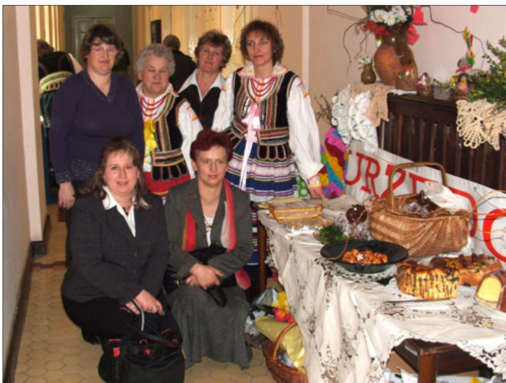
Uczestniczki Forum Rozwoju Przedsiębiorczości na Terenach Wiejskich

Kolejnym ważnym wydarzeniem był wyjazd kobiet na X Forum Rozwoju Przedsiębiorczości na Terenach Wiejskich – „Aktywne kobiety województwa lubelskiego”, które odbyło się w