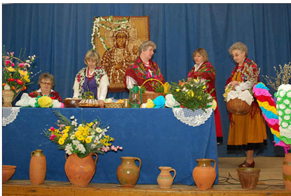
Widowisko artystyczne członkiń Koła Gospodyń Wiejskich z Moniak – Wielka Sobota w Paiecznicy