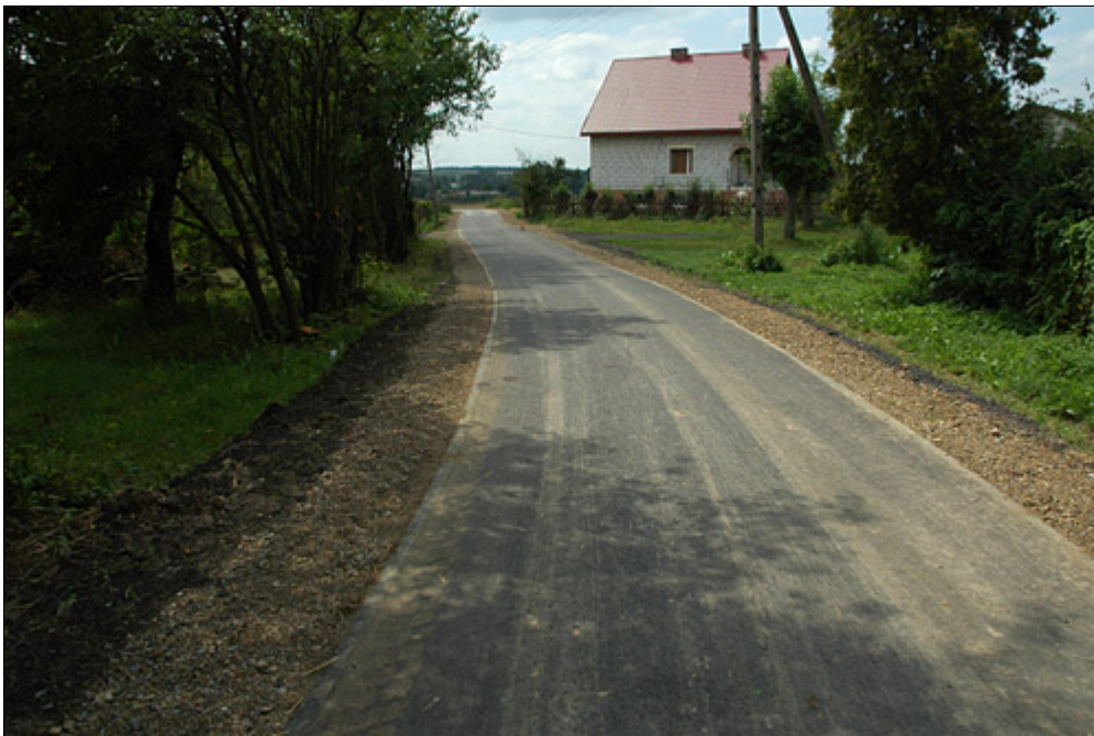
Zmodernizowana droga w Skorzcycach

Za realizację zadań w roku 2007 wszystkim, którzy bezpośrednio uczestniczyli i wspierali nasze działania, składam samorządowe podziękowania.