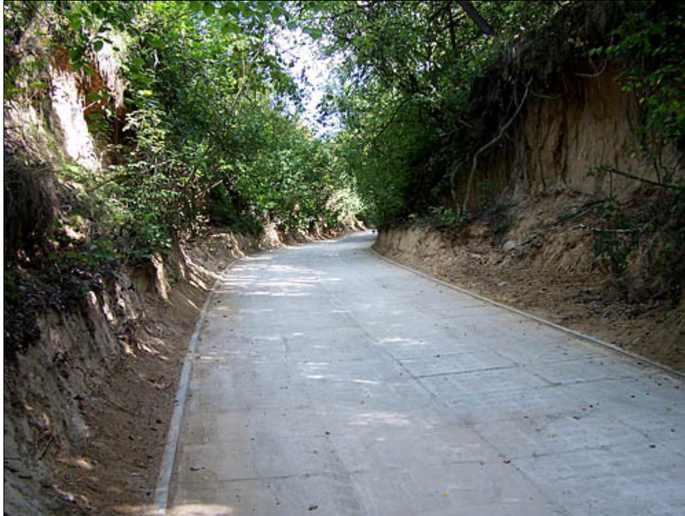
Poprawa przejezdności – wąwóz w Wierzbicy

W roku 2007 przedłużyliśmy działalność Gminnego Centrum Informacji w Urzędowie, z którego od początku istnienia skorzystało 3880 osób, w roku 2007 – 1698 osób. Mamy kolejne przemyślenia kierowane do młodzieży, które będą realizowane w roku 2008. Jak każdego roku na przełomie lutego i marca (w roku 2007 było to 5–9 marca) organizowaliśmy Dni Kultury Rolnej. Intencją tych spotkań na przednówku jest przekazywanie rolnikom istotnych, naszym zdaniem, informacji mających wpływ na podejmowanie decyzji w gospodarstwach rolnych. W ramach Dni Kultury Rolnej z wykładów i informacji przydatnych rolnikom skorzystały 483 osoby.