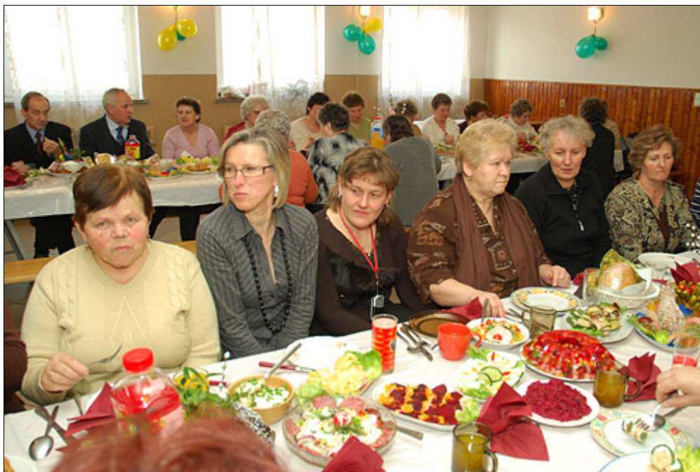
Wspólna degustacja potraw