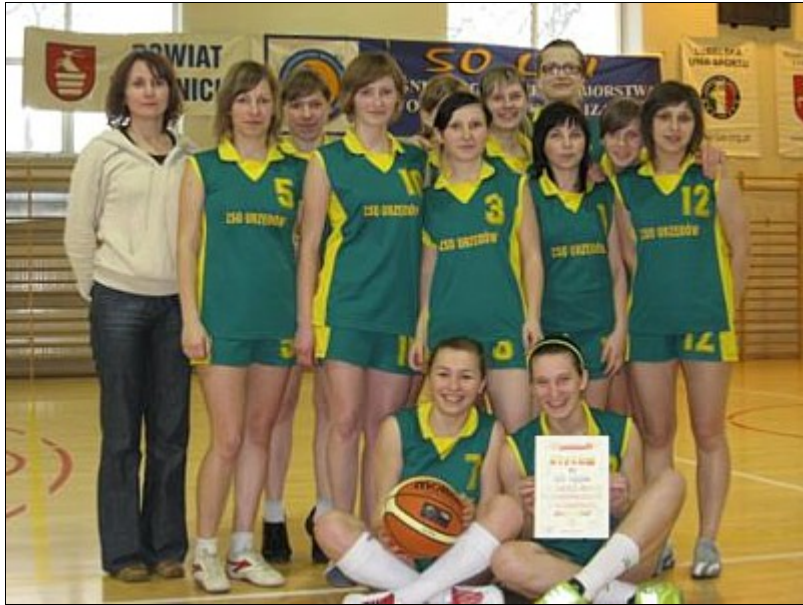
Żeńska drużyna koszykówki LO