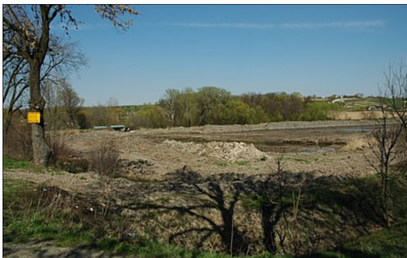
Trwa budowa zbiornika retencyjnego w Skorzycach