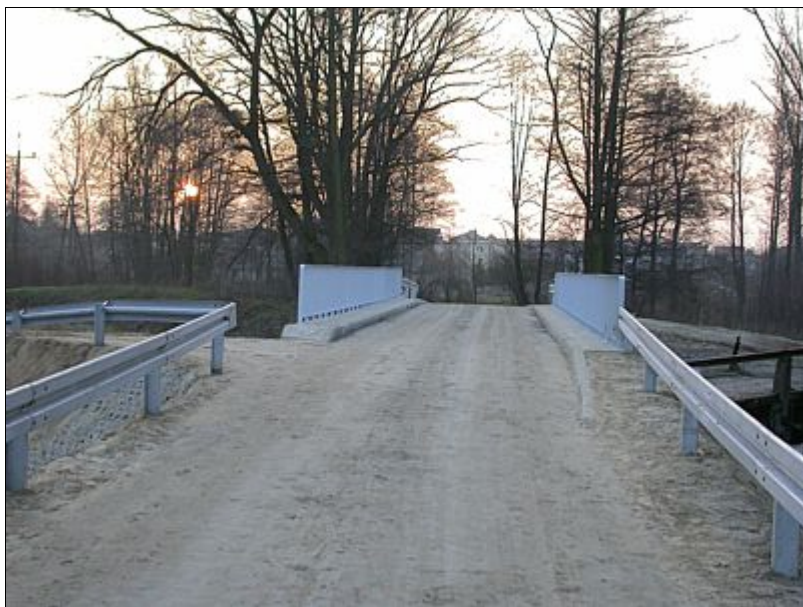
Most na Urzędówce

Na inwestycje liniowe wydatkowano kwotę 77 tys. złotych głównie na dokończenie zaopatrzenia w wodę mieszkańców Zadworza i realizację nowego zadania w Popkowicach Księżych.