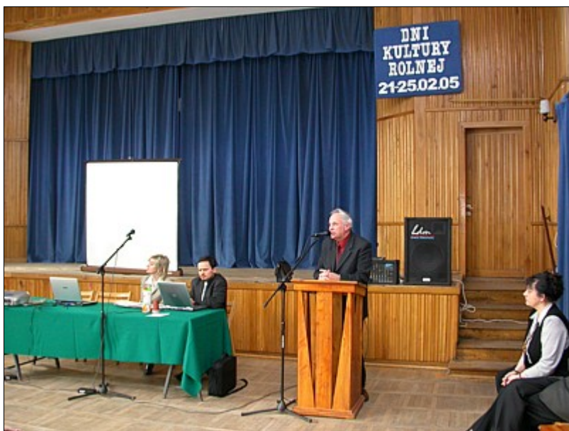
Prelegenci podczas "Dnia ekologicznego"

Uzyskana w ten sposób żywność jest certyfikowana, producent nie może być anonimowy, każda partia jest ściśle oznakowana i nie opłaca się próbować nieuczciwych praktyk. Zachęcające są takie fakty, jak: