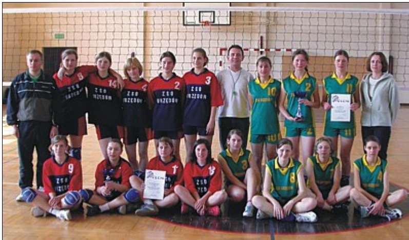
Fot. W strojach czerwono-granatowych drużyna gimnazjum, a w strojach żółto-zielonych zespół LO.