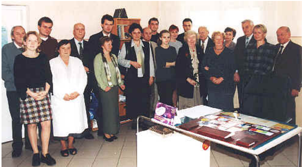
Lekarze biorący udział w XX Dniu Konsultacji