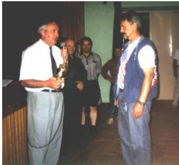
Wręczenie pierwszej nagrody

Turniej przebiegał w miłej i sportowej atmosferze.