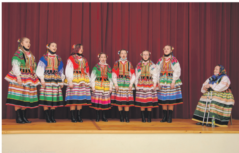
Zwycięzcy tegorocznego przeglądu w Urzędowie.

Zadanie finansowanie z Gminnego Programu Profilaktyki i Rozwiązywania Problemów Alkoholowych oraz Przeciwdziałania Narkomanii.