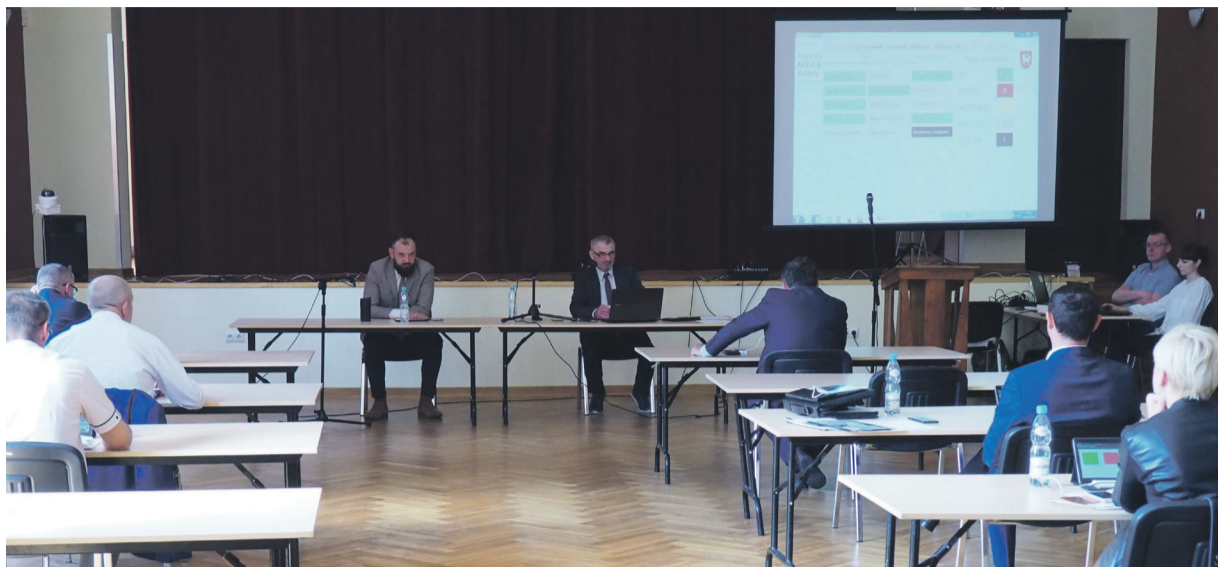
Majowa sesja RM w Urzędzie.

Dnia 27 maja br. w sali widowiskowej Ośrodka Kultury w Urzędzie ul. B. Dzikowskiego 1, miała miejsce XXXIII sesja Rady Miejskiej tzw. absolutoryjna. Absolutorium to jeden z najistotniejszych ustawowych środków kontroli rady nad działalnością burmistrza. Dodatkowo, zgodnie z ustawą o samorządzie gminnym, samorządy mają obowiązek opracowania do końca maja Raportu o stanie gminy, który jest podsumowaniem pracy Burmistrza w roku poprzednim. Sama procedura przygotowania sesji absolutoryjnej trwała dość długo. Rozpoczęła się przedstawieniem radzie miejskiej w miesiącu marcu sprawozdania z wykonania budżetu gminy za rok 2020 przedłożonego wraz z informacją o stanie mienia komunalnego. Sprawozdanie to zostało następnie zaopiniowane przez Regionalną Izbę Obrachunkową w Lublinie. Dnia 12 maja odbyło się posiedzenie Komisji Rewizyjnej, na którym członkowie komisji rozpatrzyli przedłożone przez burmistrza sprawozdanie wraz z dodatkowymi bilansami. Efektem posiedzenia tejże komisji była uchwała pozytywnie opiniująca wykonanie budżetu gminy za rok 2020 oraz wystąpienie do Rady Miejskiej z wnioskiem o udzielenie absolutorium. Wniosek został skierowany przez prze-