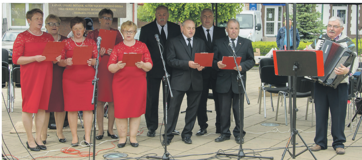
...oraz Vox Celestis, działające przy OK w Urzędowie.