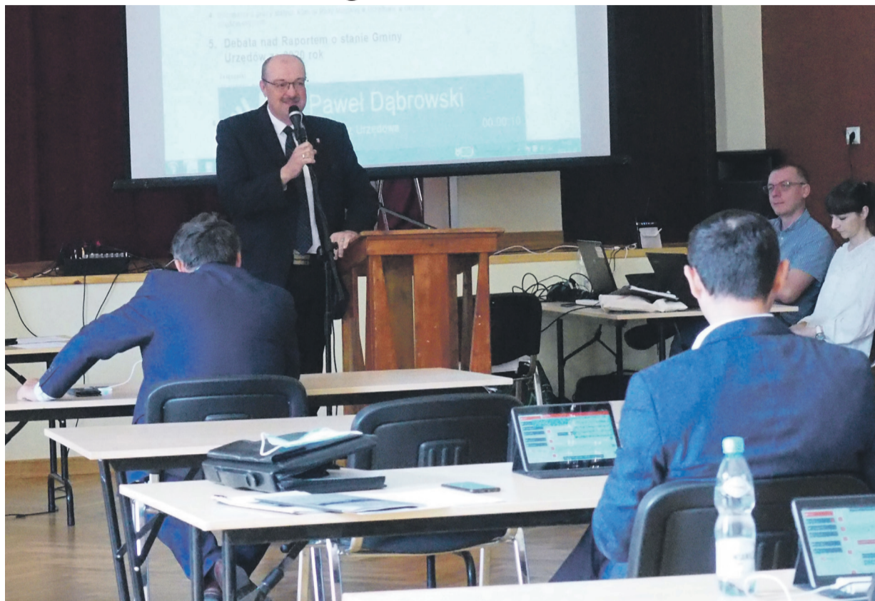
Burmistrz Urzędowa omówił m. in. ubiegłoroczne zadania inwestycyjne.

Termomodernizacja Zespołu Szkół Ogólnokształcących im. Władysława Jagiełły w Urzędowie to zadanie również realizowane było w oparciu o pozyskane środki finansowe. W zakresie przeprowadzonych w szkole prac znalazły się: wymiana stolarki okiennej i drzwiowej, docieplenie ścian i fundamentów budynku szkoły, łącznika oraz sali gimnastycznej, przedłużenia dachu, wymiana parapetów zewnętrznych, rynien i rur spustowych. Wartość tych robót budowlanych to 1 767 093, 52 zł. W zakresie prac wpisano też montaż instalacji fotowoltaicznej, do-