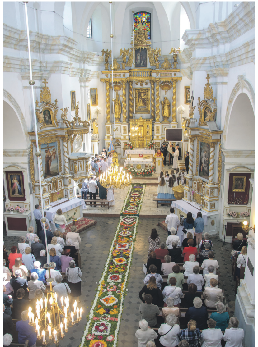
Urzędowski kwiatowy dywan miał długość 45 m.