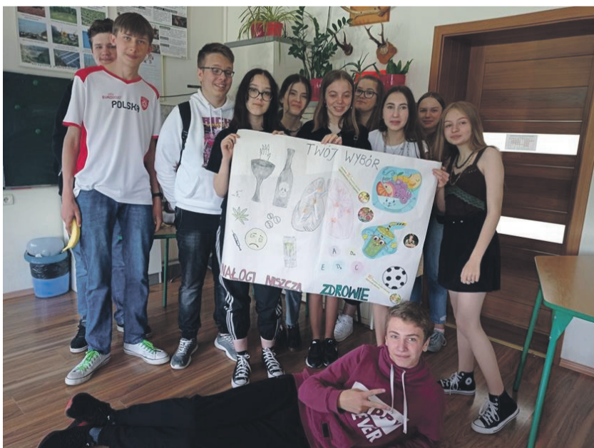
Prezentacja profilaktycznego plakatu.