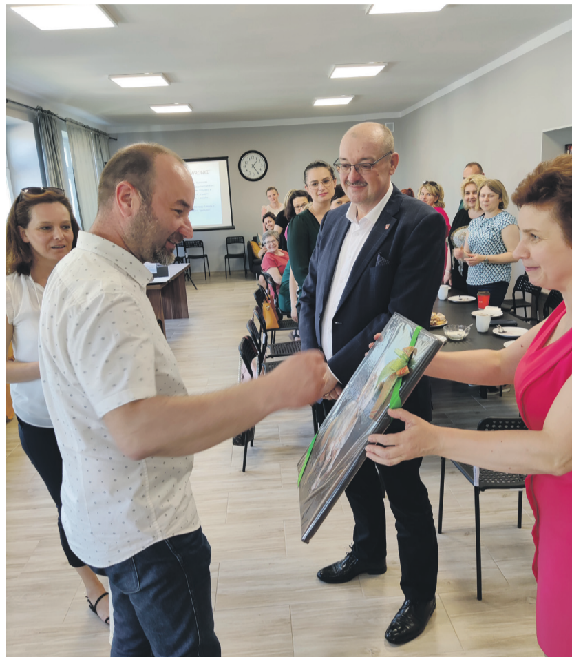
Oficjalne spotkanie burmistrzów Brańska i Urzędowa.

Projekt „Wysoka jakość pracy socjalnej w OPS Urzędów” realizowany w ramach Osi priorytetowej II. Efektywne polityki publiczne dla rynku pracy, gospodarki i edukacji Działania 2.5 Skuteczna pomoc społeczna Programu Operacyjnego Wiedza Edukacja Rozwój 2014-2020.