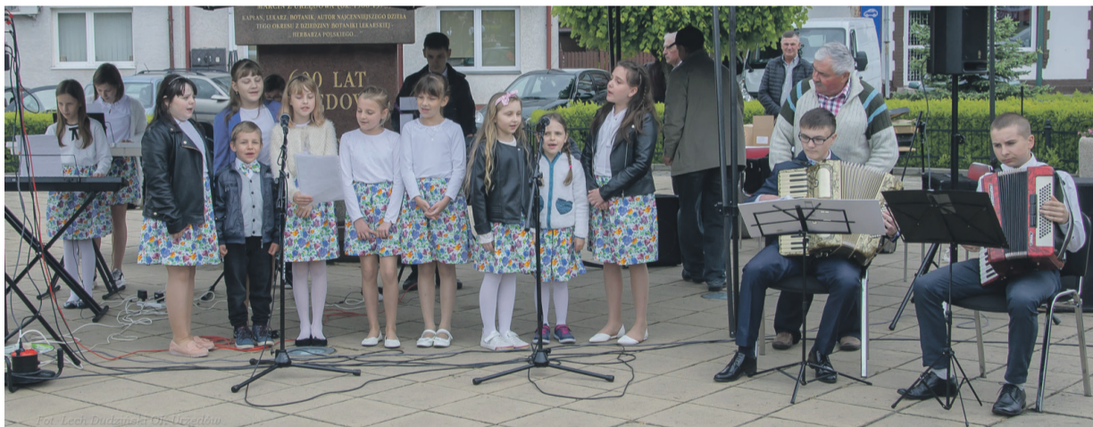
Wystąpiła grupa dzieci z zespołu „Wesołe Nutki”...