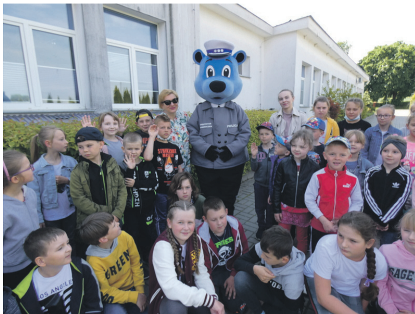
Dzieci odwiedził Inspektor Kraśniczek.

kał dodatkowy prezent – w ramach projektu w szkolnym ogrodzie powstał „Edukacyjny Kącik Profilaktyczny”, otwarty uroczystym przecięciem wstęgi przez Panią Dyrektora i dzieci w dniu ich święta. Na potrzeby tego miejsca zakupione zostały stoliki edukacyjne i gry dydaktyczne, a Rada Rodziców ufundowała efektowną budowlę – domek, w którym będą mogły bawić się wszystkie maluchy.