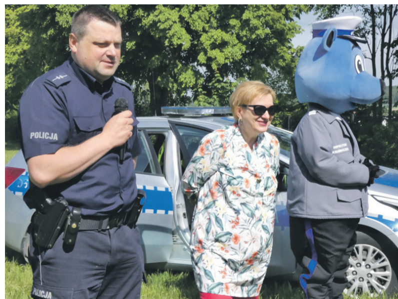
Przypomnienie zasad bezpieczeństwa na drogach.