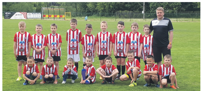
Grupa „Orlik” z trenerem, a wyżej z piłkarzami GKS „Orzeł” Urzędów i burmistrzem Urzędowa