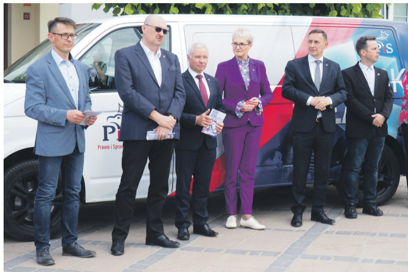
Prezentacja programu społeczno-gospodarczego.