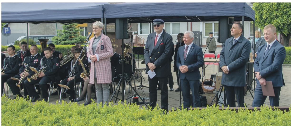
Oficjalne wystąpienia podczas Dni Urzędowa.