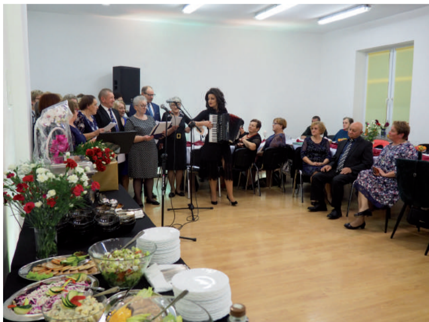
Seniorzy zaprezentowali swoje wokalne umiejętności.