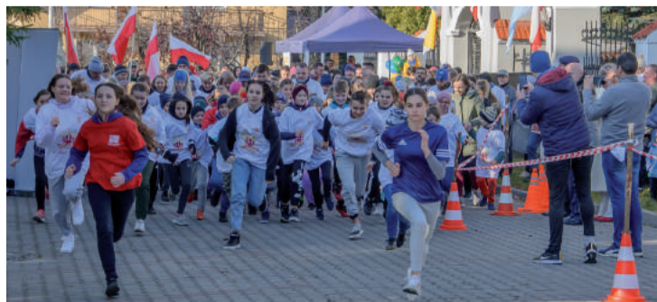
Uczestnicy „Biegu Kraśnickiego dla Niepodległej”