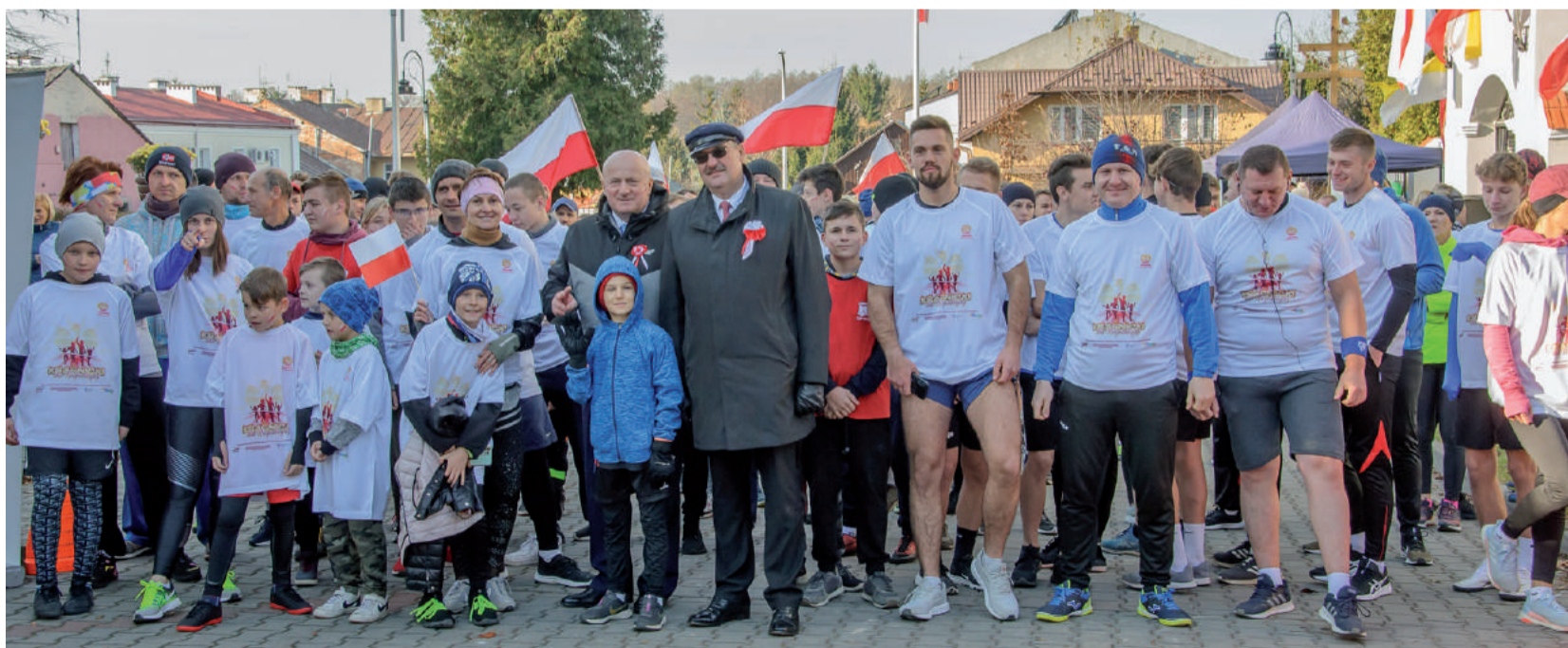
Przed startem na „czerwonej” trasie biegu „Kraśnicki dla Niepodległej”.