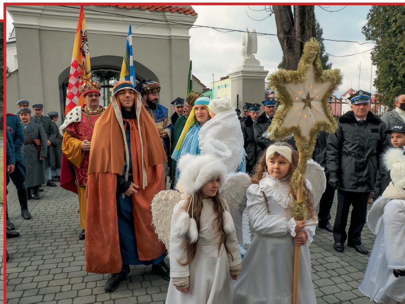
Mędrców do Jezusa prowadziła Betlejemka Gwiazda.