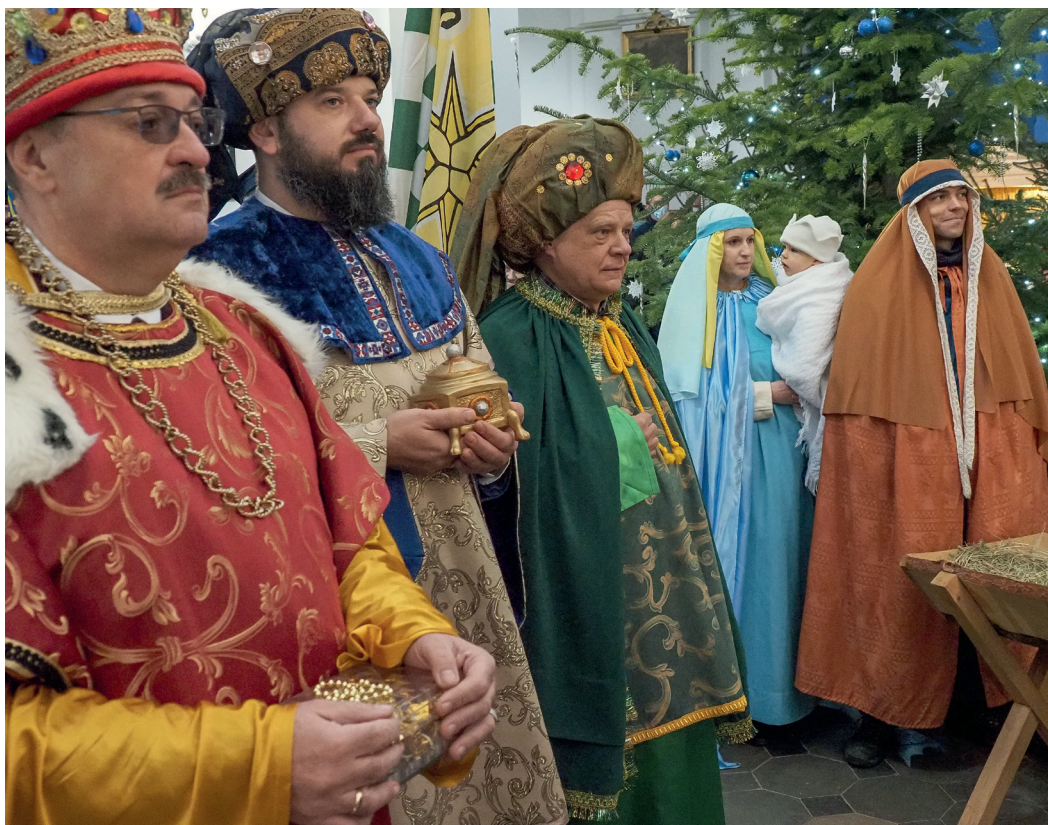
Uroczystość Objawienia Pańskiego w tym roku odbyła się bez barwnego orszaku.

owie oraz parafia w Urzędowie, zaś całe wydarzenie tradycyjnie odbyło się pod patronatem warszawskiej Fundacji Orszak Trzech Króli. JC