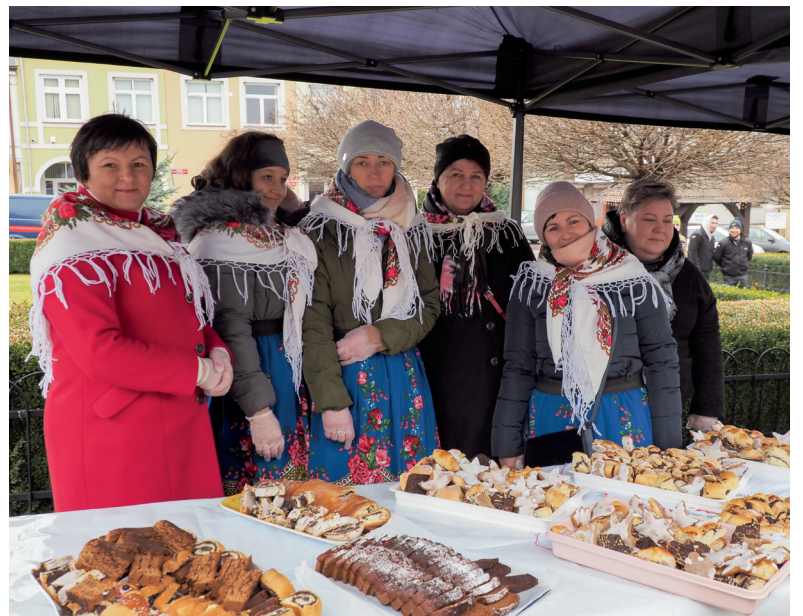
Wigilijne potrawy i słodkości przygotowały panie z KGW.