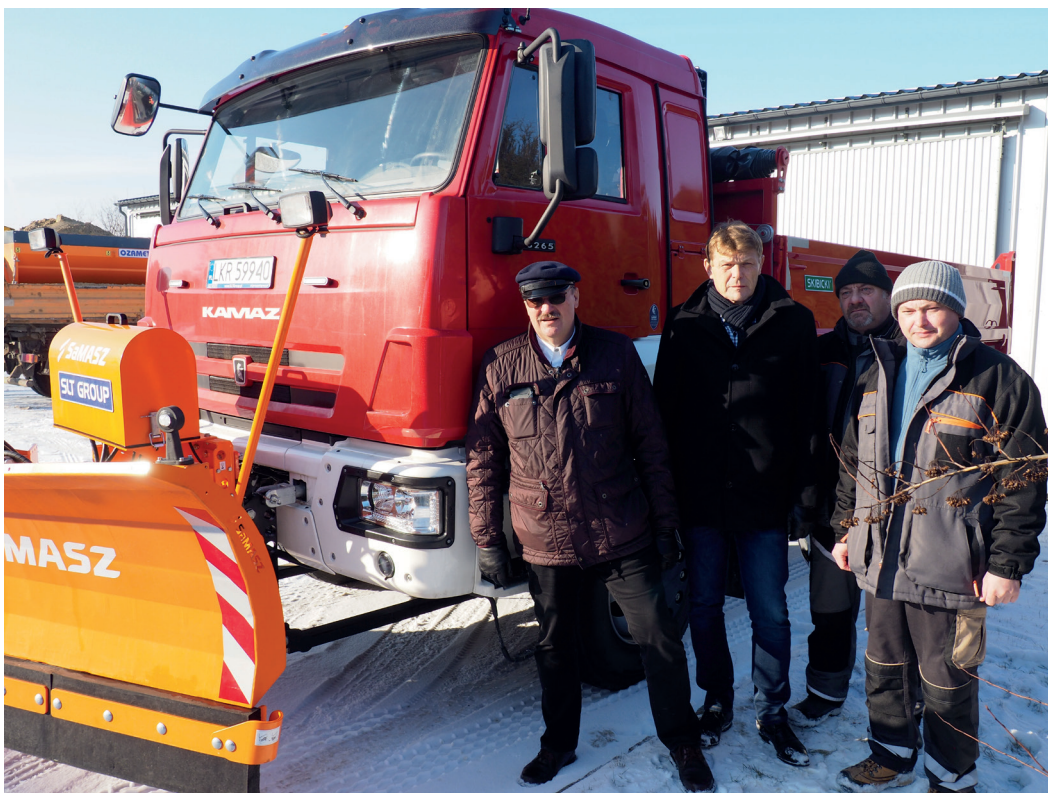
Auto będzie służyło m. in. do odśnieżania gminnych dróg.

Kamaz dołączył do dotychczasowego taboru zakładu, do którego należą: samochód ciężarowy Man z pługiem i piaskarką, koparka JCB 4cx, ciągnik Case z przyczepą, ciągnik C-360. Będzie służył głównie przy pracach z zakresu utrzymania dróg na terenie gminy. Jest opłacony, ubezpieczony i gotowy do jazdy. JC