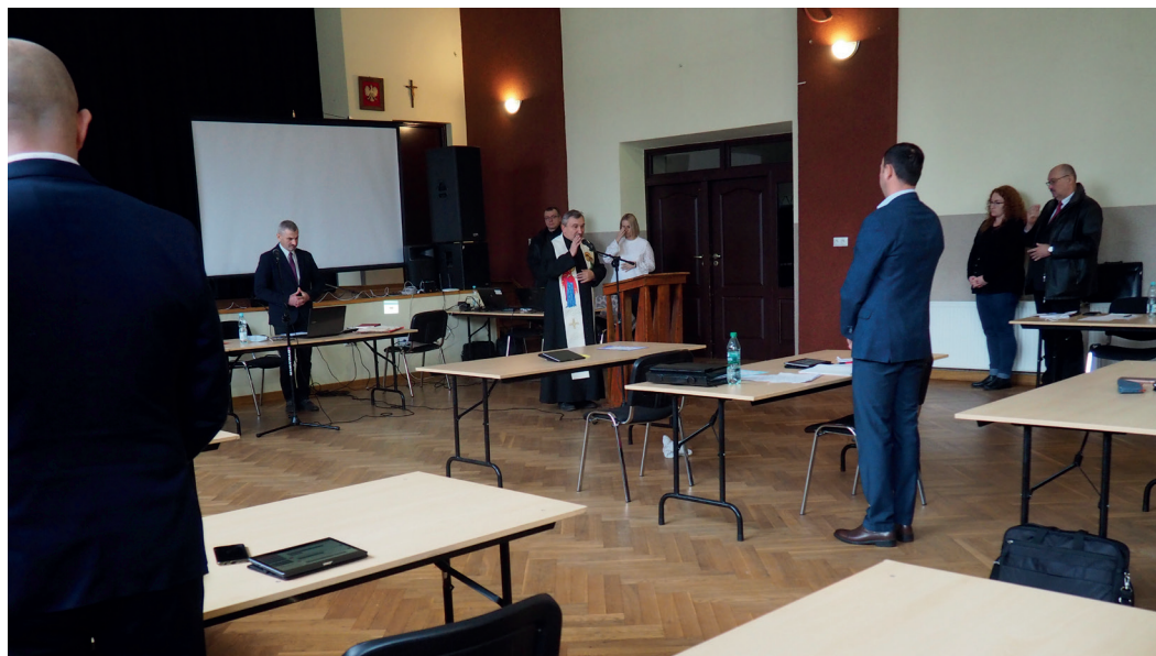
Część oplatkowa podczas grudniowej sesji Rady Miejskiej.

Dnia 6 grudnia 2021 r. w sali konferencyjnej Urzędu Miejskiego w Urzędowie ul. Rynek 12 miała miejsce XL sesja Rady Miejskiej w Urzędowie, zwołana na wniosek Burmistrza Urzędowa. Radni spotkali się, aby dokonać koniecznych zmian w budżecie gminy na rok 2021.