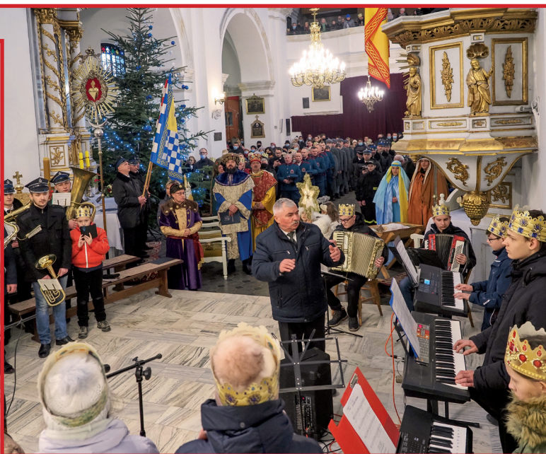
O muzyczną oprawę odpowiednio zadbał Jan Kowal.