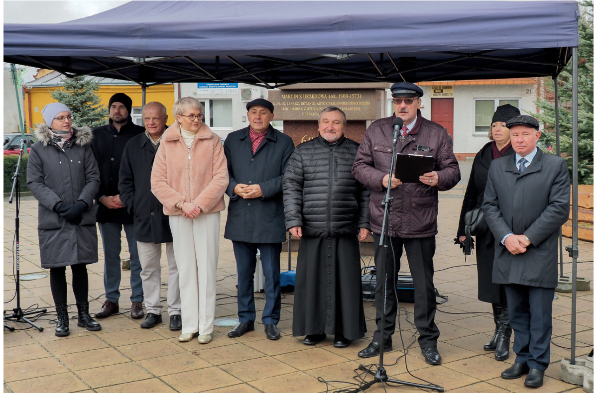
Władze samorządowe oraz goście przekazali mieszkańcom życzenia świąteczne.