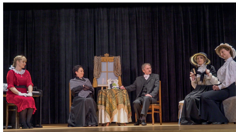
Aktorzy byli głośno oklaskiwani.

W dniu 28 listopada już po raz kolejny gościliśmy w naszym Ośrodku Kultury zaprzyjaźniony Amatorski Teatr Towarzyski z Lublina, który działa pod kierownictwem Dariusza Borucha . Tym razem mieliśmy przyjemność obejrzeć spektakl pt. „Teatr amatorski”. To jednoaktówka Michała Bałuckiego . Klasyczna komedia przedstawiająca zabiegi rodziców w celu wydania za mąż córki, romans młodych i intrygi starszych, ciekawe osobowości, zaskakująca puente. Przedstawiony został konflikt pokoleń w zabawnej formie i treści. Wspaniale spędzone popołudnie w miłym towarzystwie. Frekwencja mieszkańców świadczy o potrzebie organizowania kolejnych takich spotkań. TK .