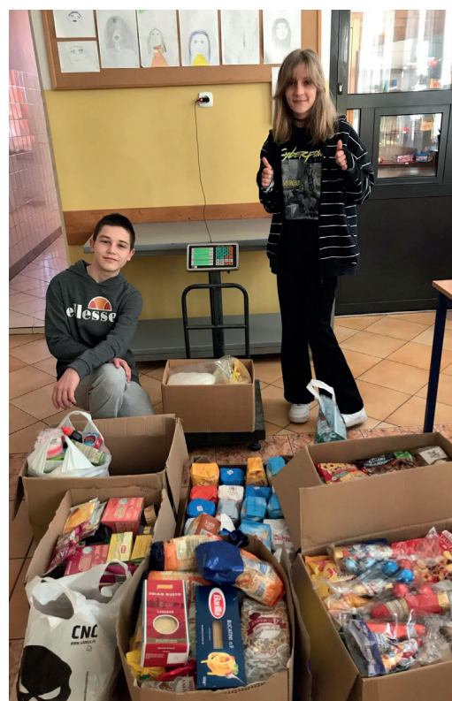
Zebrało blisko 100 kg żywności.

Drugie przedsięwzięcie, do którego włączyli się nasi uczniowie, to ogólnopolska akcja pt. „Pomóż dzieciom przetrwać zimę”. W dniach 3–16 grudnia 2021 r. odbyła się w naszej szkole wielka zbiórka darów. Dary z wielkim zapałem zbierali wszyscy: uczniowie, rodzice, nauczyciele i pracownicy szkoły. O pomoc poprosiliśmy także księży pracujących w parafii Boby, którzy z ogromnym zaangażowaniem odpowiedzieli na nasz apel