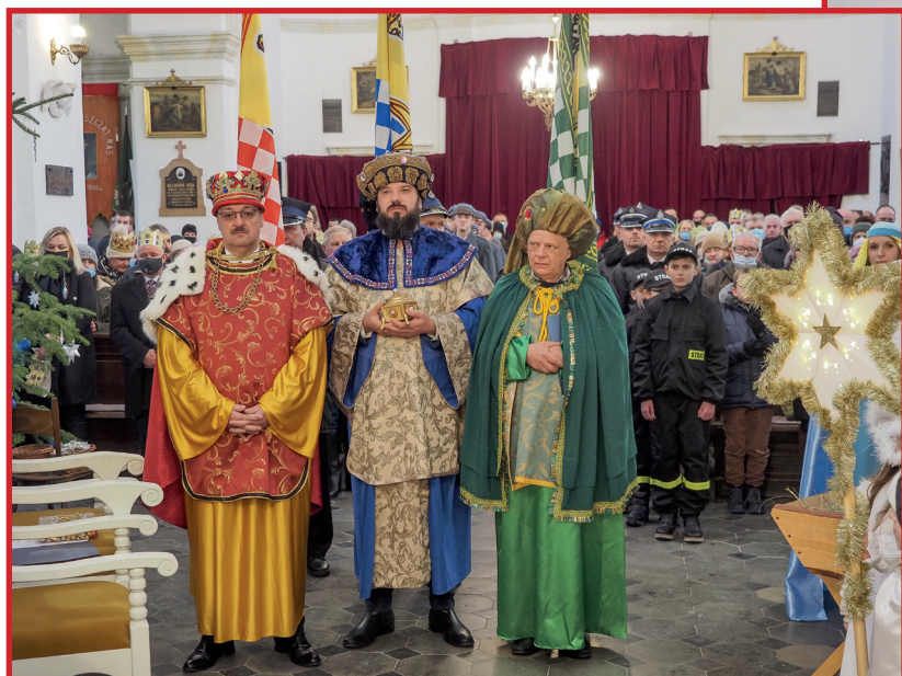
Trzej Monarchowie: Kacper, Baltazar i Melchior.