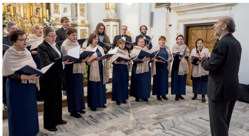
Występ Chóru spotkał się z zainteresowaniem publiczności.