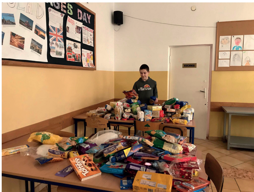
Uczniowie sami chętnie włączyli się w zbiórkę.