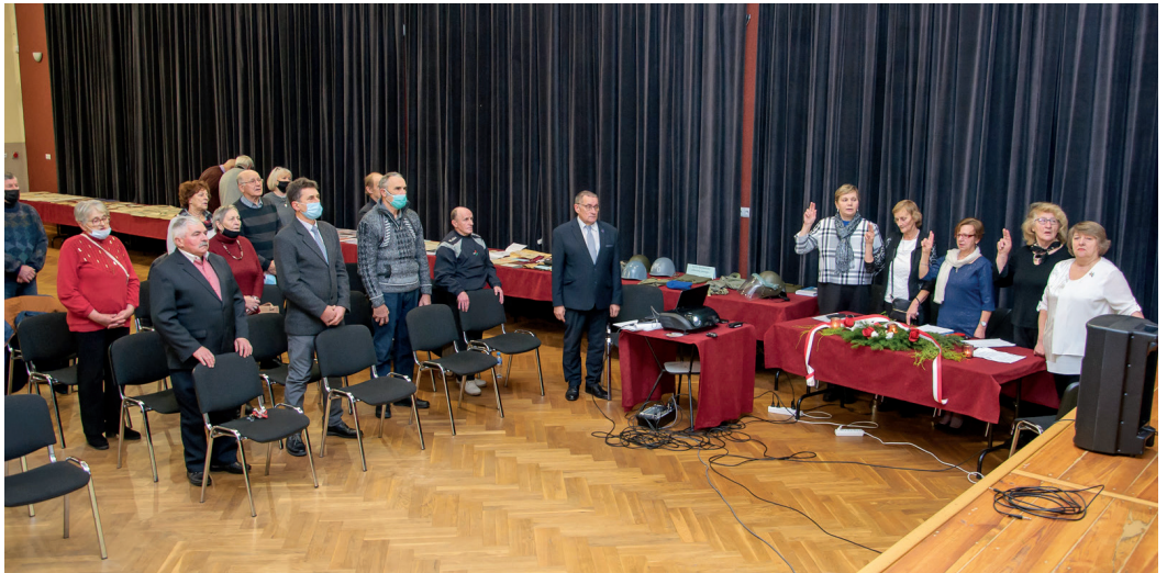
Spotkanie odbyło się w OK Urzędów

Dokumentem potwierdzającym działalność tego wielkiego Polaka była fotografia z jednej z manifestacji. To-