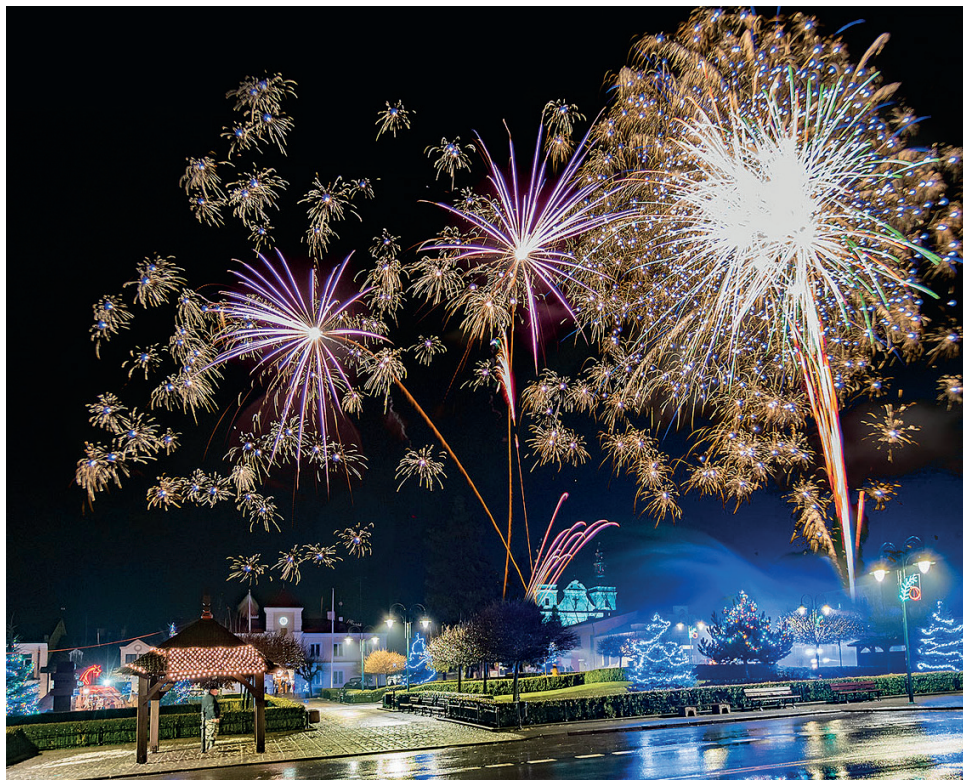
Urzędów wita Nowy Rok 2022.

Obydwaj władarze życzyli, by Nowy Rok obfitował w powodzenie w życiu prywatnym i zawodowym, by był źródłem radości, szczęścia oraz wszelkiej pomyślności. JC